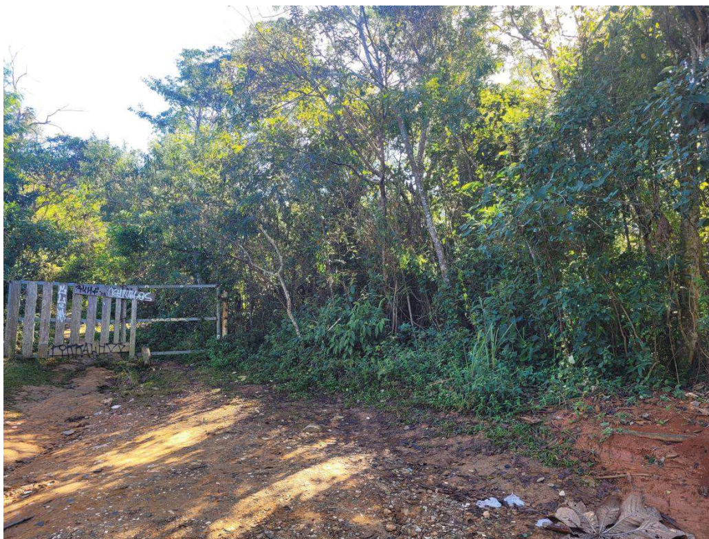
Imagem da porteira na entrada do terreno.