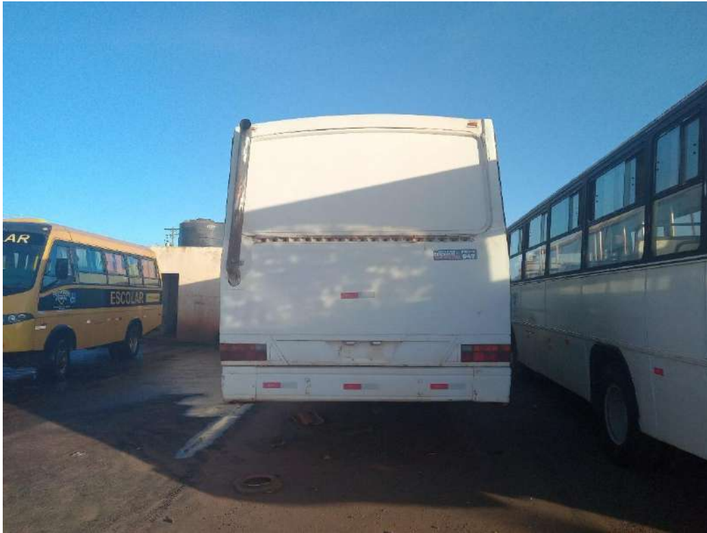
ONIBUS MERCEDES BENZ OF 1318 1990/1990 BRANCO CQH-8741 CHASSI: 9BM384088LB885389 PATRIMONIO: 8878