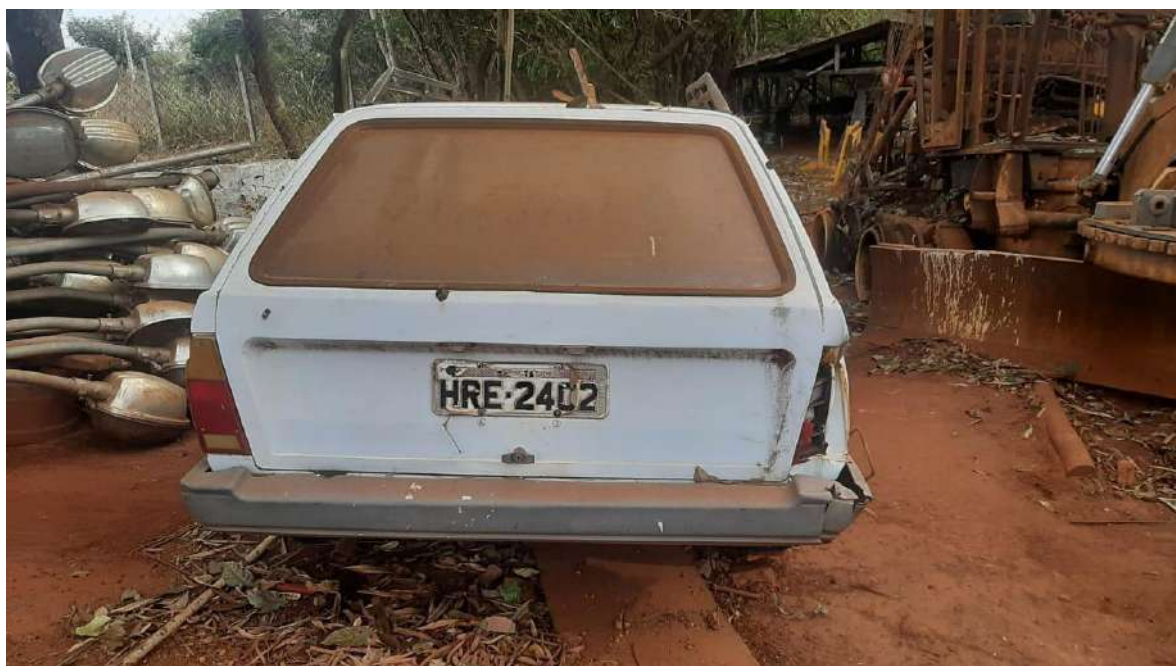
VOLKSWAGEN PARATI CL FAB/MOD: 1988/1988 COR BRANCA