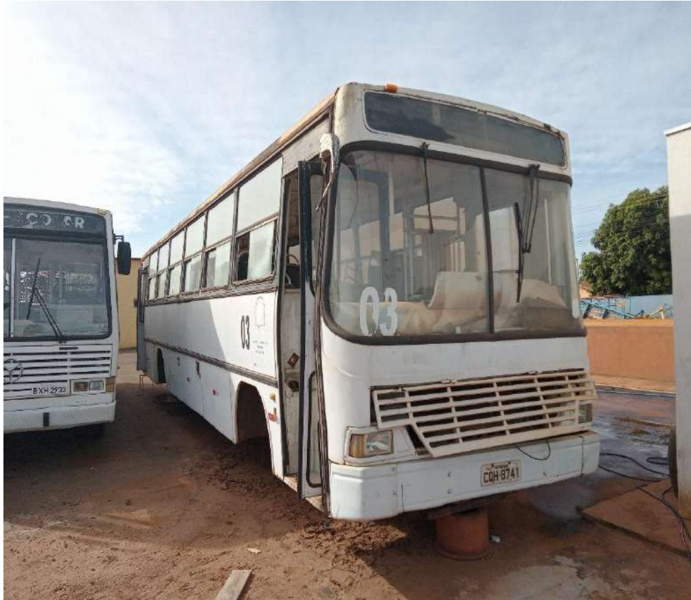
ONIBUS MERCEDES BENZ OF 1318 1990/1990 BRANCO CQH-8741 CHASSI: 9BM384088LB885389 PATRIMONIO: 8878