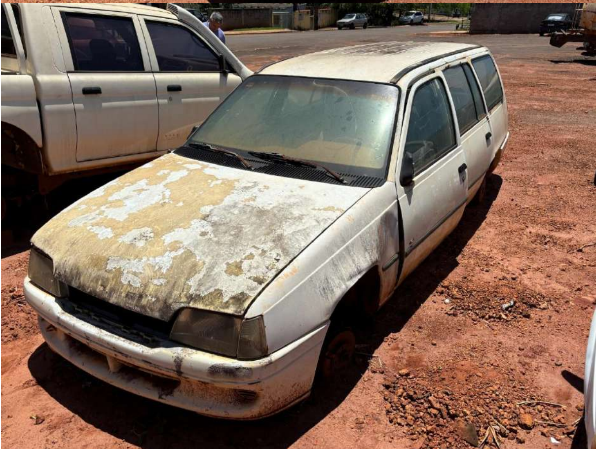
CHEVROLET IPANEMA GL 1.8 EFI 4 PTS 1996/1996 BRANCA