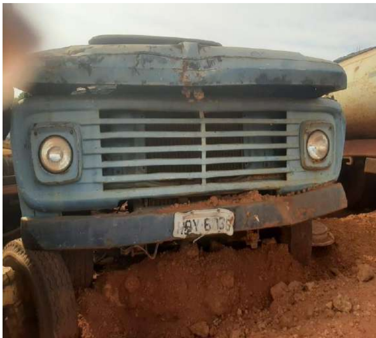
CAMINHÃO FORD F600 ANO 1967 COR AZUL QAY-6036