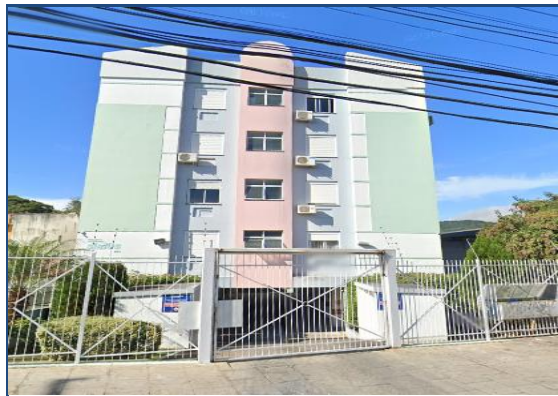
Fachada do condomínio