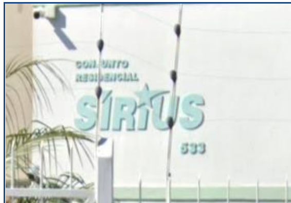
Identificação do condomínio