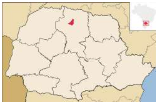
Localização de Astorga no Paraná