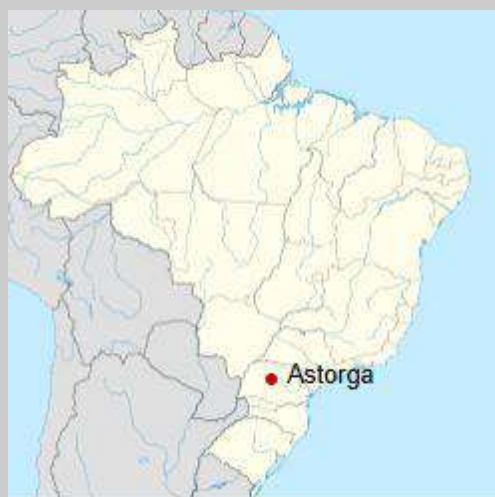
Localização de Astorga no Brasil