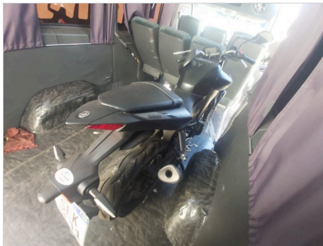
DIANTEIRA DIAGONAL DIREITA