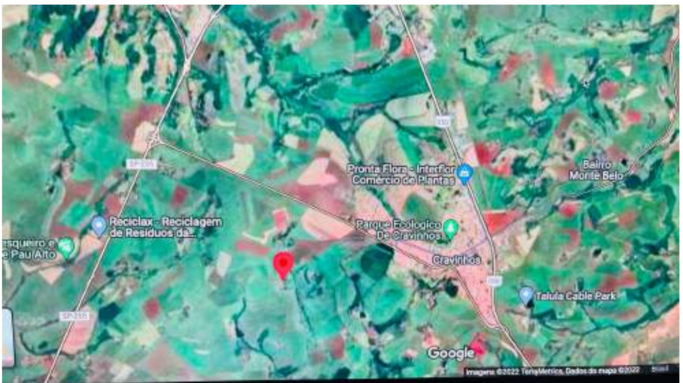
Localização do Sítio

Latitude e Longitude: -21.346805028911426, -47.7859232851149