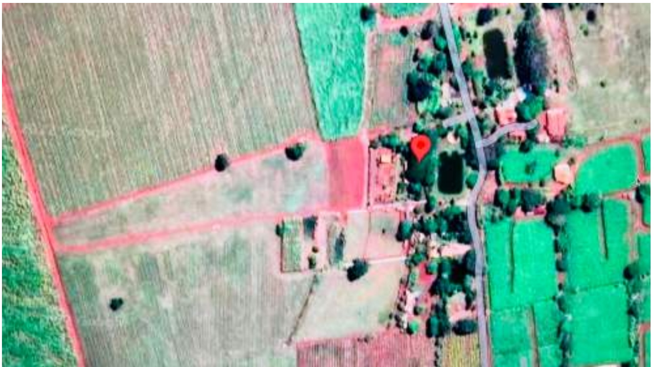
Sítio visto de cima