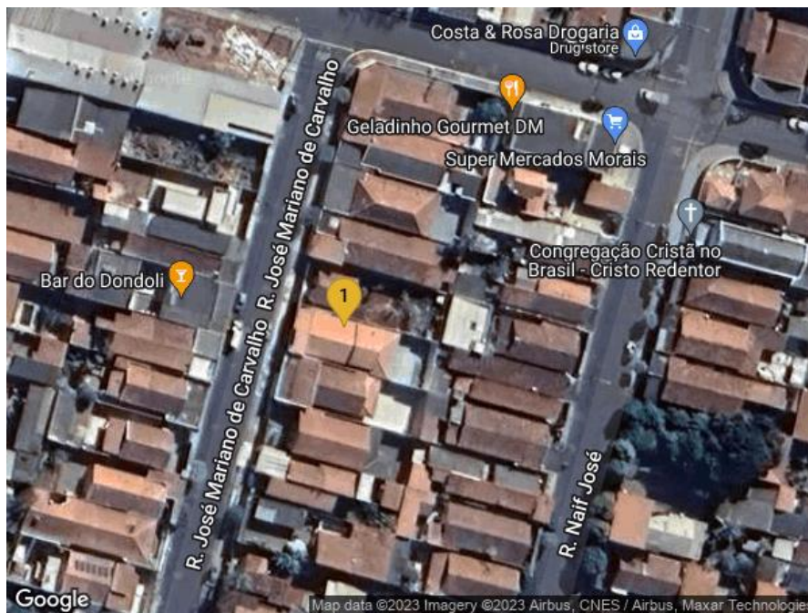
1 - Dionaton Almeida Ramos;