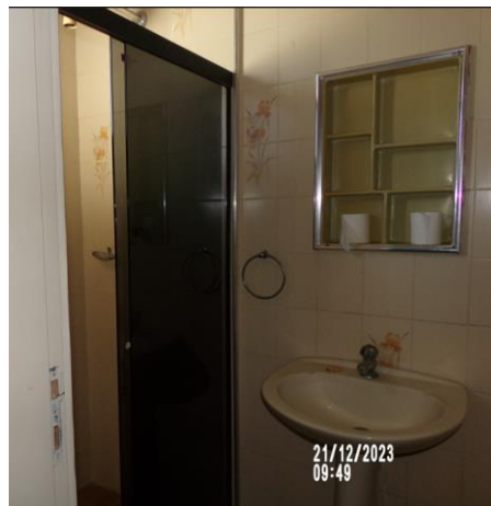
BANHO DA SUITE