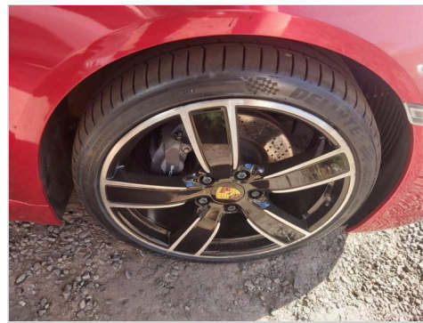
PNEU TRASEIRO DIREITO