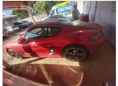
TRASEIRA DIAGONAL ESQUERDA