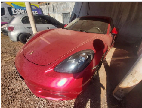
DIANTEIRA DIAGONAL ESQUERDA