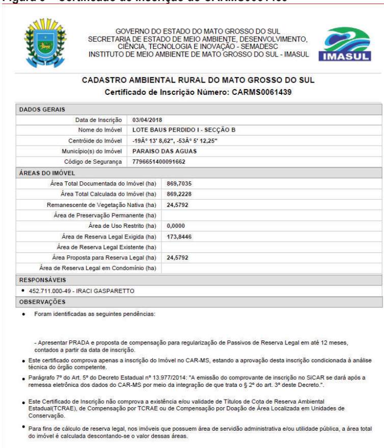
Figura 3 – Certificado de Inscrição do CARMS0061439