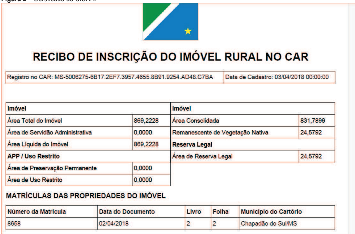
Figura 2 – Certificado do SICAR.