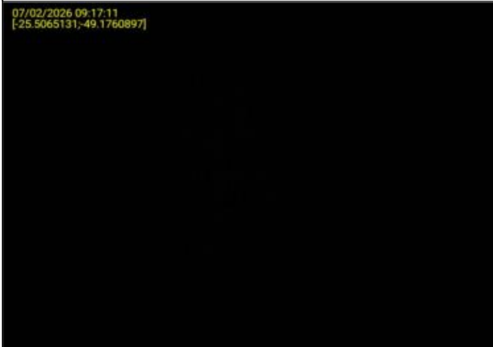
017 - EXTINTOR DE INCÊNDIO - COMPLETO