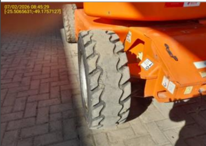
007 - PNEU DIANTEIRO - DIREITO