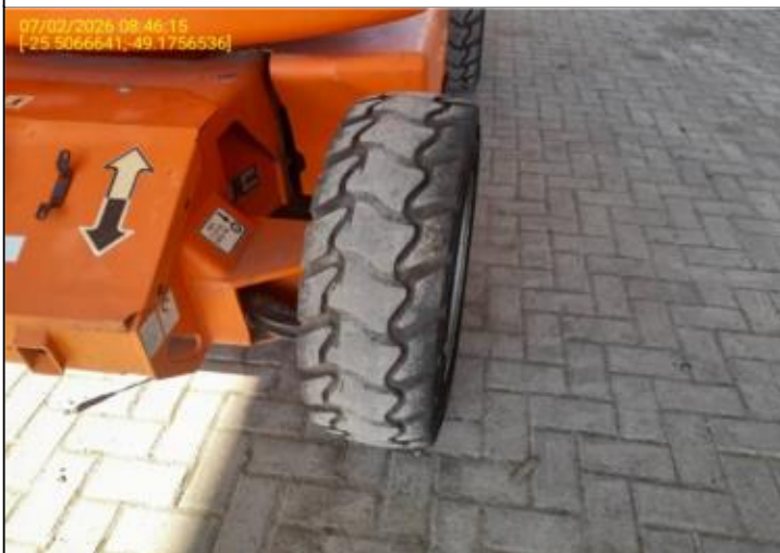
008 - PNEU DIANTEIRO - ESQUERDO