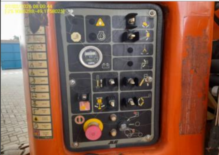
006 - PAINÉIS - CONTROLES - INDICADORES