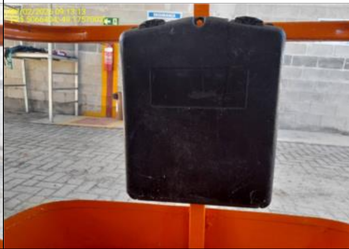
016 - PORTA MANUAL - FECHADO