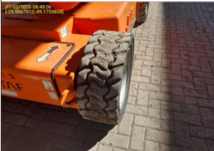
009 - PNEU TRASEIRO - DIREITO