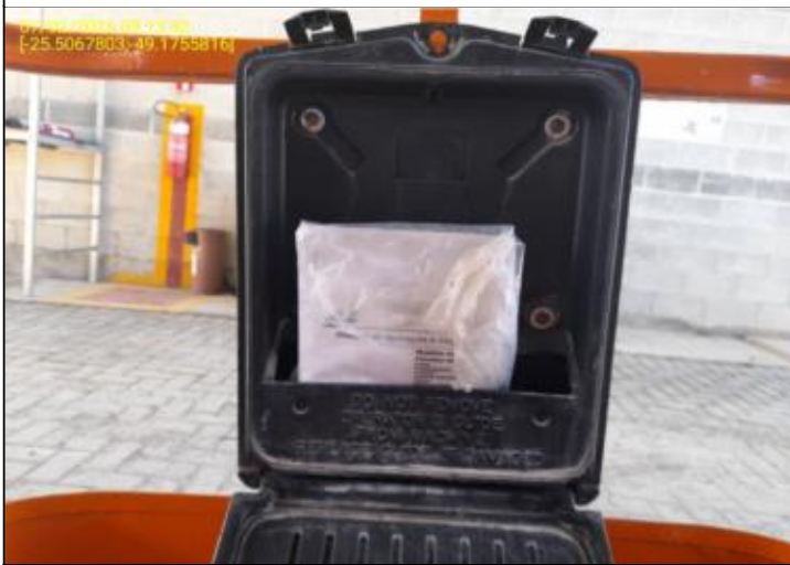
015 - PORTA MANUAL - ABERTO