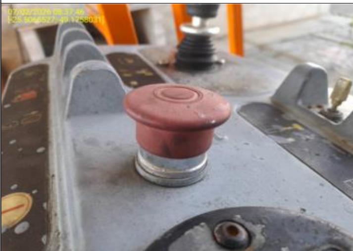
013 - BOTÃO DE EMERGÊNCIA