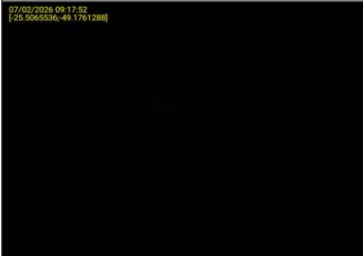
019 - EXTINTOR DE INCÊNDIO - VALIDADE