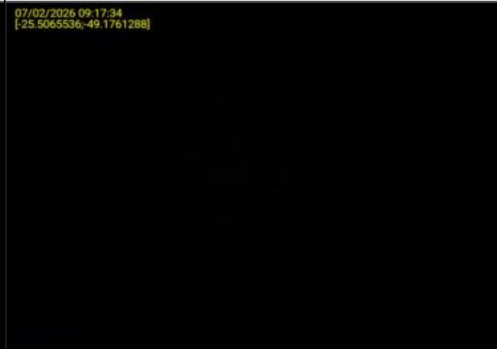
018 - EXTINTOR DE INCÊNDIO - MANÔMETRO