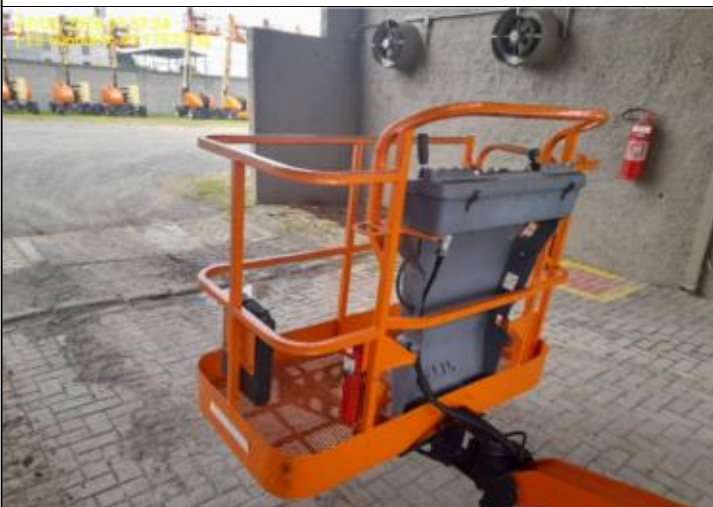
003 - PARTE EXTERNA - CESTO - GUARDA CORPO