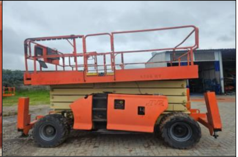
Relatório Fotográfico - Fotos Gerais do Equipamento