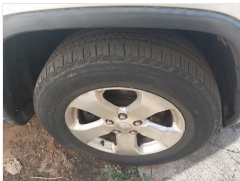
PNEU TRASEIRO DIREITO