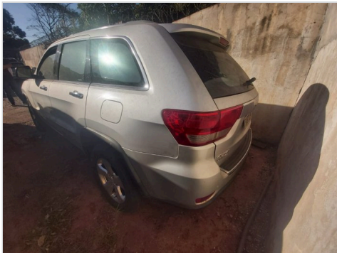
TRASEIRA DIAGONAL ESQUERDA