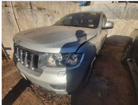
DIANTEIRA DIAGONAL ESQUERDA