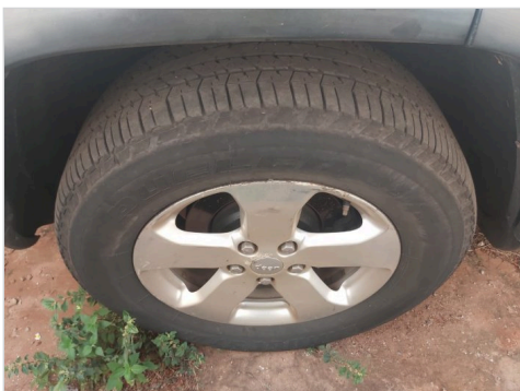
PNEU DIANTEIRO ESQUERDO