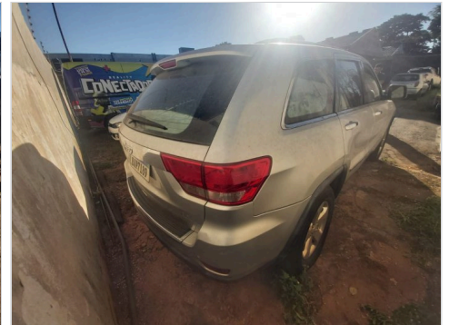
TRASEIRA DIAGONAL DIREITA