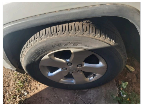
PNEU TRASEIRO ESQUERDO