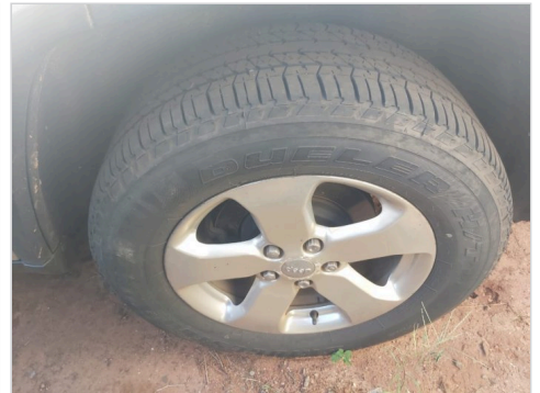
PNEU DIANTEIRO DIREITO