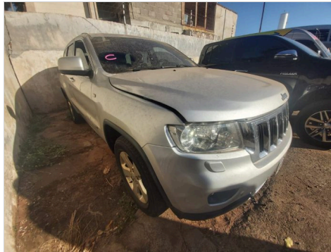
DIANTEIRA DIAGONAL DIREITA