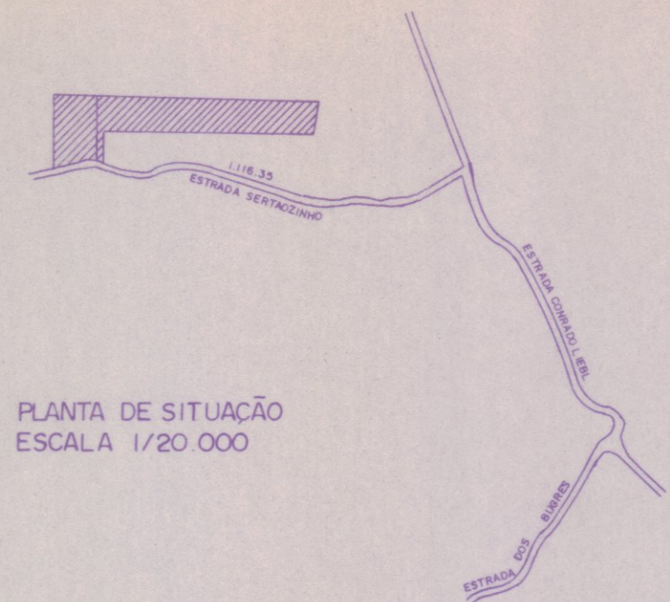
PLANTA DE SITUAÇÃO ESCALA 1/20.000