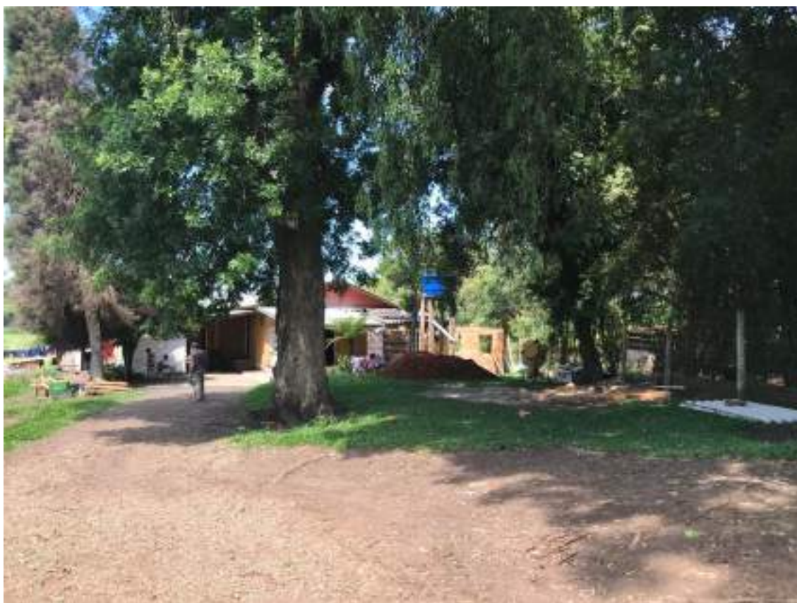
VISTA INTERNA DO IMÓVEL