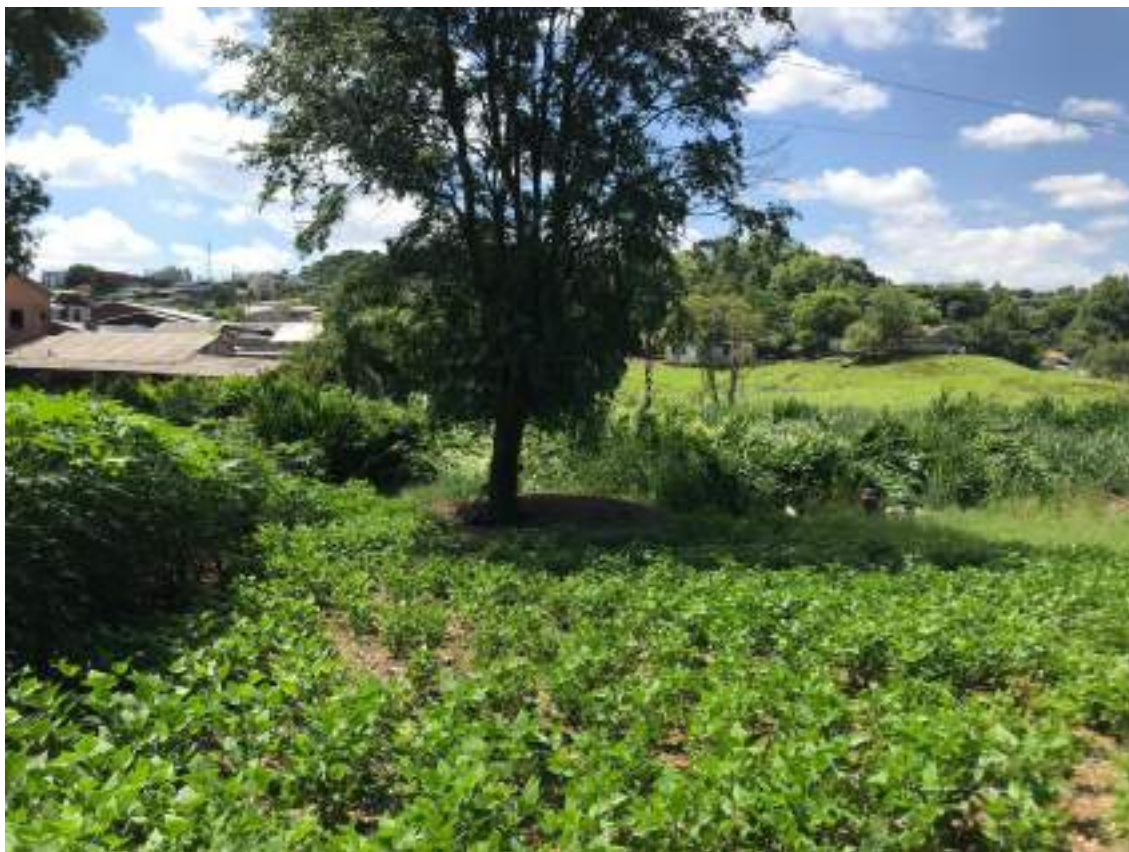
VISTA INTERNA DO IMÓVEL