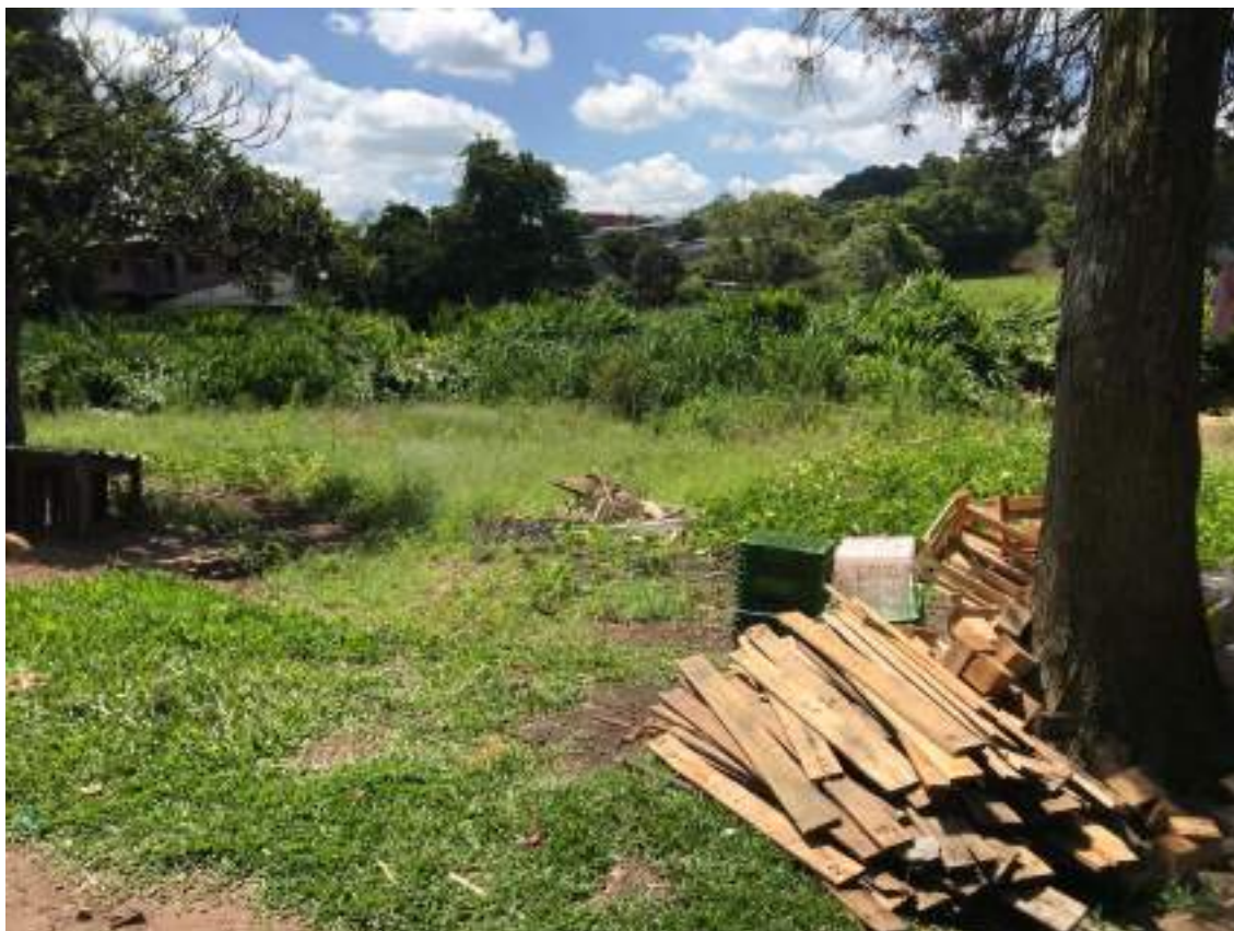
VISTA INTERNA DO IMÓVEL