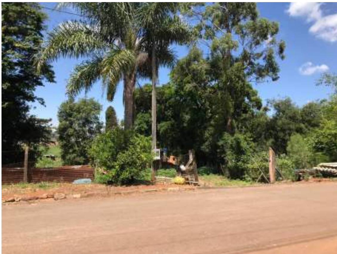
FACHADA DO IMÓVEL