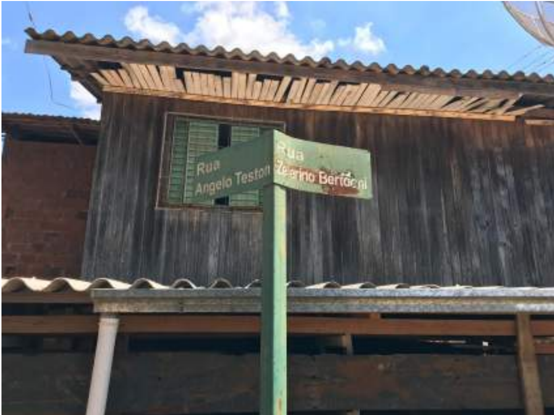
PLACA DA RUA