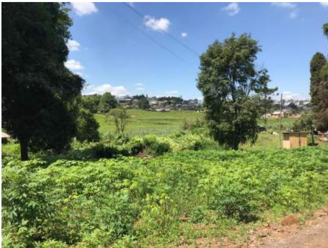
VISTA INTERNA DO IMÓVEL