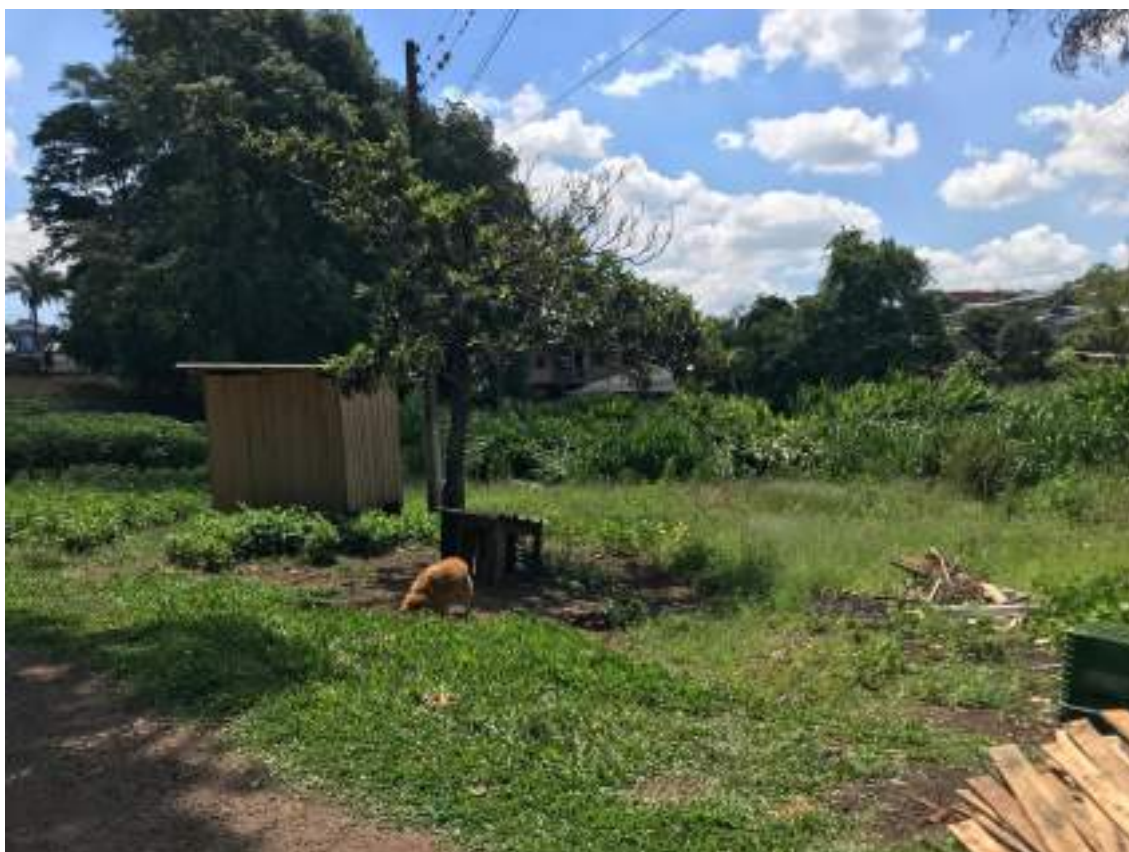
VISTA INTERNA DO IMÓVEL