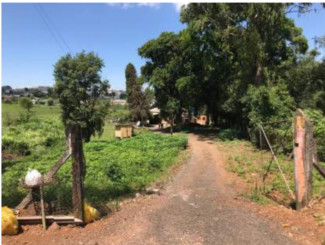
ACESSO AO IMÓVEL