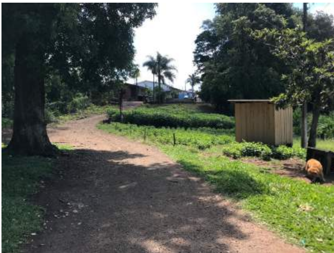
VISTA INTERNA DO IMÓVEL