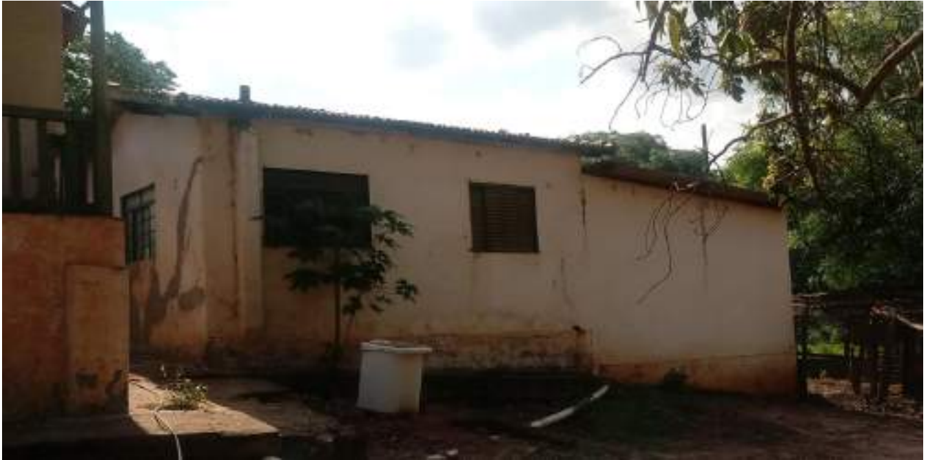
Anexo à Casa de Sede 2