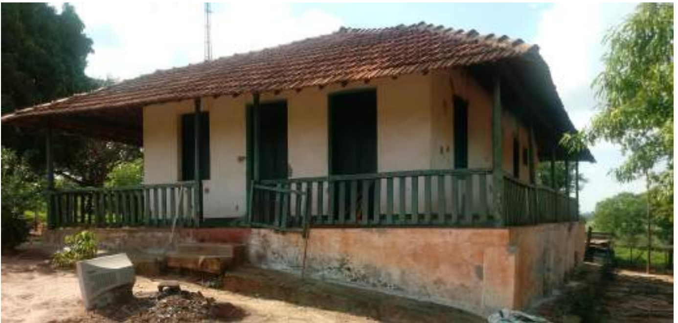
Casa de Sede 2