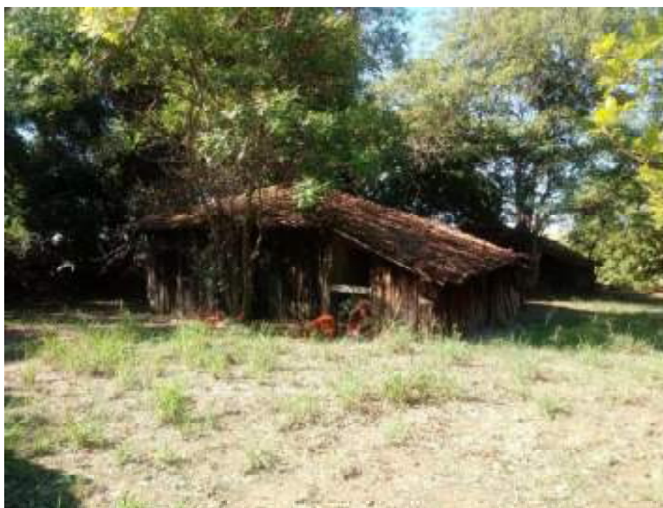
Casa de Colono 15

Rua São Pedro, 451 – Centro – Monte Azul Paulista, SP – CEP 14730-000 Email: engpalim@uol.com.br / Fone: (17) 3361-5130 / Cel: (17) 99179-1409 CRECI SP 184.056 – F 2ª Região SITE: www.palimcorretor.com