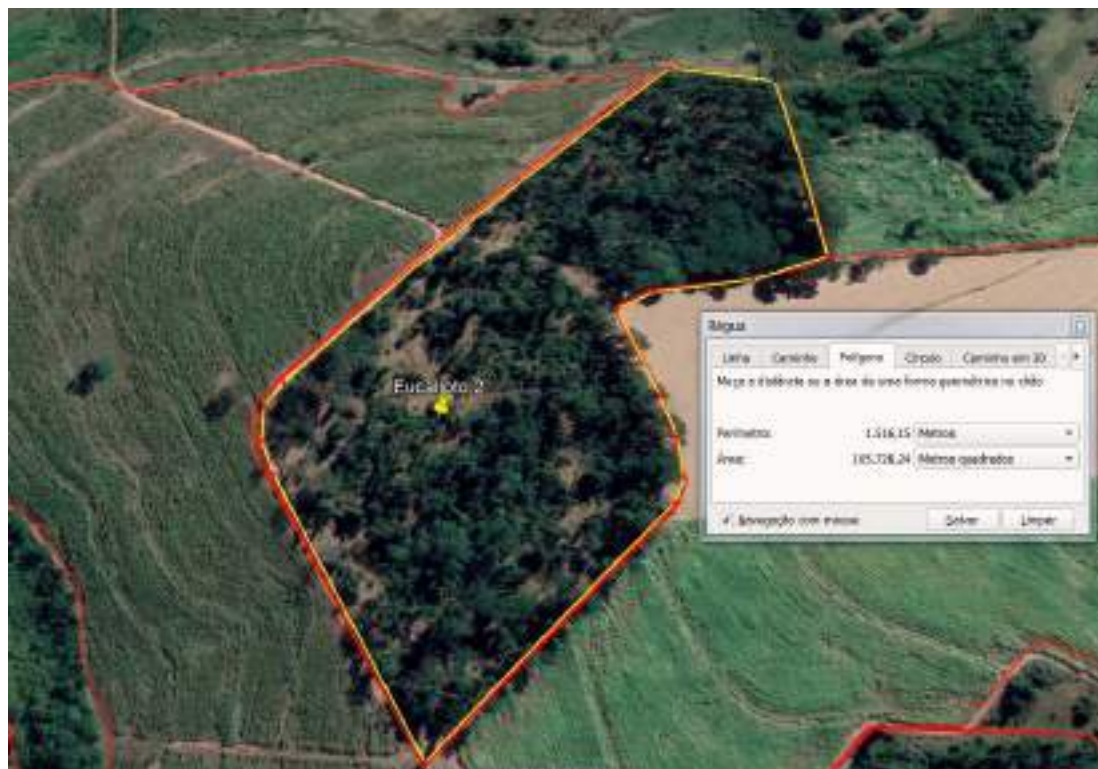
Eucalipto 2 com área superficial de 105.728,24 metros quadrados aproximadamente, ou ainda 10,5728 hectares