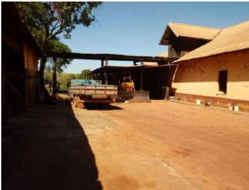
Barracão da Máquina