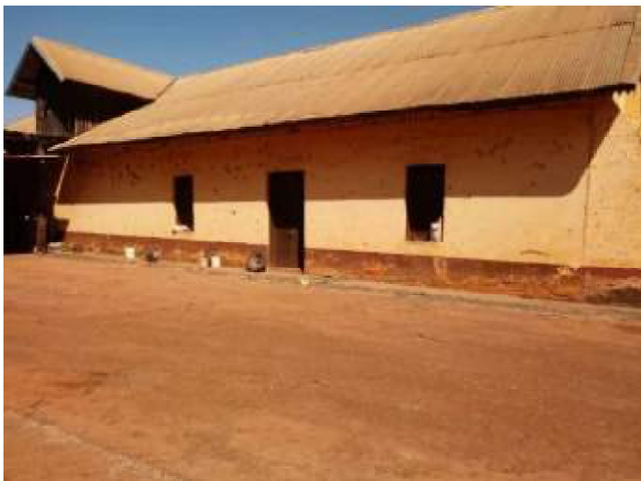
Barracão da Máquina Beneficiadora