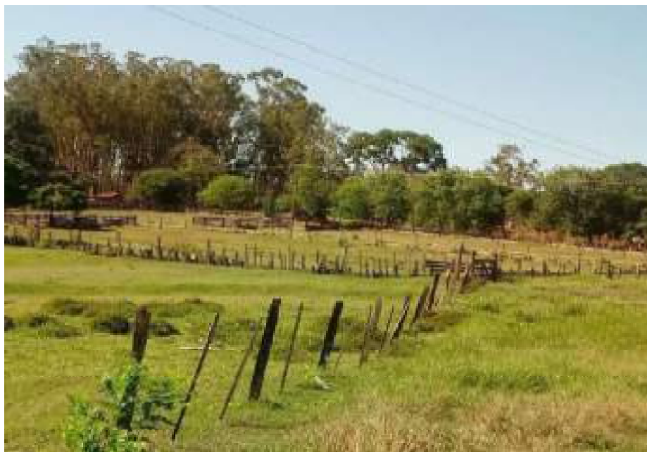
Vista da área com pastagens.

Rua São Pedro, 451 – Centro – Monte Azul Paulista, SP – CEP 14730-000 Email: engpalim@uol.com.br / Fone: (17) 3361-5130 / Cel: (17) 99179-1409 CRECI SP 184.056 – F 2ª Região SITE: www.palimcorretor.com