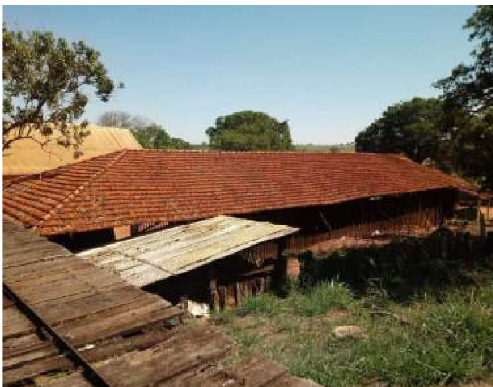
Barracão do Trator

Rua São Pedro, 451 – Centro – Monte Azul Paulista, SP – CEP 14730-000 Email: engpalim@uol.com.br / Fone: (17) 3361-5130 / Cel: (17) 99179-1409 CRECI SP 184.056 – F 2ª Região SITE: www.palimcorretor.com