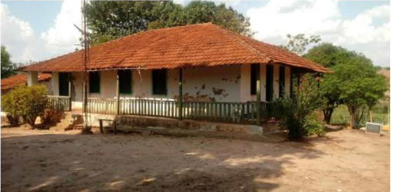
Casa de Sede 2