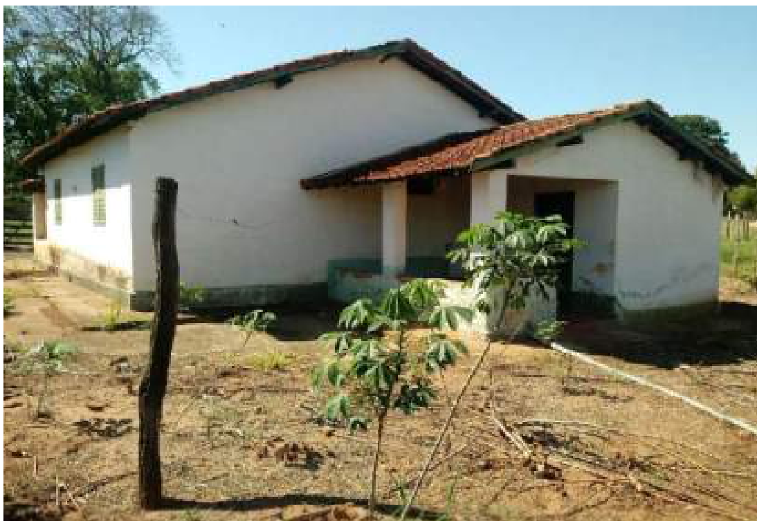
Casa do Gerente

Rua São Pedro, 451 – Centro – Monte Azul Paulista, SP – CEP 14730-000 Email: engpalim@uol.com.br / Fone: (17) 3361-5130 / Cel: (17) 99179-1409 CRECI SP 184.056 – F 2ª Região SITE: www.palimcorretor.com