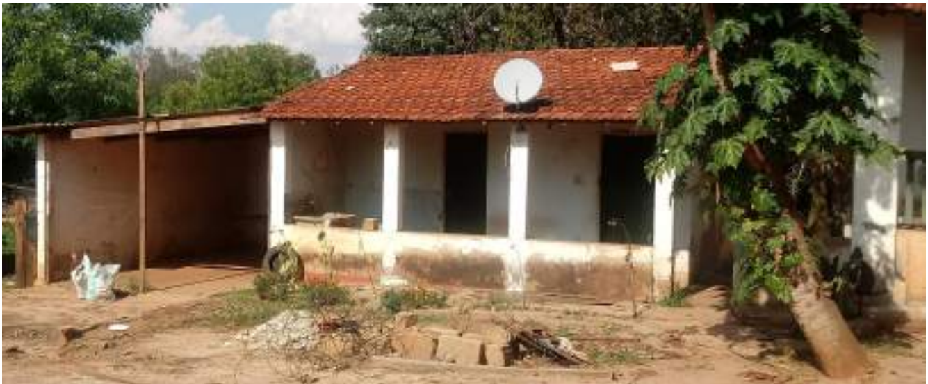
Anexo à Casa de Sede 2