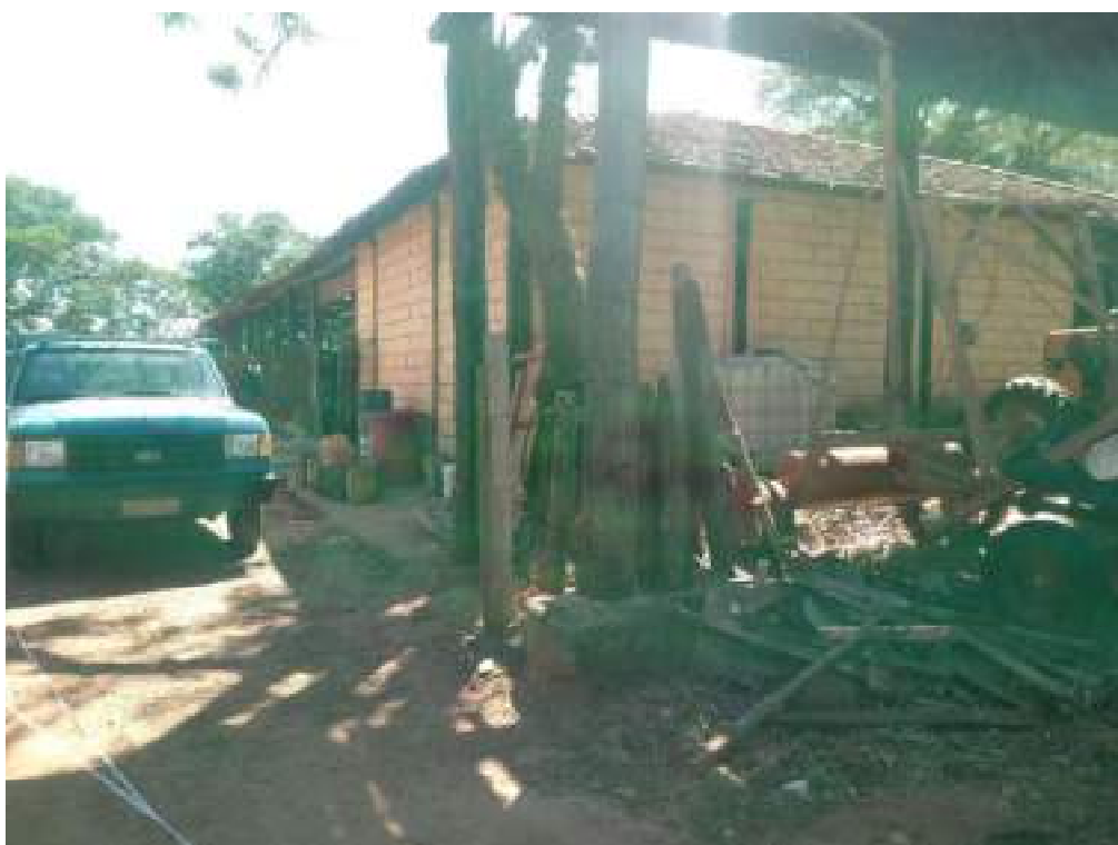
Barracão do Trator