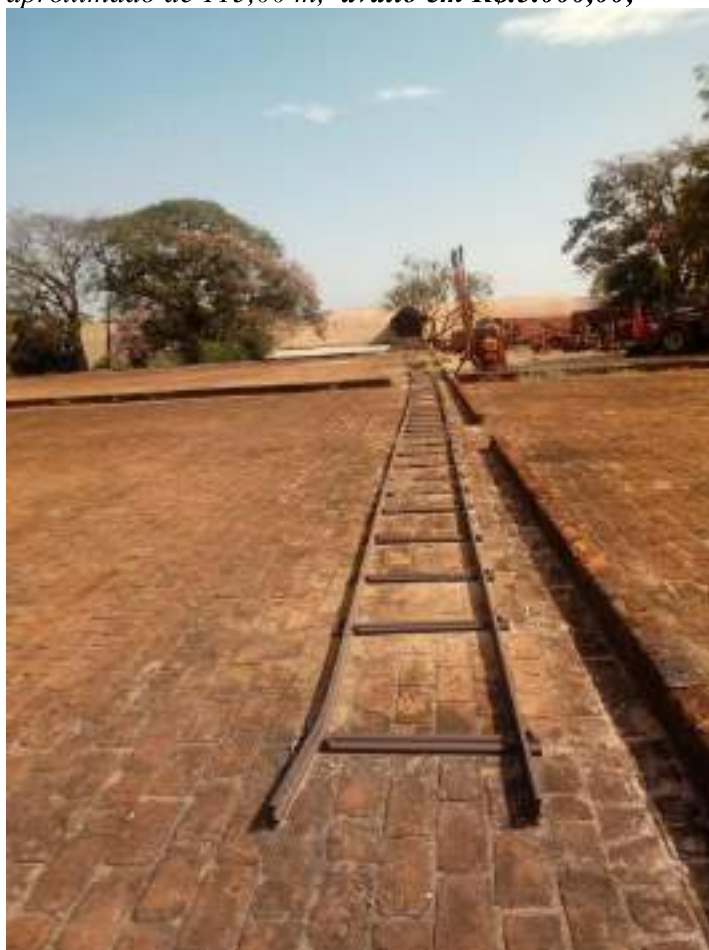
trilhos de aço

BNR = benfeitorias não reprodutivas: Trilhos de Aço sobre Dormentes também em Aço, com comprimento aproximado de 115,00 m, avalio em R$.5.000,00;