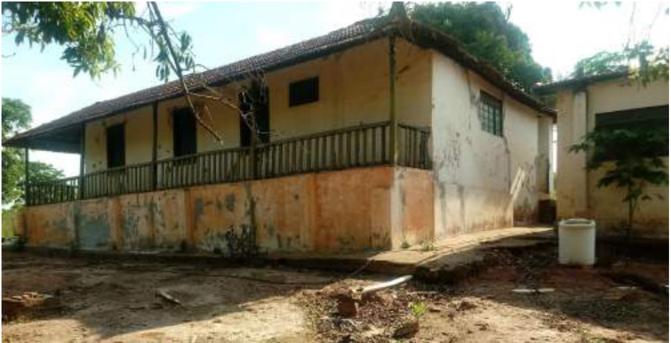
Casa de Sede 2