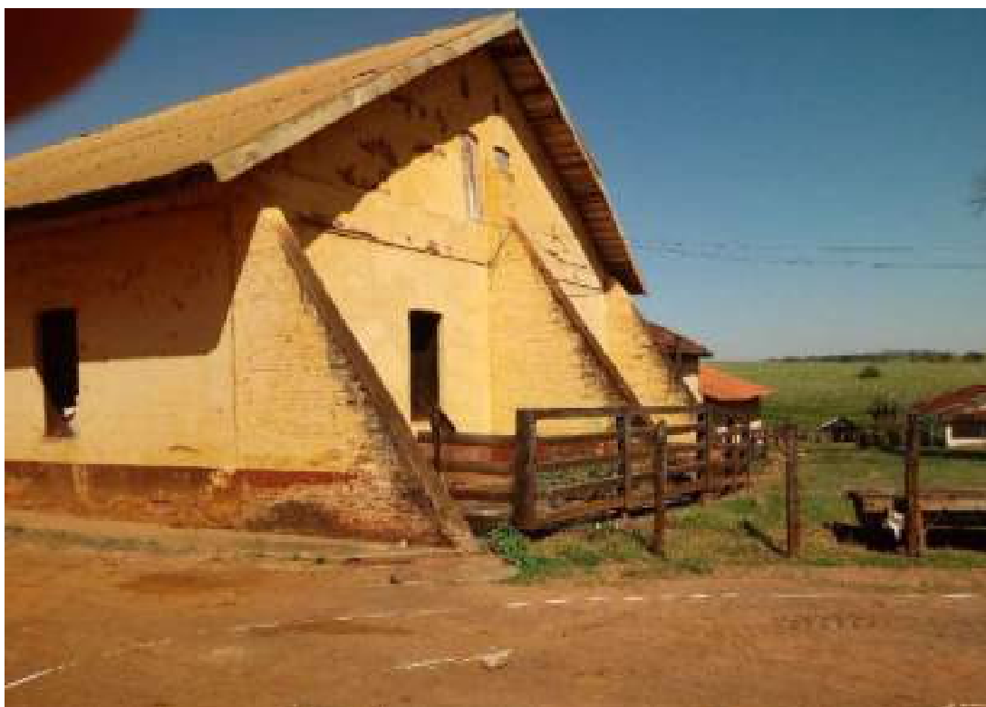
Barracão da Máquina

Beneficiadora de Café, e, aos fundos da foto, Remanescente do Prédio da Máquina e Garagem da Máquina.