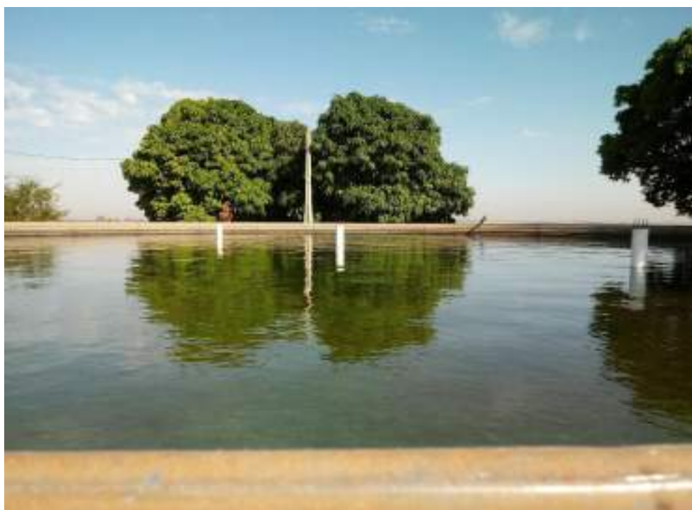
Vista superior da Caixa Australiana

BNR = benfeitorias não reprodutivas: Poço semi artesiano avalio em R$.20.000,00;