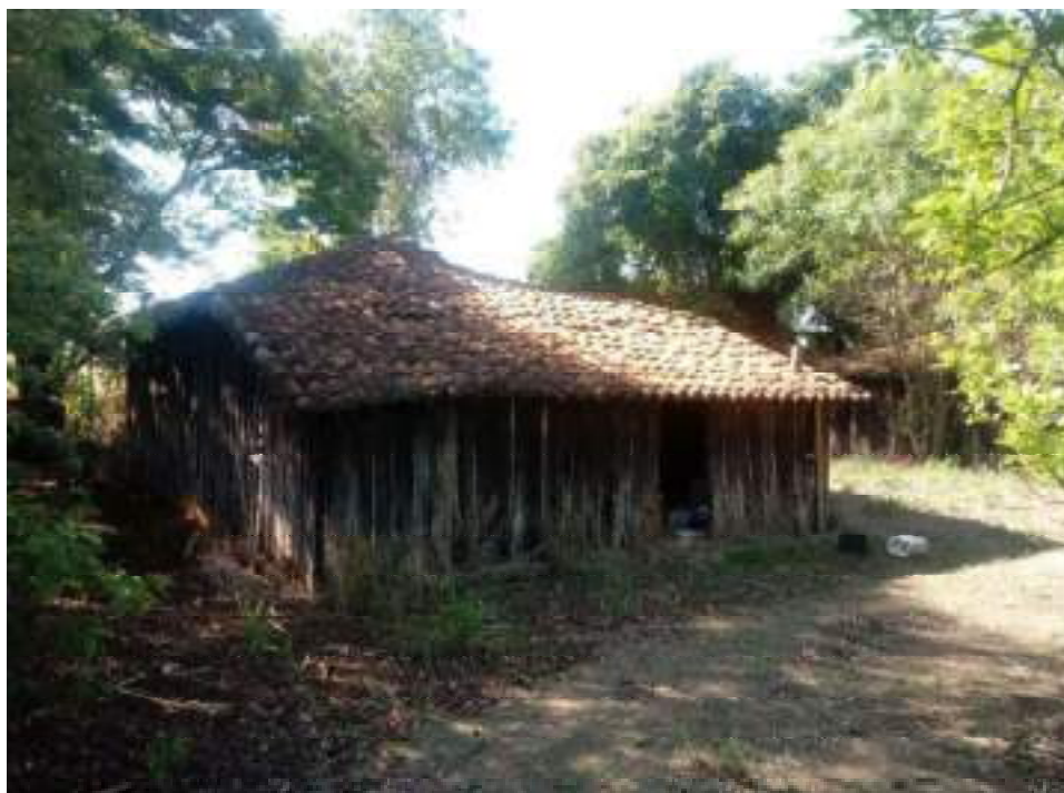
Casa de Colono 14

Conforme fotos abaixo, casas de colono de 14 a 16: