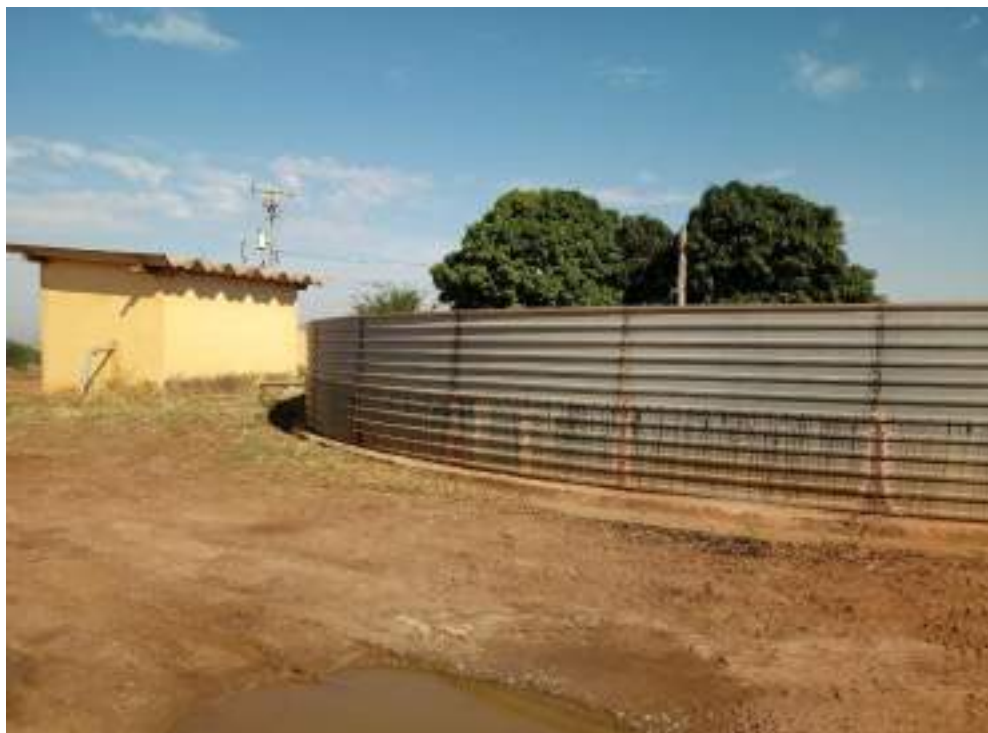
Abrigo e Caixa Australiana