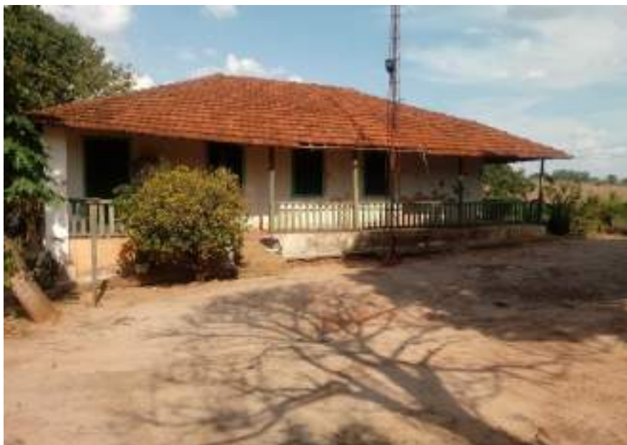
Casa de Sede 2

Meritíssimo, conforme foi solicitado passo a esclarecer o seguinte, COM ACOMPANHAMENTO DO PROPRIETÁRIO, O QUAL MOSTROU-ME A SEGUNDA SEDE, E O RODOLÚVEL destivado, o QUAL PASSO A AVALIÁ-LOS: