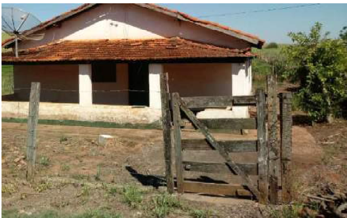
Casa do Gerente