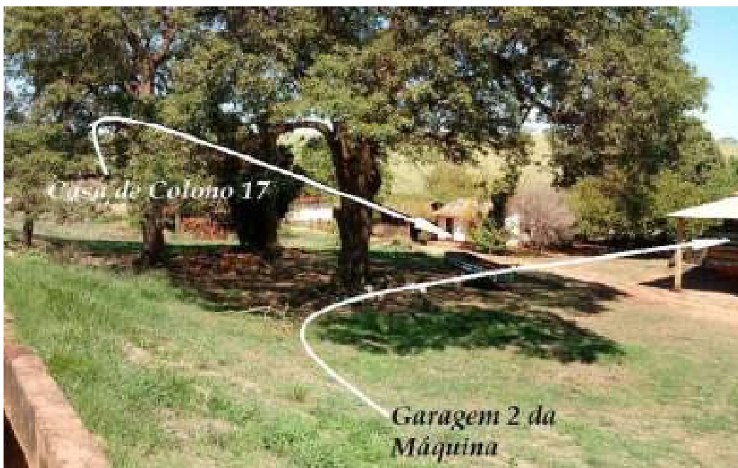
Casa de Colono 17