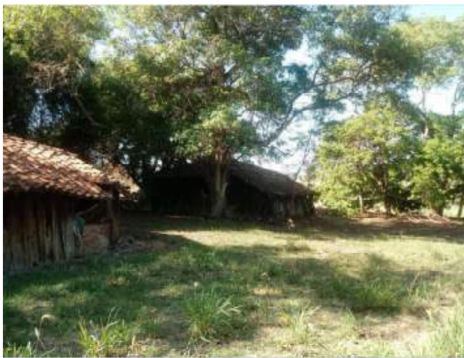
Casa de Colono 16