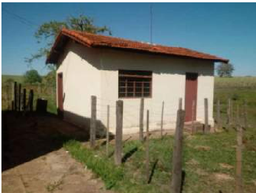
Cozinha do Escritório