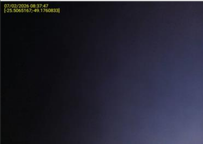
019 - EXTINTOR DE INCÊNDIO - VALIDADE