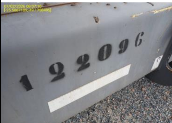
001 - PLACA DE IDENTIFICAÇÃO (NÚMERO DE PATRIMÔNIO)