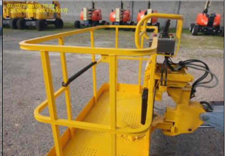
003 - PARTE EXTERNA - CESTO - GUARDA CORPO