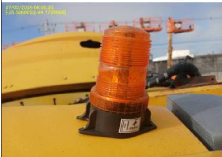
014 - GIROFLEX