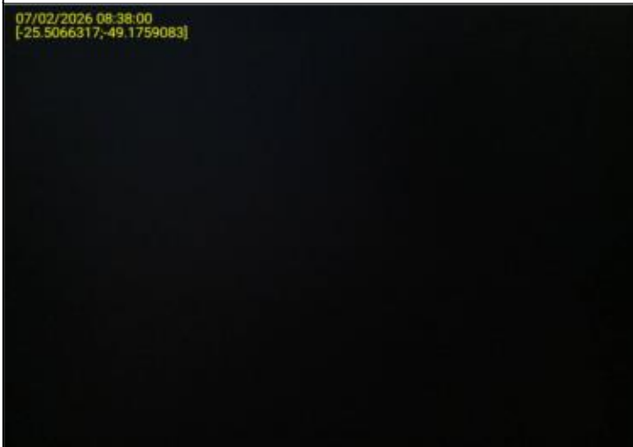
018 - EXTINTOR DE INCÊNDIO - MANÔMETRO