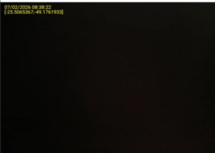
017 - EXTINTOR DE INCÊNDIO - COMPLETO