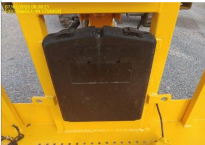
016 - PORTA MANUAL - FECHADO