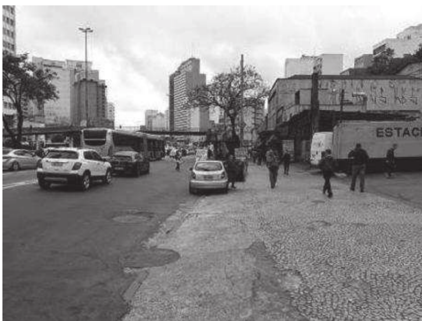
Vista parcial da Av. Prestes Maia, no trecho fronteiro ao edifício Garagem Automática Luz.