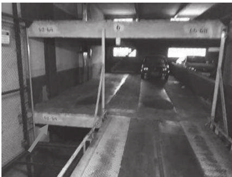
Vista da vaga nº. 52 em direção aos fundos.

A unidade em questão apresenta, basicamente, as seguintes características: