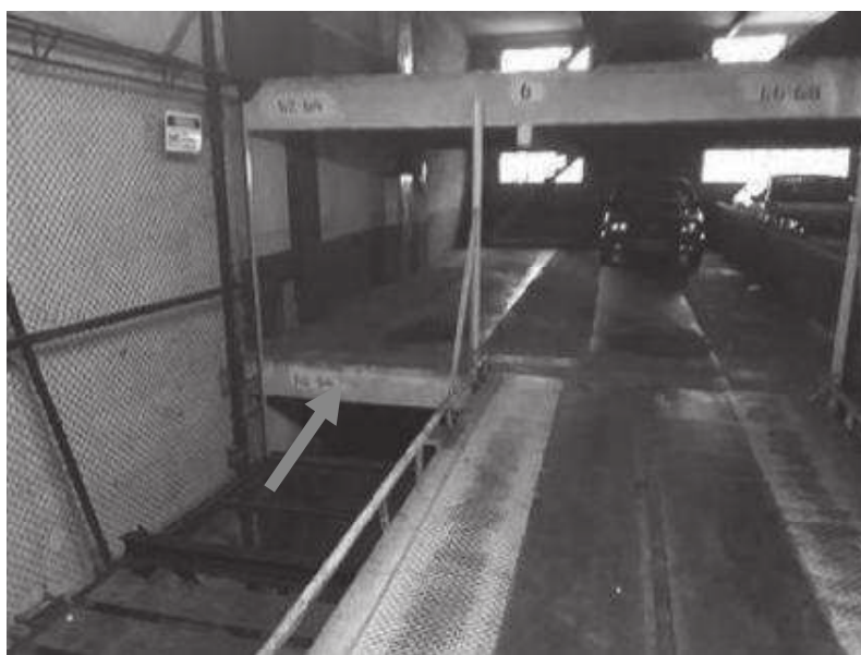
Idem a foto anterior vista de outro ângulo.