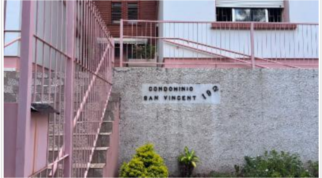
ID do condomínio