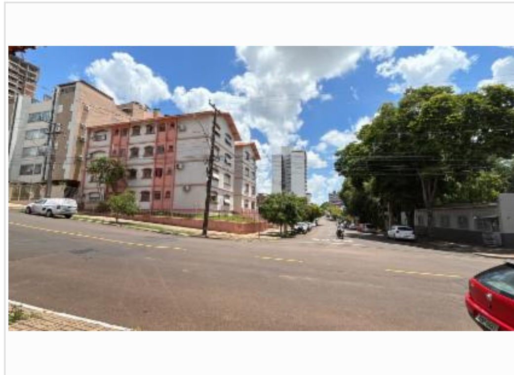
vista da lateral