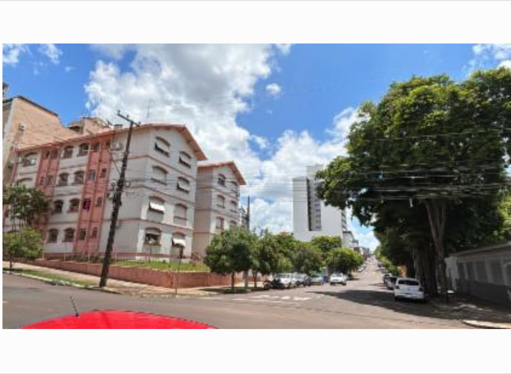
vista da rua