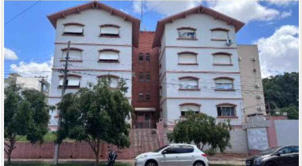
vista da fachada