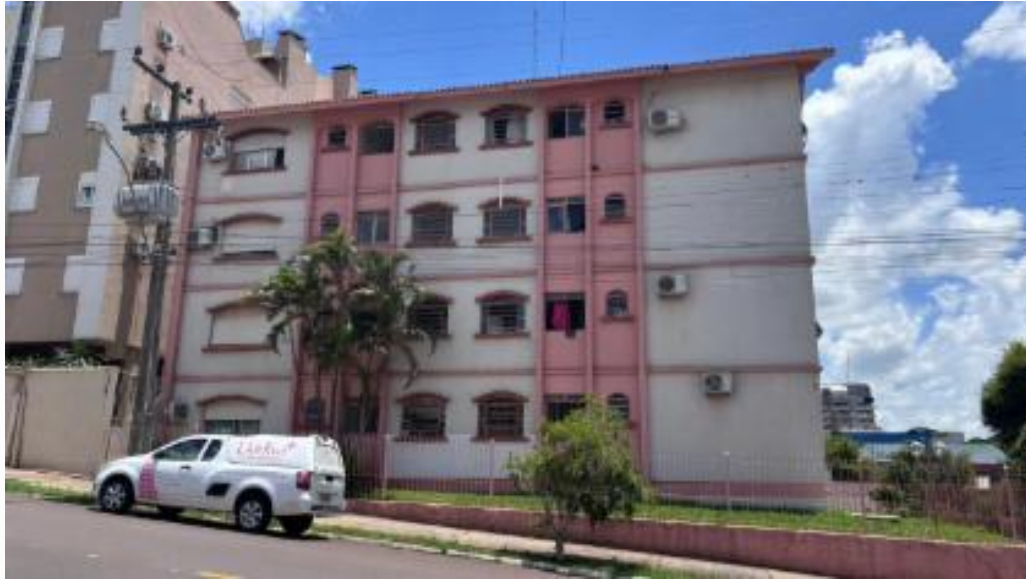
vista da fachada