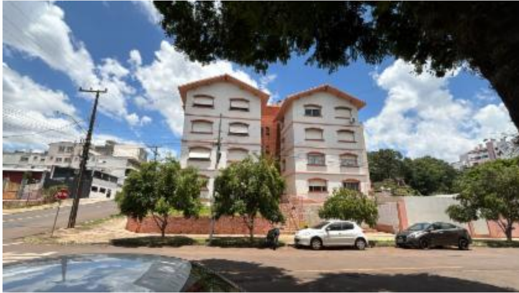
vista da fachada