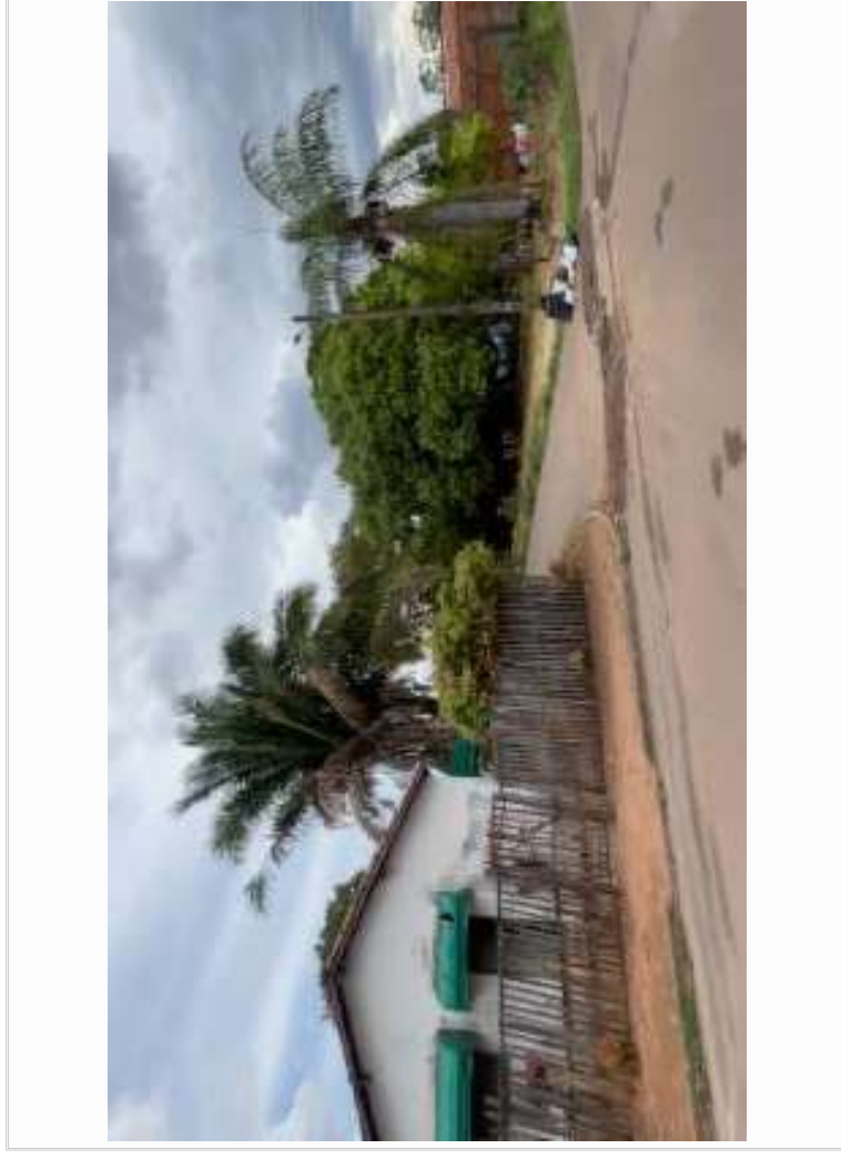
VIZINHOS DE FRENTE