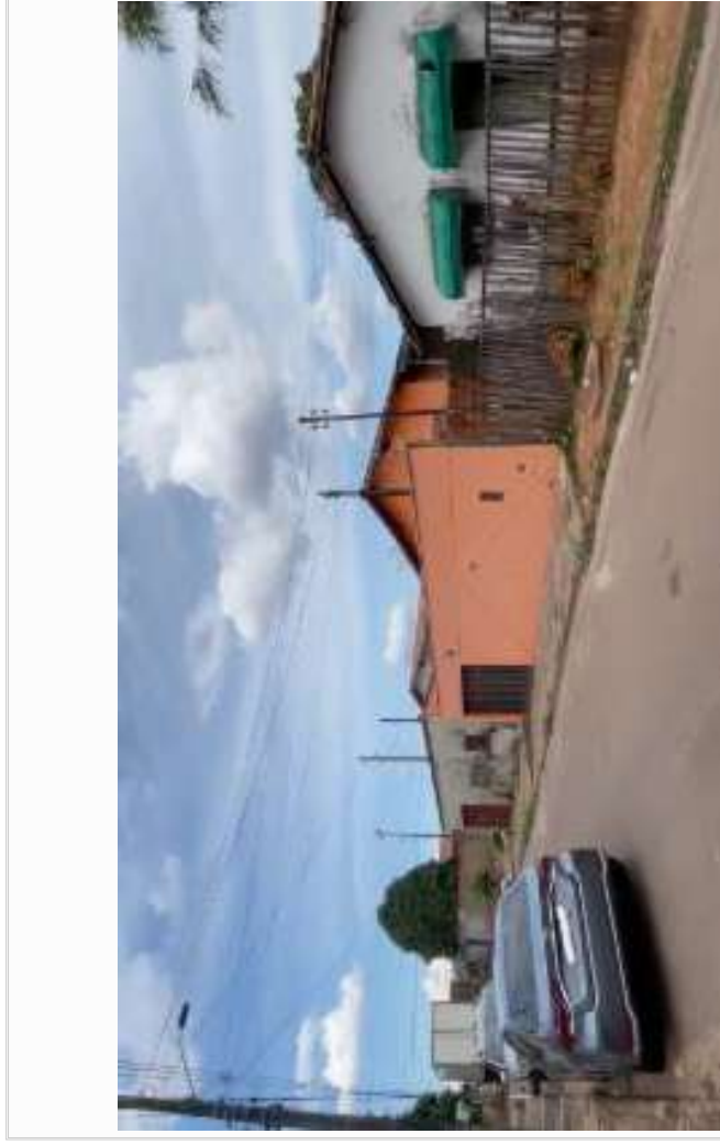
RUA LADO ESQUERDO