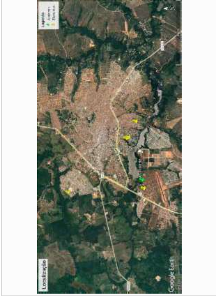
MAPA DE ELEMENTOS