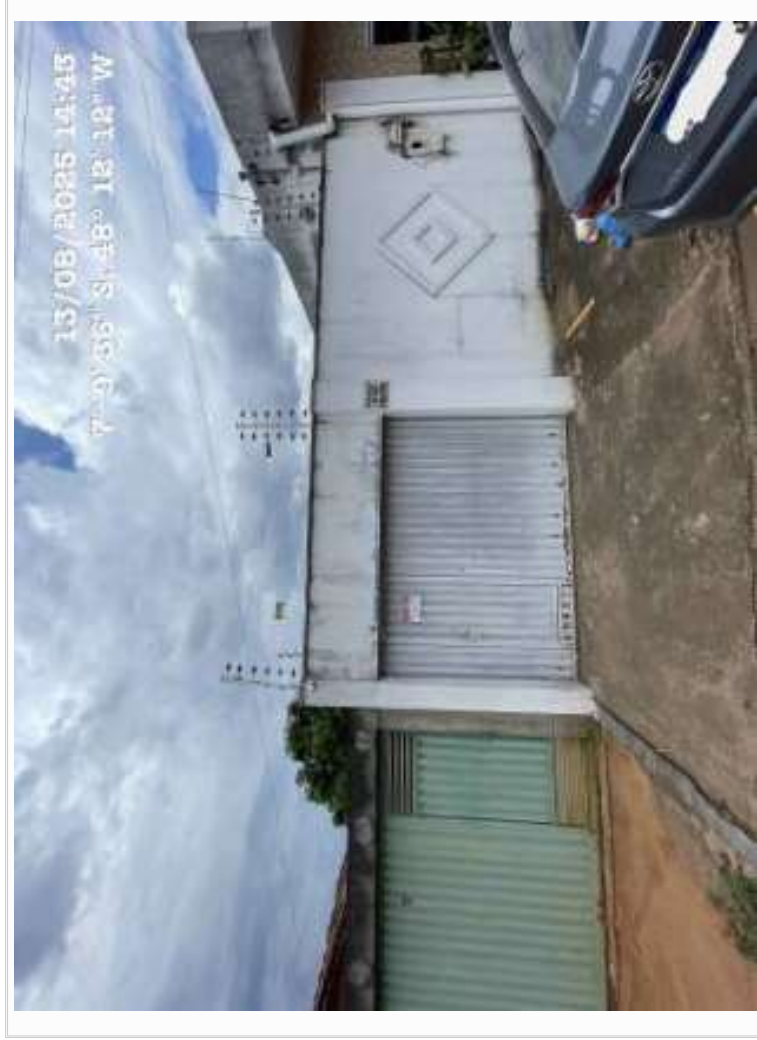
FACHADA / DATA E HORA