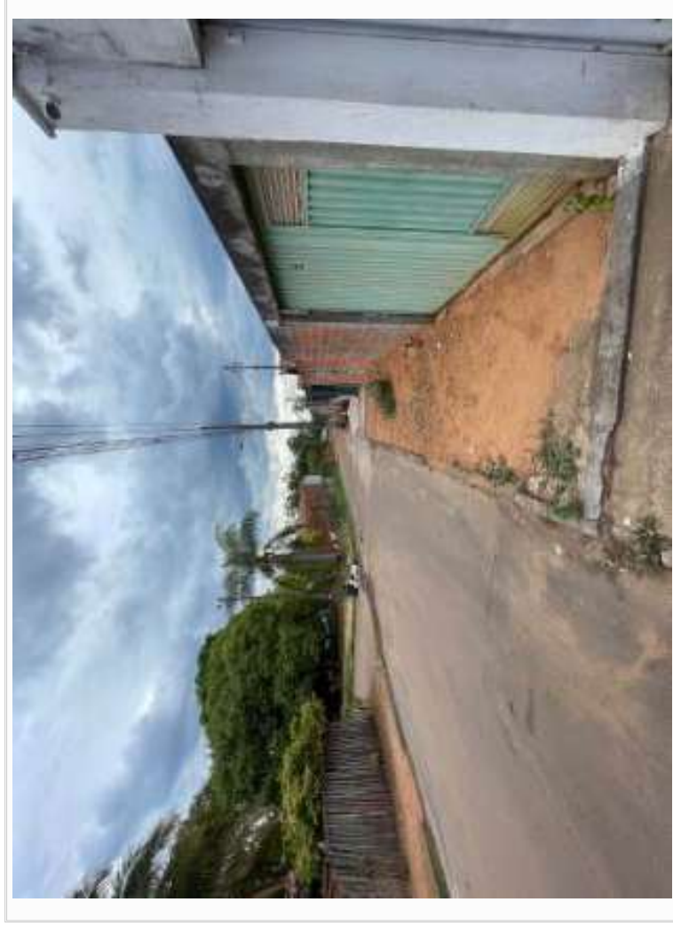
RUA LADO DIREITO