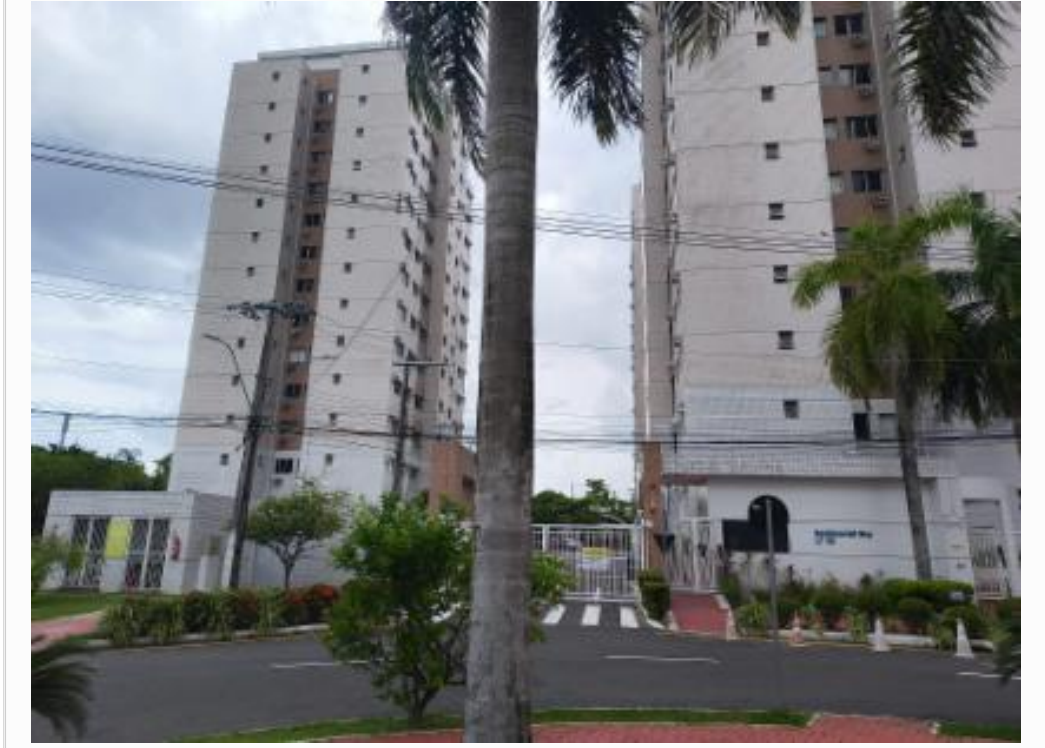
Fachada do Condomínio