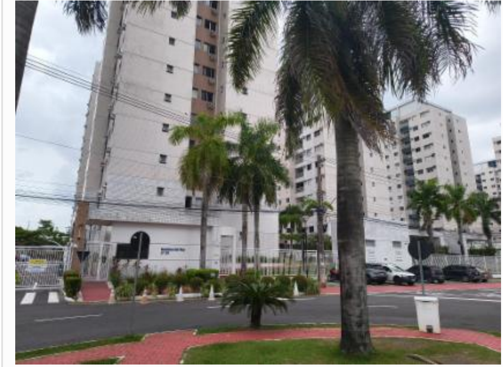
Fachada do Condomínio