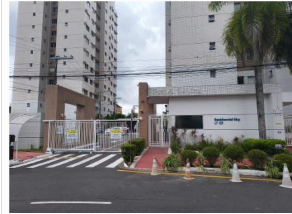
Guarita de acesso ao condomínio