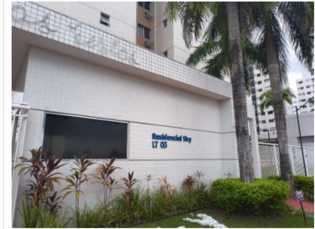
Identidade visual e numérica do condomínio