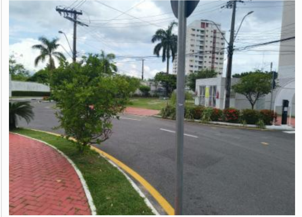
Vista do logradouro de situação