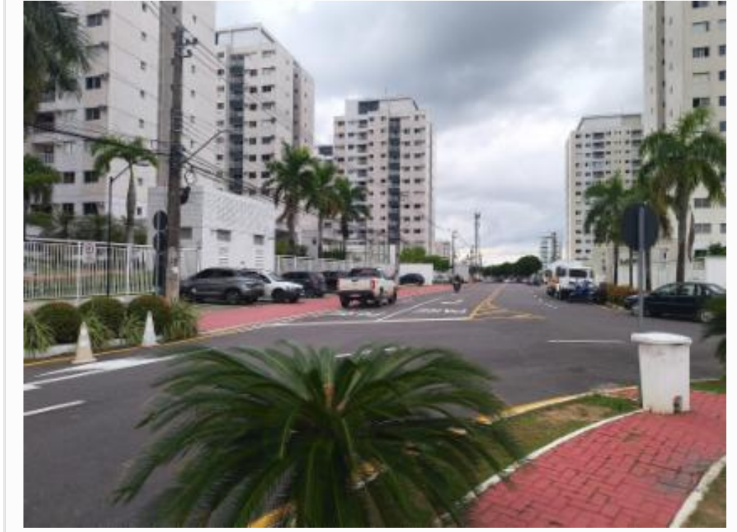
Vista do logradouro de situação