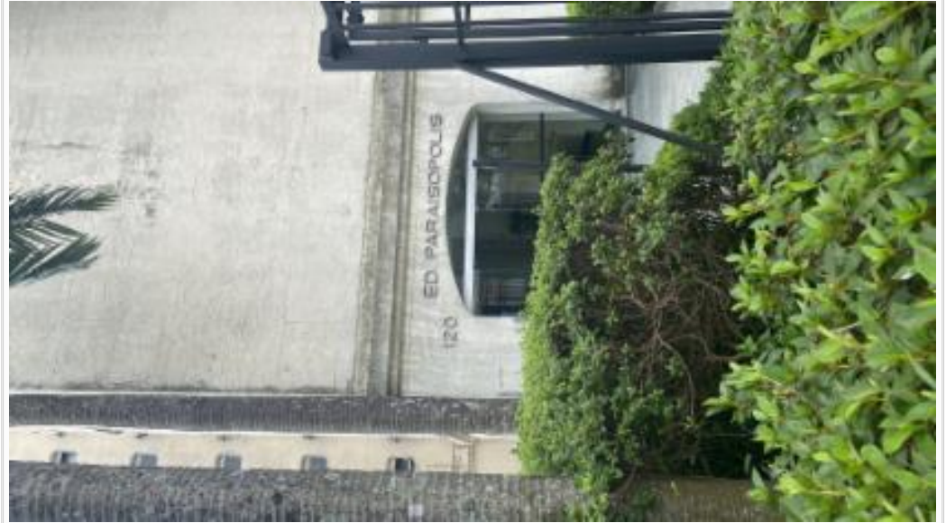
Numeração é expressão numérica