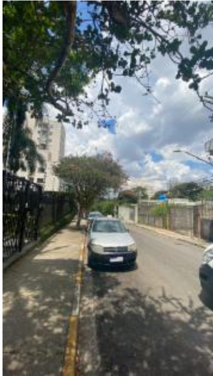
Rua lado esquerdo