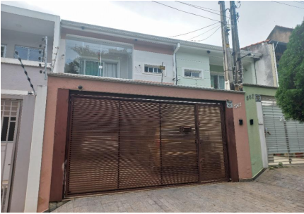
Representação Vista da Rua Descrição Data Foto 22/02/2023