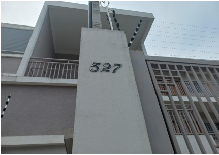
Representação Identificação Numérica Descrição Data Foto 22/02/2023