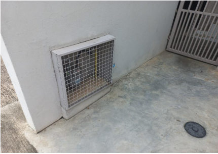
Representação Vista da Rua Descrição Data Foto 22/02/2023