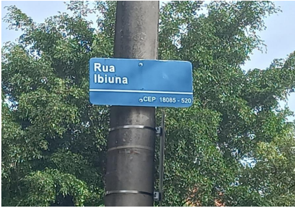
Representação Vista da Rua Descrição Data Foto 22/02/2023