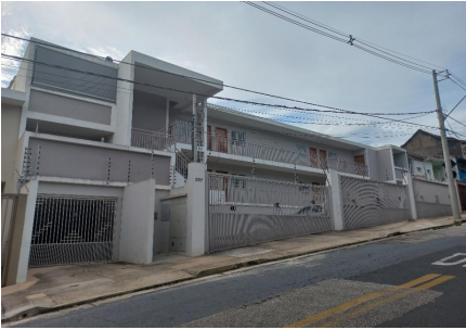
Representação Fachada Principal Descrição Data Foto 22/02/2023