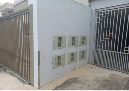
Representação Vista da Rua Descrição Data Foto 22/02/2023