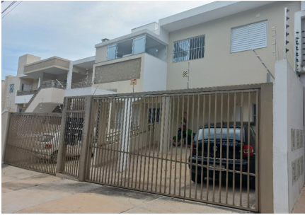
Representação Vista da Rua Descrição Data Foto 22/02/2023