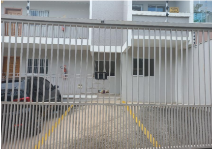
Representação Garagem Descrição Data Foto 22/02/2023