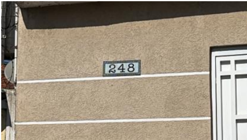
Número imóvel avaliando