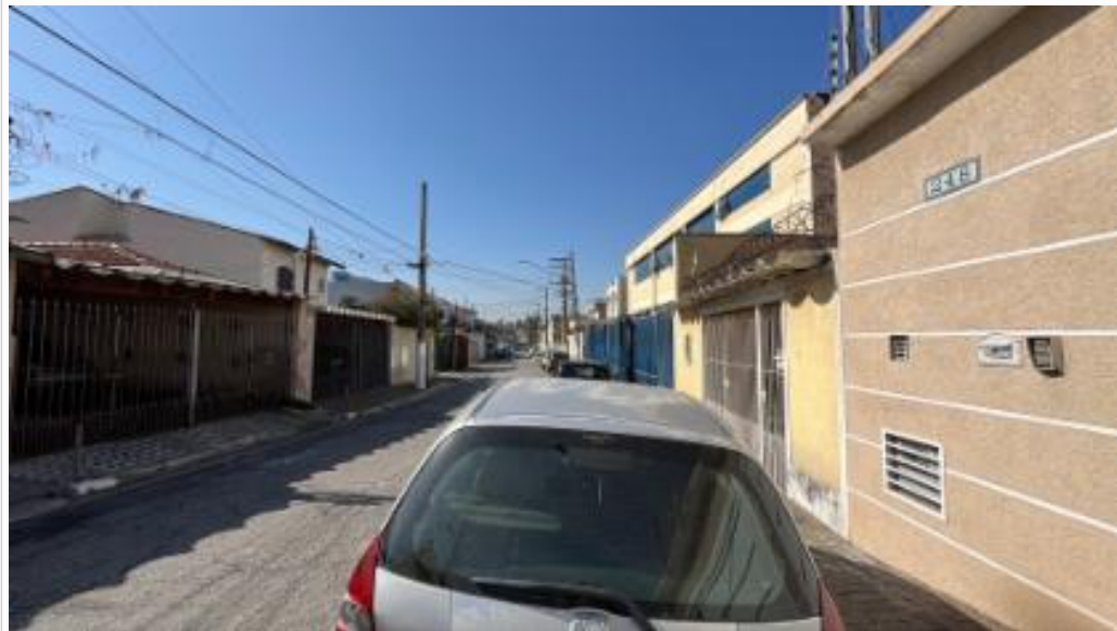
Rua à direita