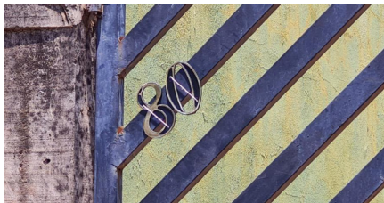
Representação Identificação Numérica Descrição Data Foto 14/10/2022