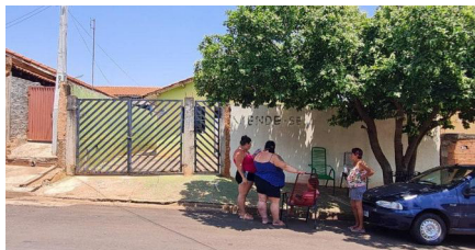
Representação Fachada Principal Descrição Data Foto 14/10/2022