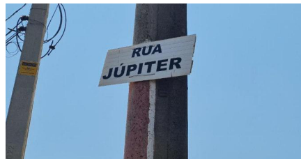
Representação Vista da Rua Descrição Data Foto 14/10/2022