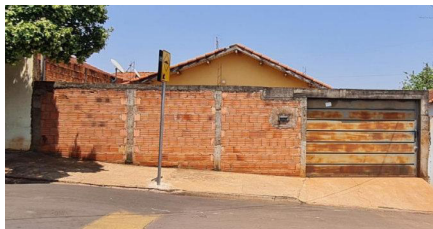
Representação Vista da Rua Descrição VIZINHO Data Foto 14/10/2022