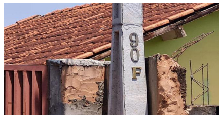
Representação Vista da Rua Descrição VIZINHO Data Foto 14/10/2022