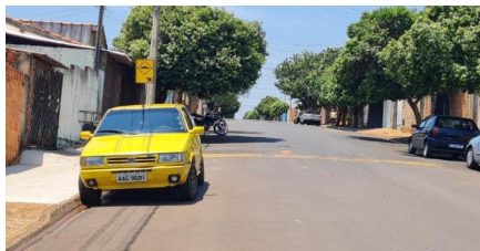
Representação Vista da Rua Descrição Data Foto 14/10/2022