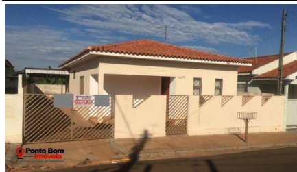
Representação Descrição Data Foto