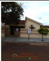
Representação Descrição Data Foto