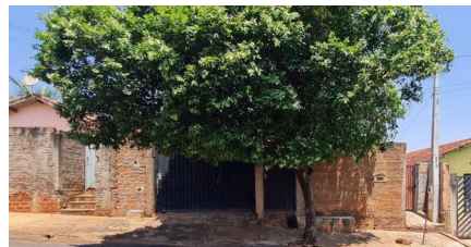
Representação Vista da Rua Descrição VIZINHO Data Foto 14/10/2022