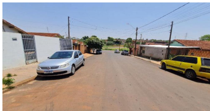
Representação Vista da Rua Descrição Data Foto 14/10/2022