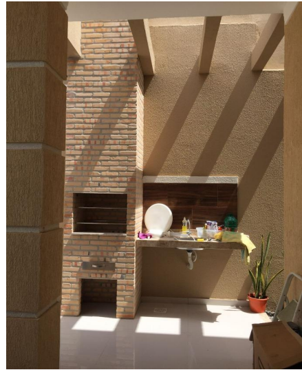
Representação Churrasqueira Descrição Churrasqueira da casa Data Foto 11/11/2022