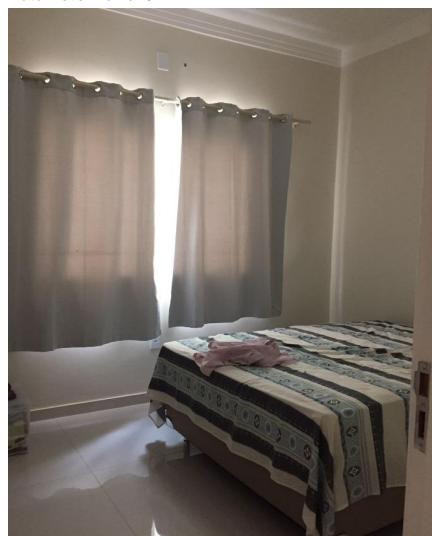
Representação Suíte Descrição Vista interna da suíte 01 Data Foto 11/11/2022