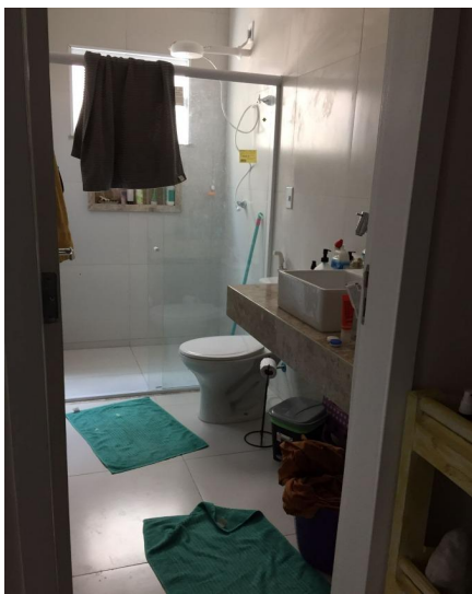
Representação Banheiro Suíte Descrição Vista interna do banheiro da suíte Data Foto 11/11/2022