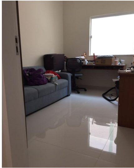
Representação Dormitório Descrição Vista interna do dormitório Data Foto 11/11/2022