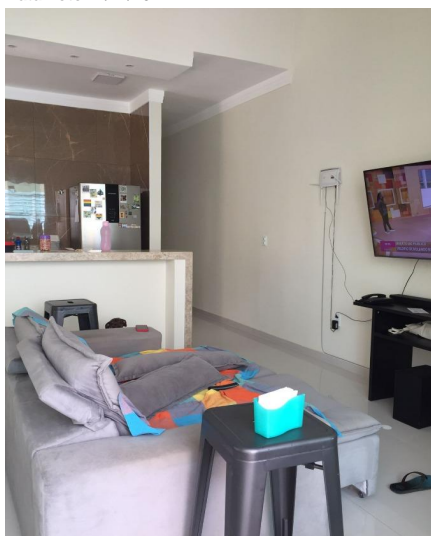
Representação Sala de Estar / Visitas Descrição Vista interna da sala de estar/jantar Data Foto 11/11/2022