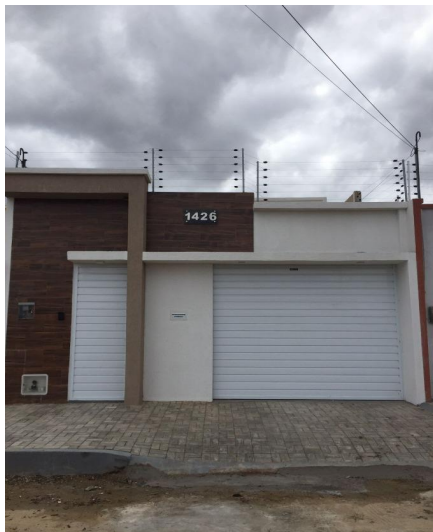
Representação Fachada Principal Descrição Frente da casa Data Foto 11/11/2022