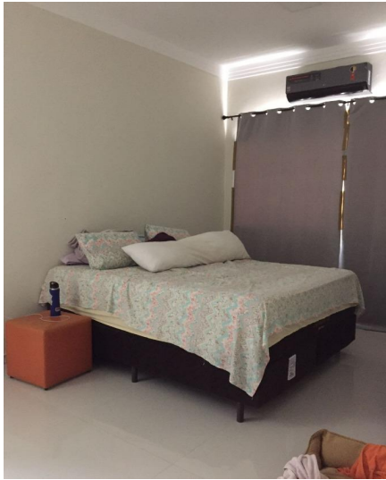
Representação Suíte Descrição Vista interna da suíte 02 Data Foto 11/11/2022