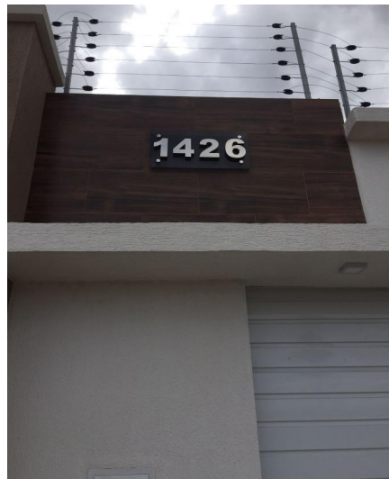
Representação Identificação Numérica Descrição Identificação numérica da casa Data Foto 11/11/2022