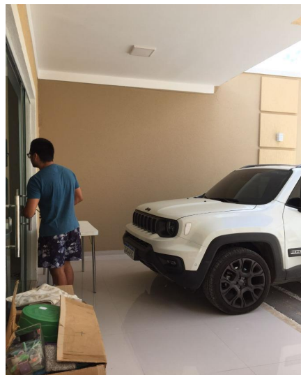
Representação Varanda / Sacada Descrição Vista interna da varanda Data Foto 11/11/2022