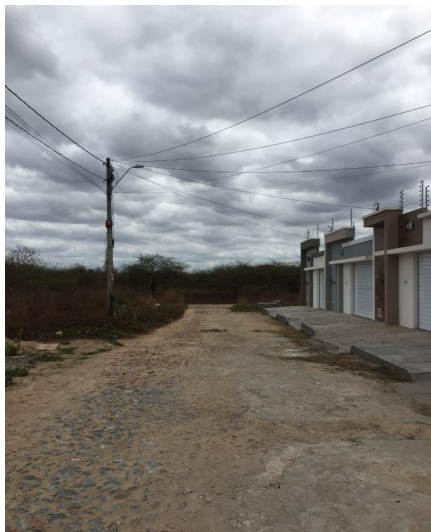
Representação Vista da Rua Descrição Vista da rua do avaliando Data Foto 11/11/2022