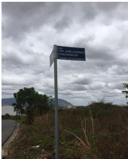
Representação Vista da Rua Descrição Placa da rua do avaliando Data Foto 11/11/2022