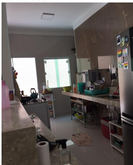
Representação Cozinha Descrição Vista interna da cozinha Data Foto 11/11/2022