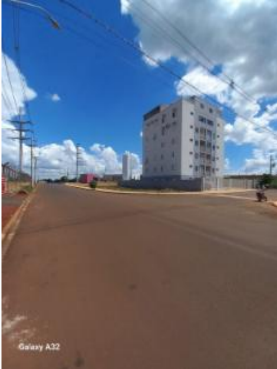
Vista da rua