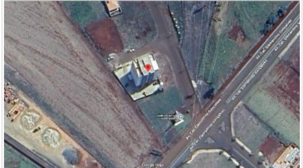
Mapa do avaliando