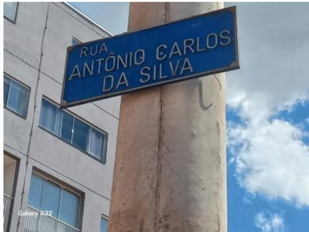
Placa da rua