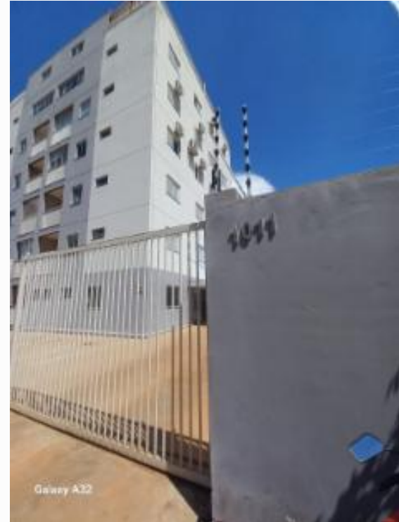
ID do imóvel