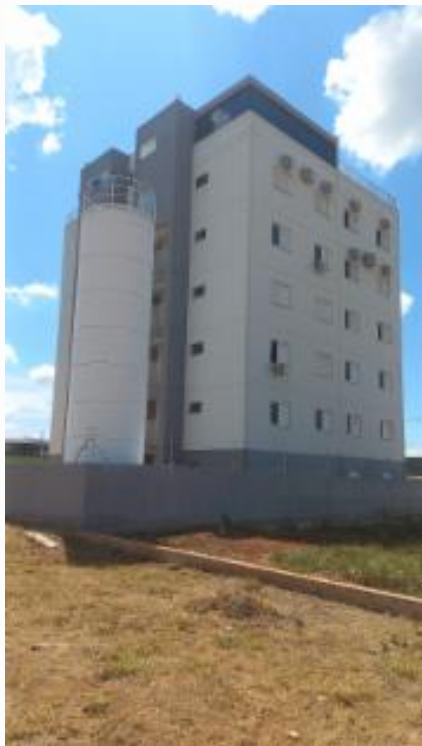
Fachada do imóvel