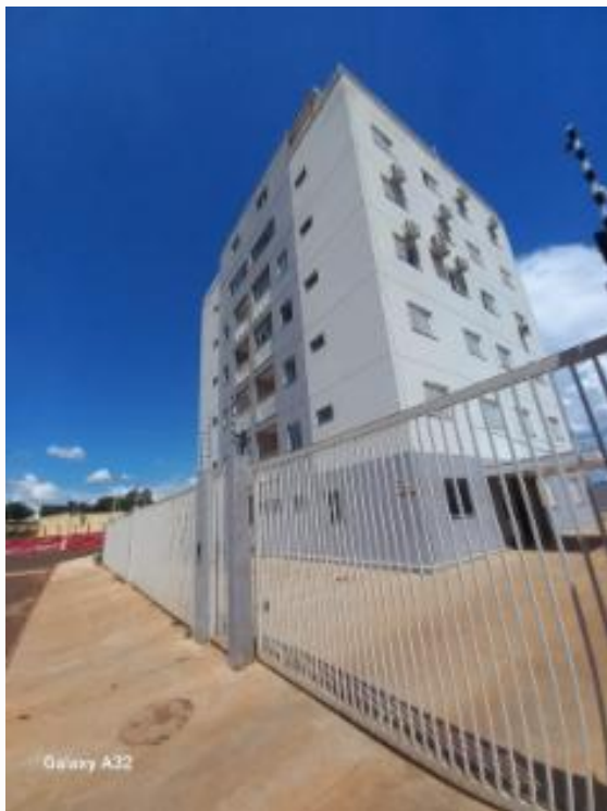
Fachada do imóvel