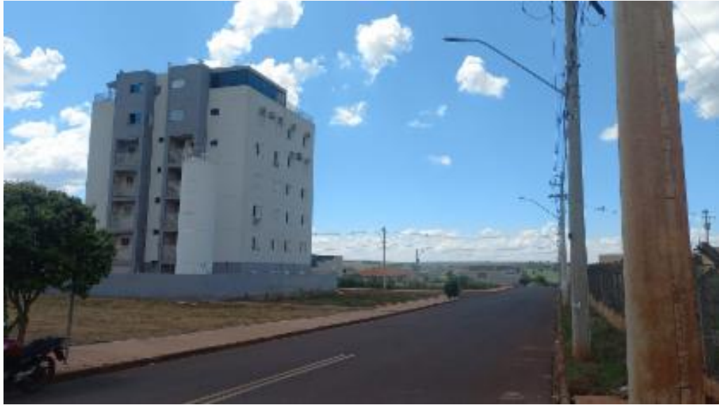
Vista da rua