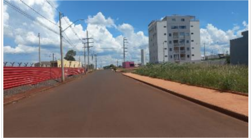
Vista da rua