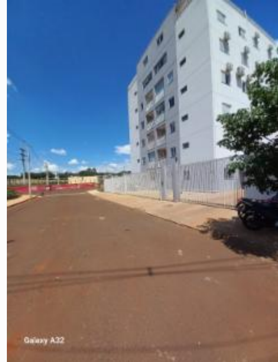
Vista da rua