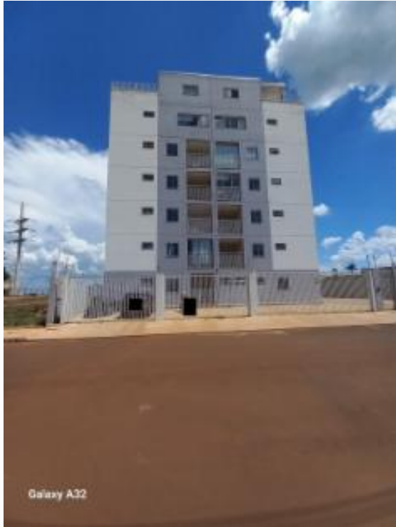
Fachada do imóvel