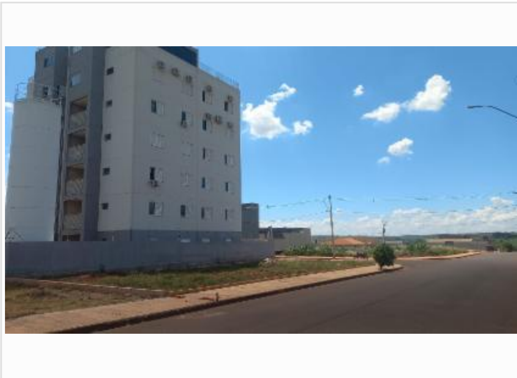
Fachada do imóvel