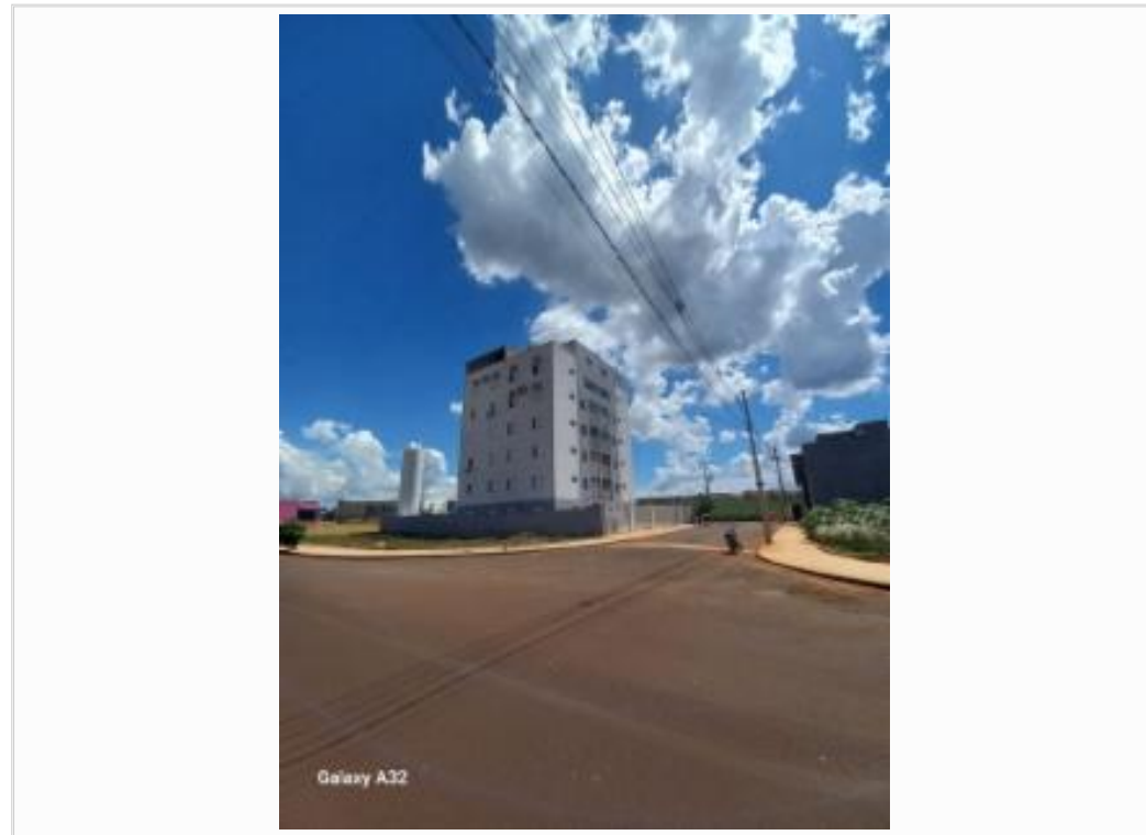
Fachada do imóvel