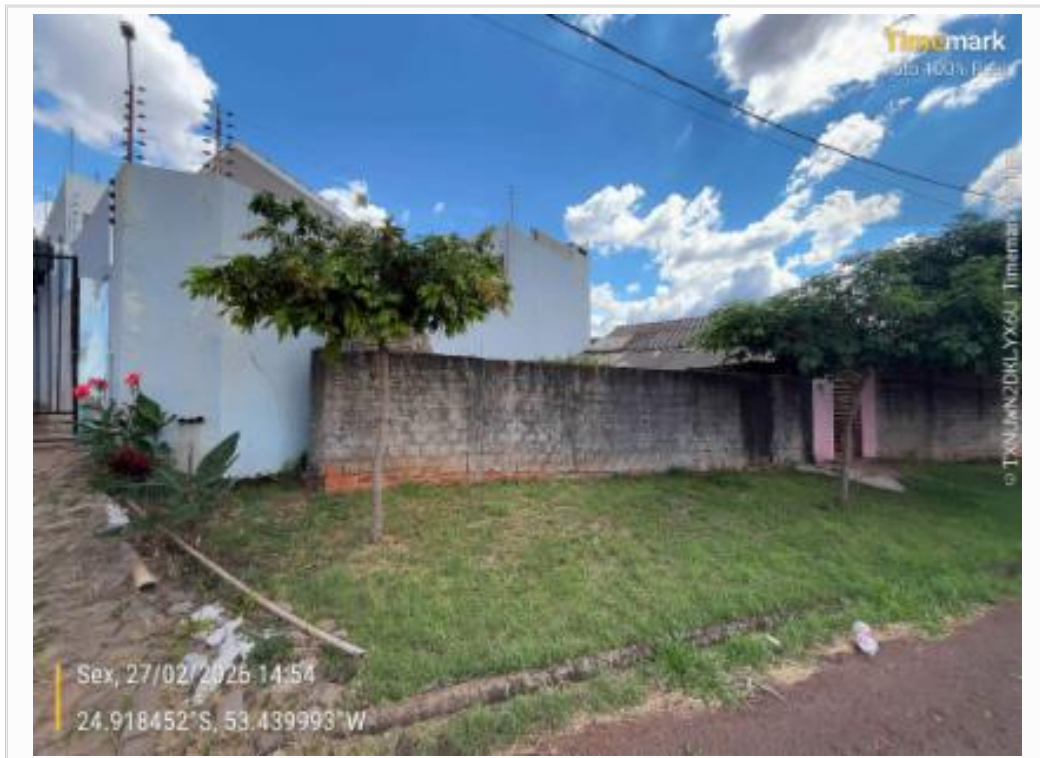
Vizinho Lado Direito