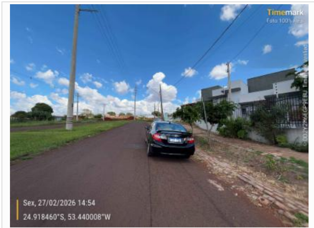
Rua Lado Esquerdo