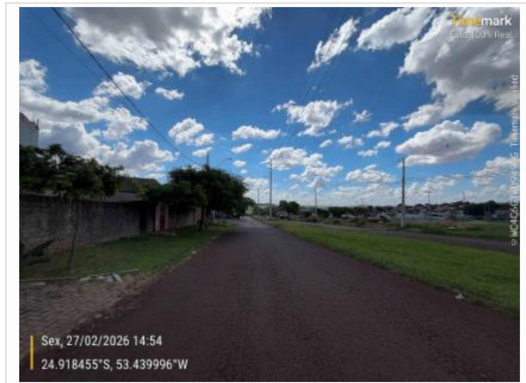
Rua Lado Direito