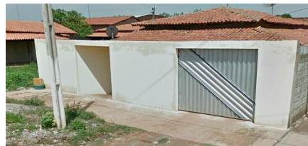
Representação Fachada Principal Descrição Data Foto 27/10/2023