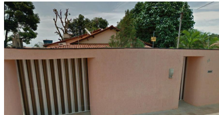
Representação Fachada Principal Descrição Data Foto 27/10/2023