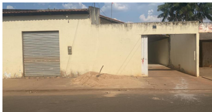
Representação Fachada Principal Descrição Data Foto 27/10/2023