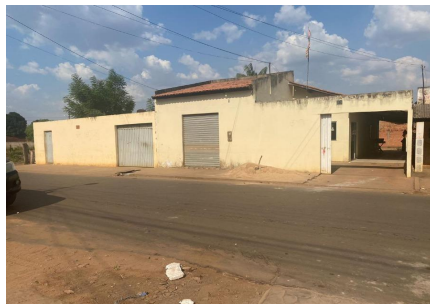
Representação Fachada Principal Descrição Data Foto 27/10/2023