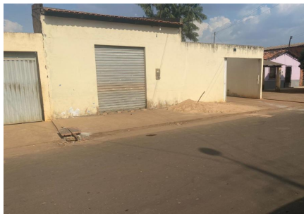
Representação Fachada Principal Descrição Data Foto 27/10/2023