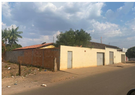
Representação Fachada Principal Descrição Data Foto 27/10/2023