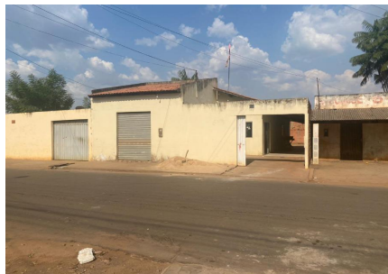
Representação Fachada Principal Descrição Data Foto 27/10/2023