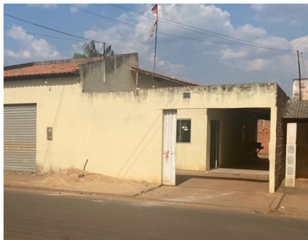
Representação Fachada Principal Descrição Data Foto 27/10/2023