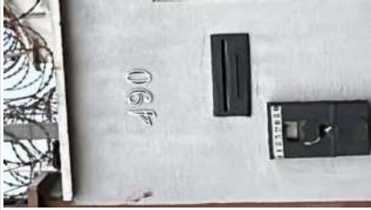
Número de identificação do vizinho à esquerda