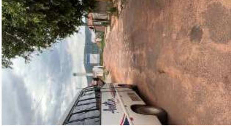
Avenida à direita