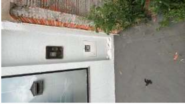
Pontos de água e elétrica