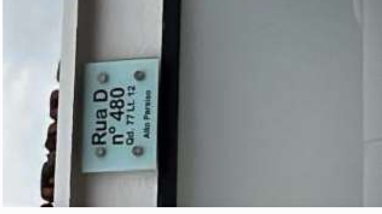
Placa do imóvel visitado