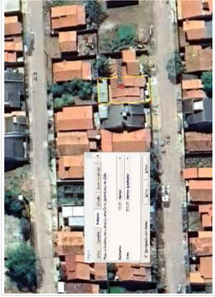
Croqui de amostras