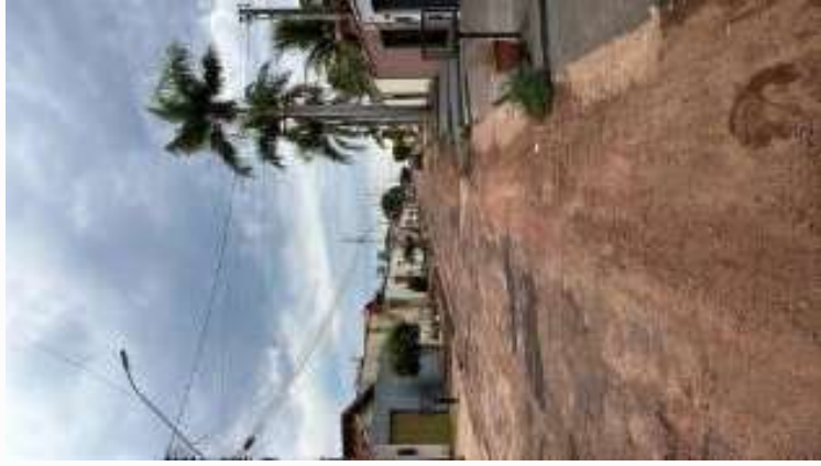
Avenida à esquerda