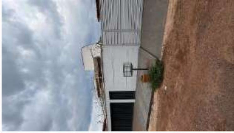
Vizinho á esquerda do imóvel vistoriado