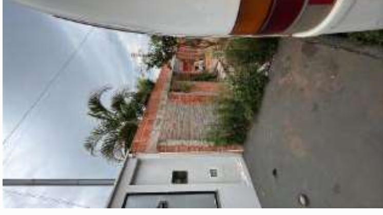
Vizinho à direita do imóvel vistoriado