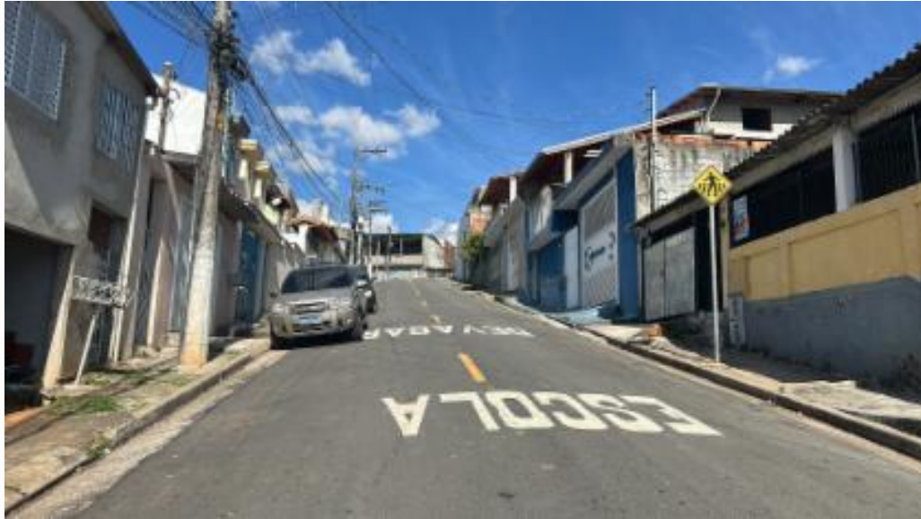
Vista da rua