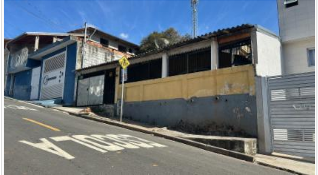
Vizinho à direita