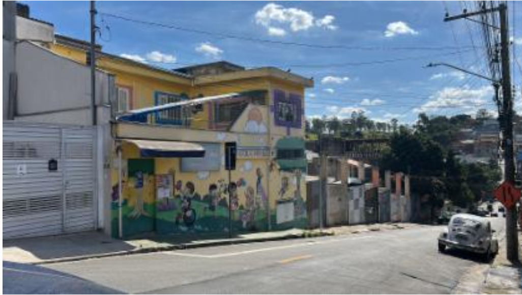
Vizinho à direita