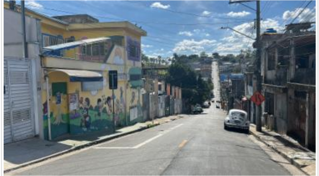
Vista da rua