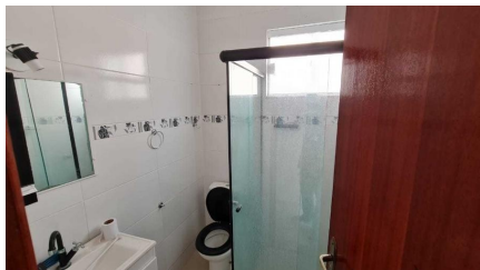
Representação Banheiro social Descrição Data Foto 07/07/2021