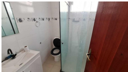
Representação Banheiro social Descrição Data Foto 07/07/2021