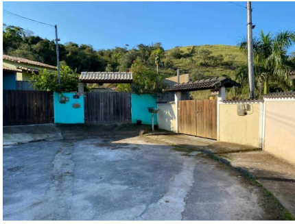
Representação Vista da Rua Descrição Data Foto 07/07/2021