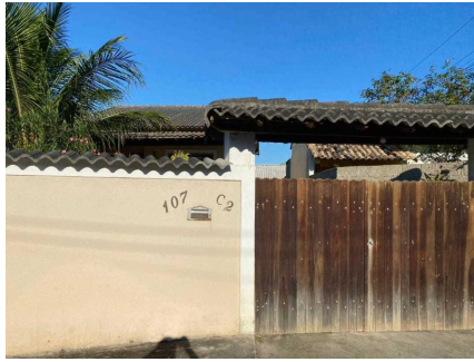
Representação Descrição Vizinhos Data Foto 07/07/2021