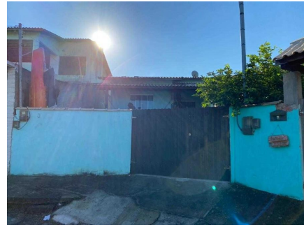
Representação Descrição Vizinhos Data Foto 07/07/2021