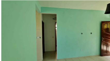
Representação Sala de Estar / Visitas Descrição Data Foto 07/07/2021