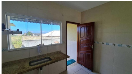
Representação Cozinha Descrição Data Foto 07/07/2021