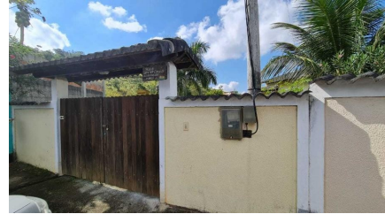
Representação Fachada Principal Descrição Data Foto 07/07/2021