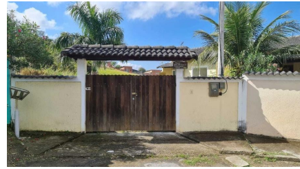
Representação Fachada Principal Descrição Data Foto 07/07/2021