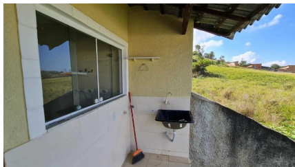
Representação Área de Serviço Coberta Descrição Data Foto 07/07/2021