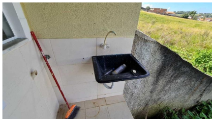
Representação Área de Serviço Coberta Descrição Data Foto 07/07/2021