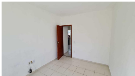
Representação Dormitório Descrição Data Foto 07/07/2021