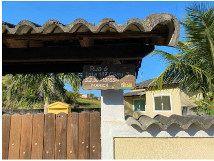
Representação Identificação Numérica Descrição Data Foto 07/07/2021