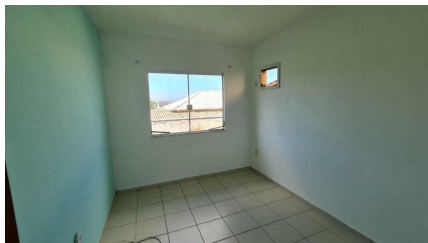
Representação Dormitório Descrição Data Foto 07/07/2021