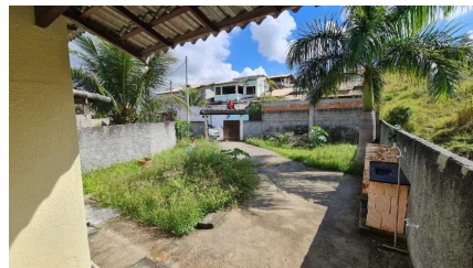
Representação Garagem Descrição Data Foto 07/07/2021