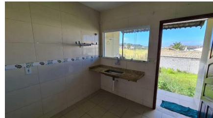
Representação Cozinha Descrição Data Foto 07/07/2021