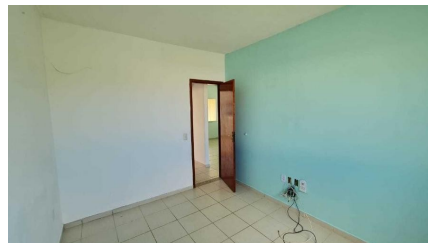
Representação Dormitório Descrição Data Foto 07/07/2021