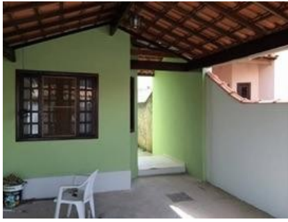
Representação Fachada Principal