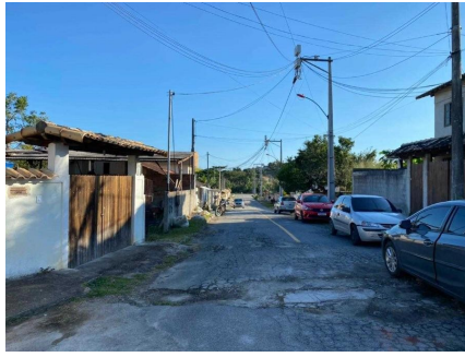
Representação Vista da Rua Descrição Data Foto 07/07/2021