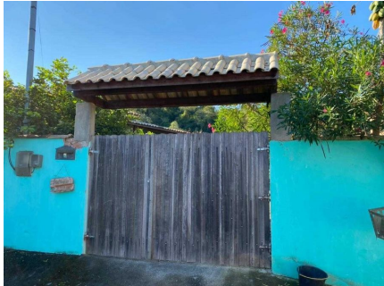
Representação Descrição Vizinhos Data Foto 07/07/2021