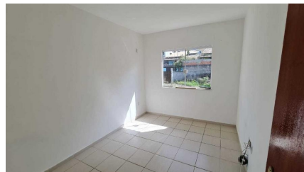
Representação Dormitório Descrição Data Foto 07/07/2021