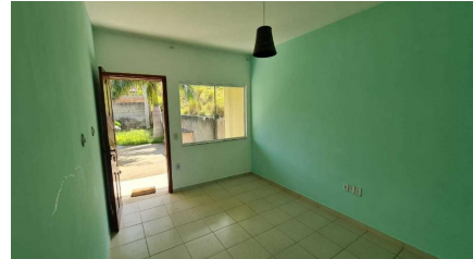
Representação Sala de Estar / Visitas Descrição Data Foto 07/07/2021