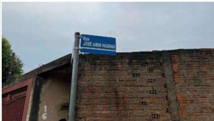
Id do Logradouro