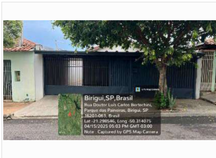
Fachada/ data e hora