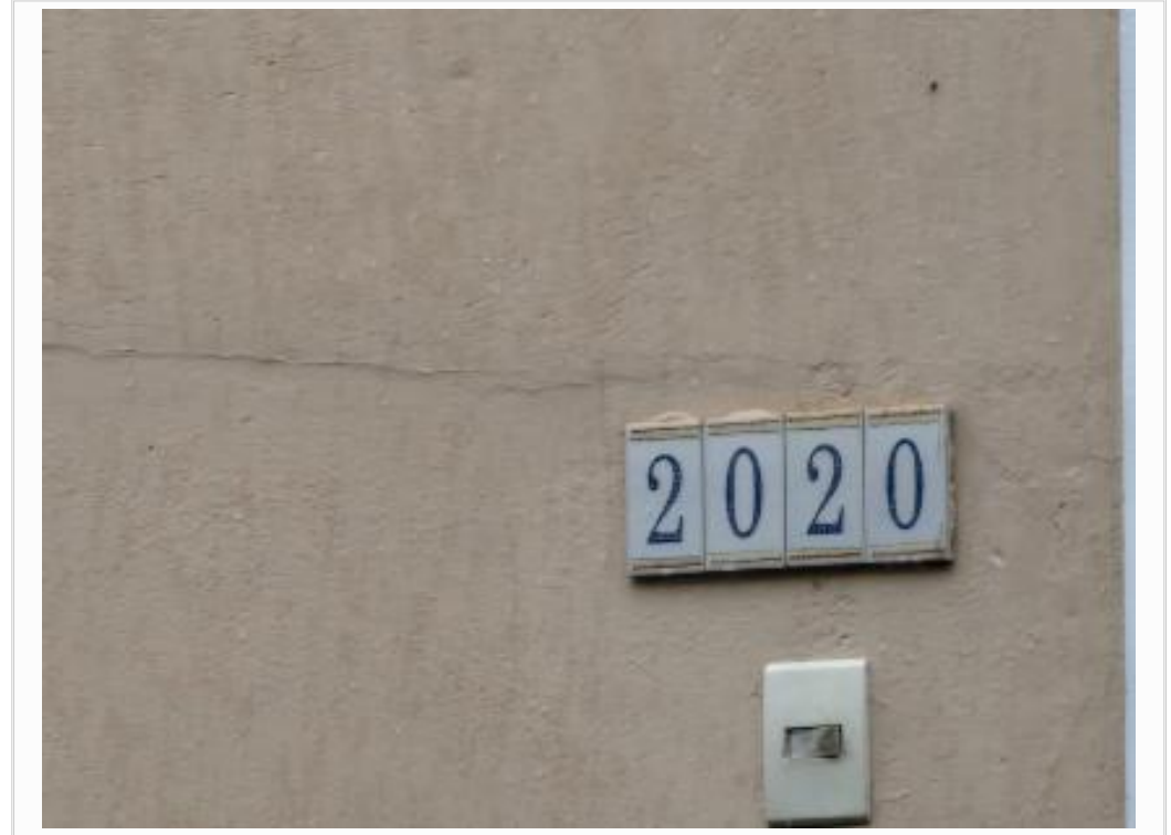
- id vz esq