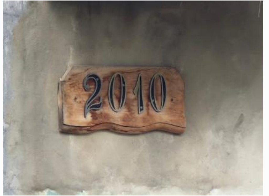
id Vizinho direito