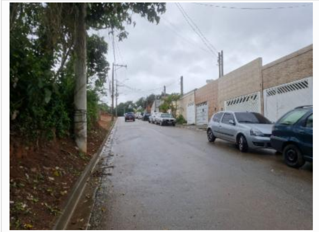
- via esq