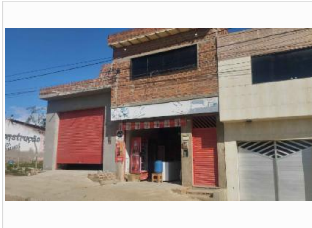
Vizinho à direita