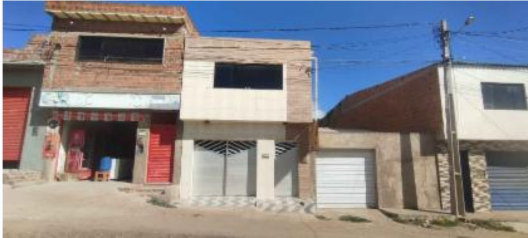
Fachada do avaliando