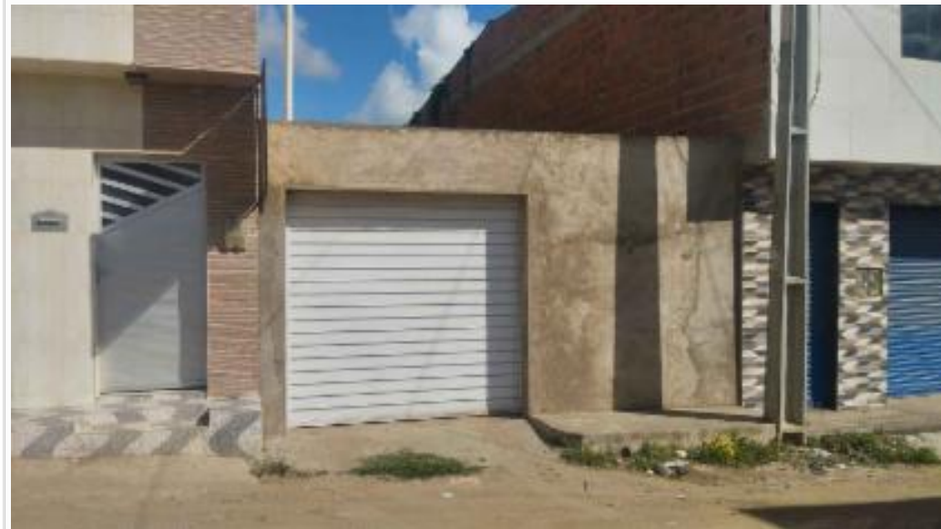
Vizinho à esquerda