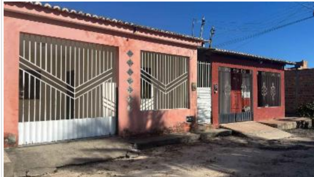
vista da fachada/vizinhos