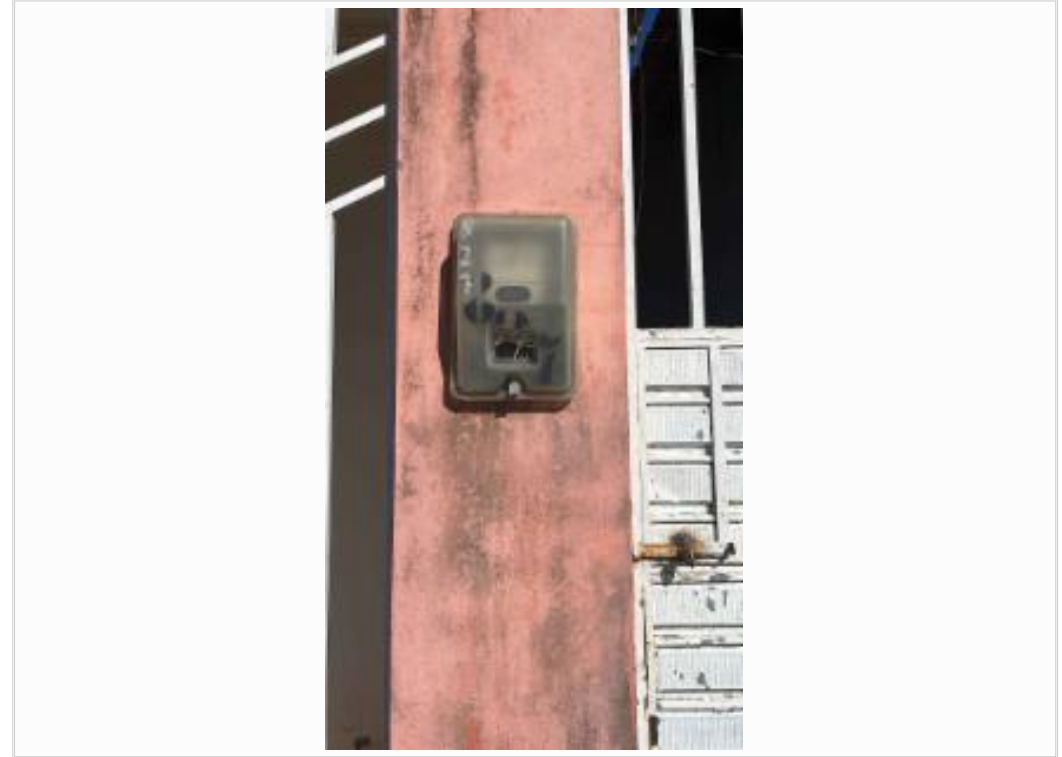
id da unidade