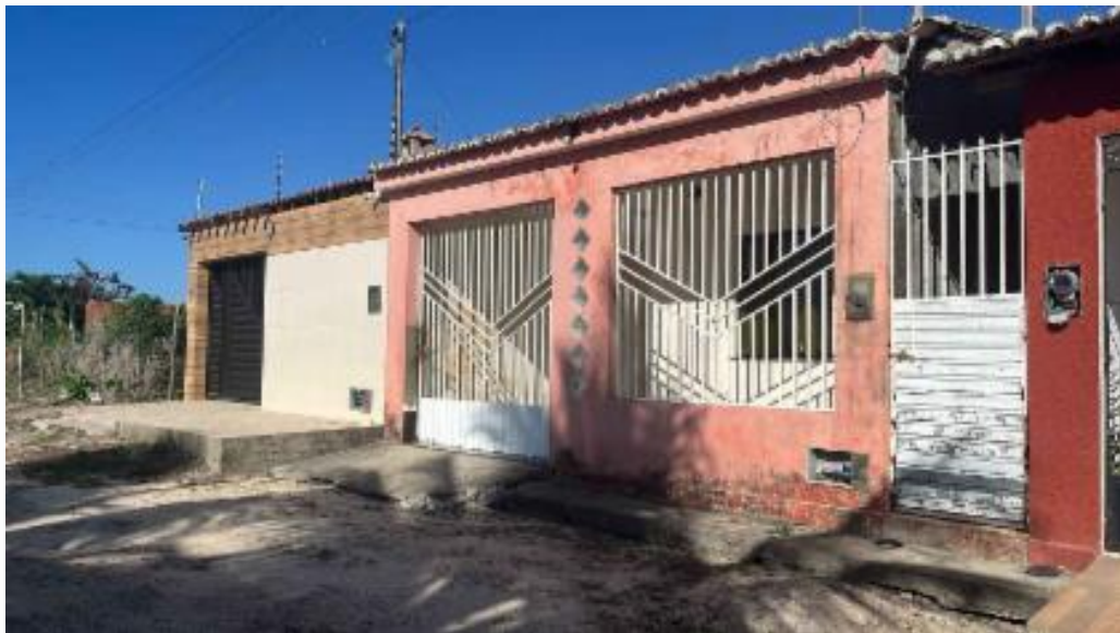
vista da fachada/vizinhos