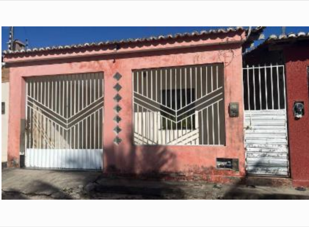
vista da fachada