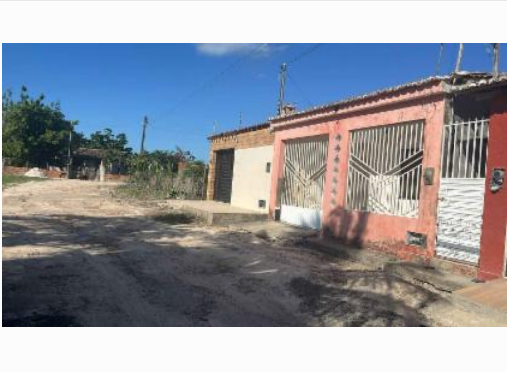
vista do logradouro