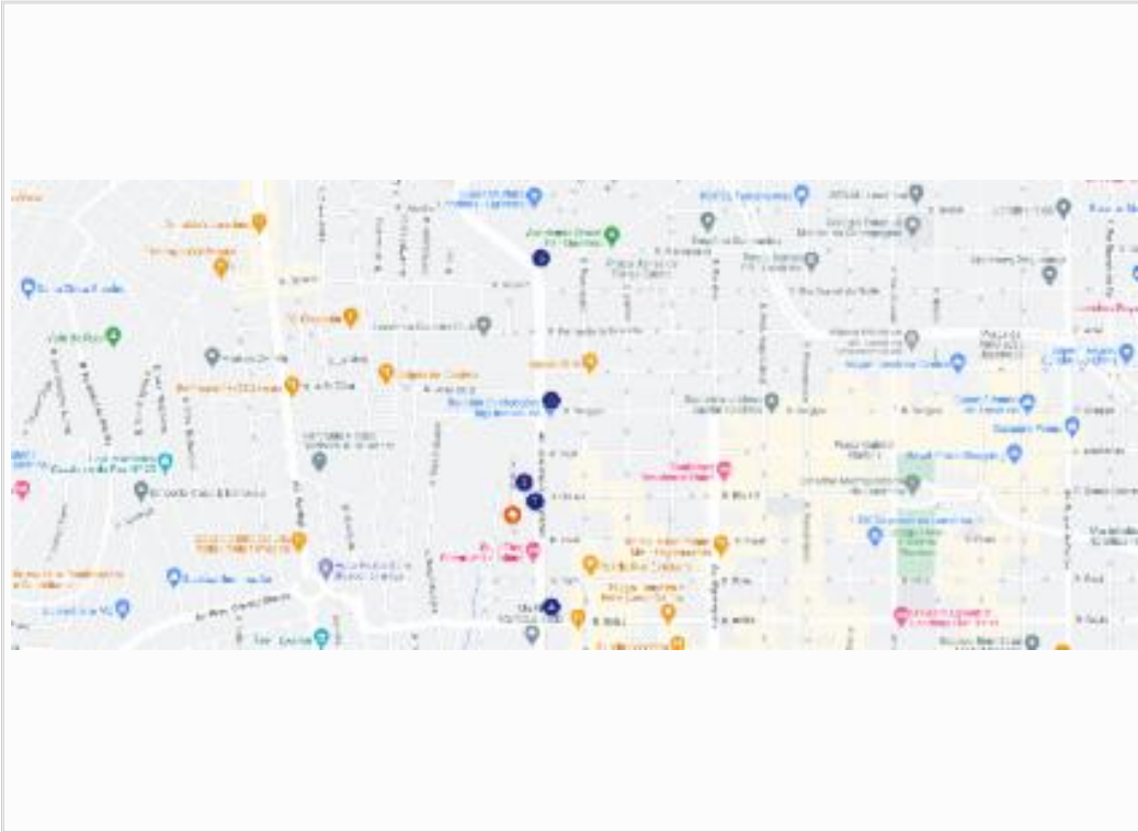
Croqui de amostras