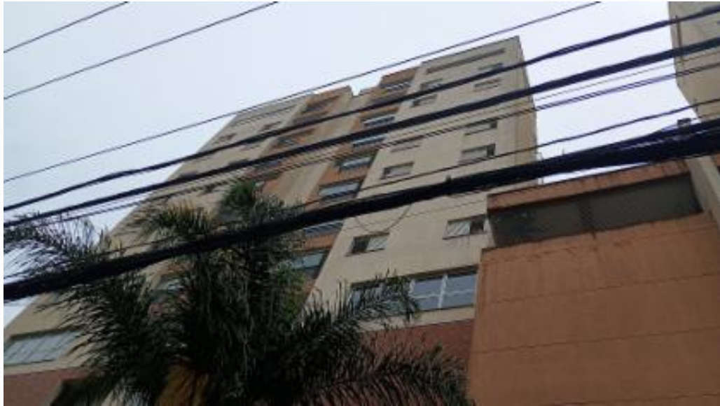
Fachada - vista 1