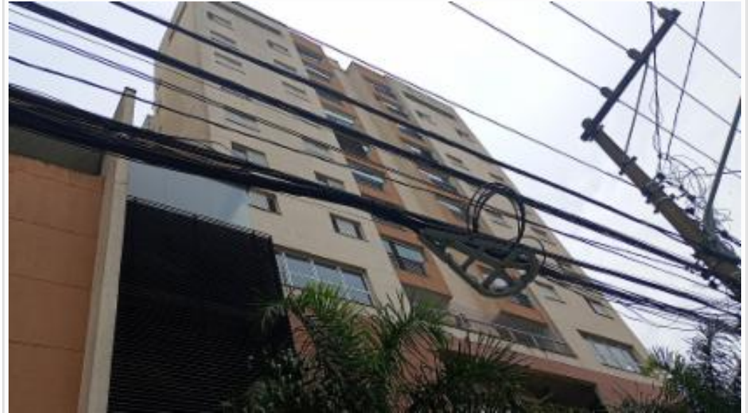
Fachada - vista 2