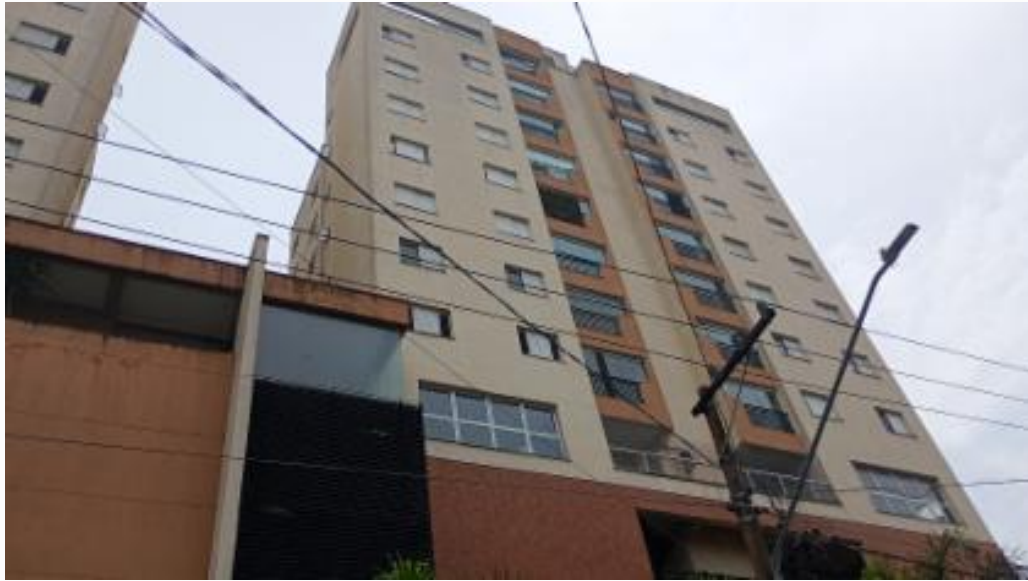
Fachada - vista 4