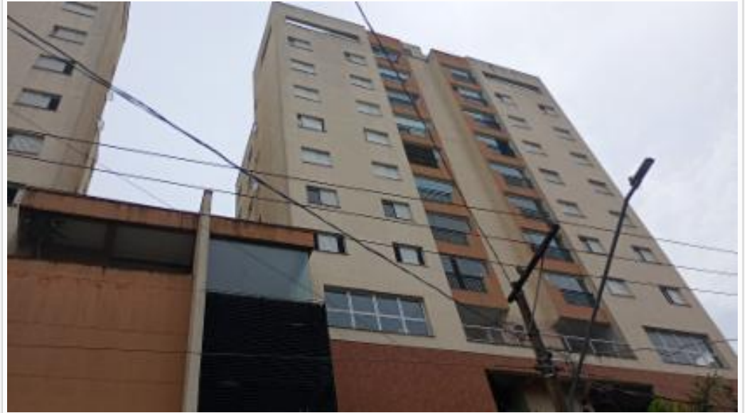
Fachada - vista 5