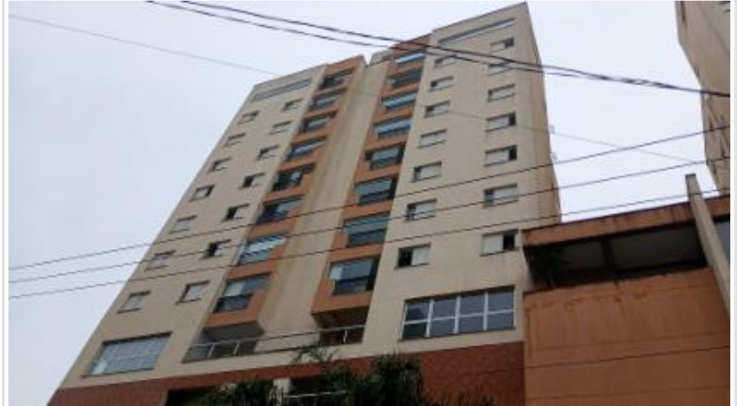
Fachada - vista 3