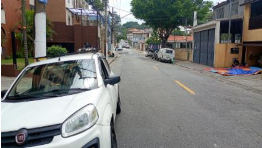
Vista da rua lado esquerdo