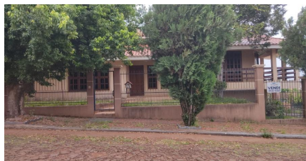
Representação Fachada Principal Descrição