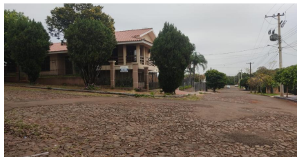
Representação Vista da Rua Descrição