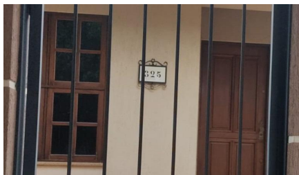
Representação Identificação Numérica Descrição