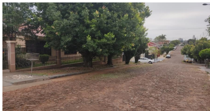
Representação Vista da Rua Descrição