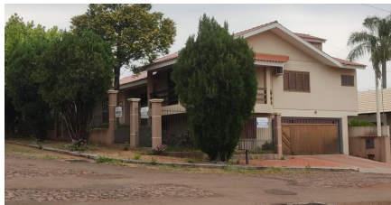
Representação Fachada Principal Descrição