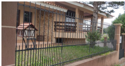
Representação Fachada Principal Descrição