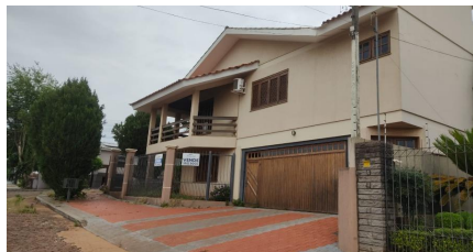
Representação Fachada Principal Descrição