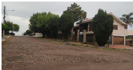
Representação Vista da Rua Descrição