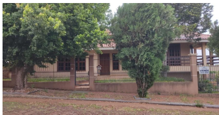
Representação Fachada Principal Descrição