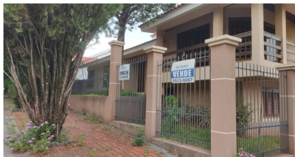
Representação Fachada Principal Descrição