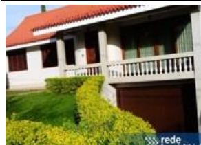
Representação Fachada Principal Descrição