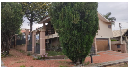
Representação Fachada Principal Descrição