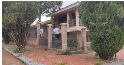
Representação Fachada Principal Descrição