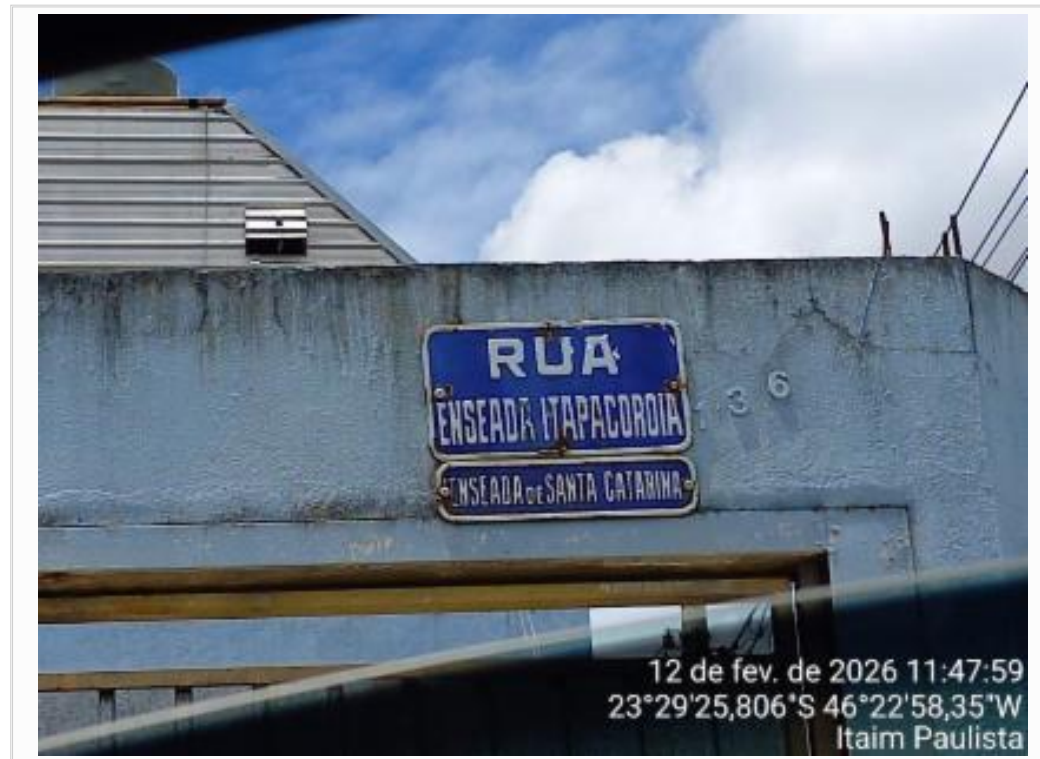
Vista da rua