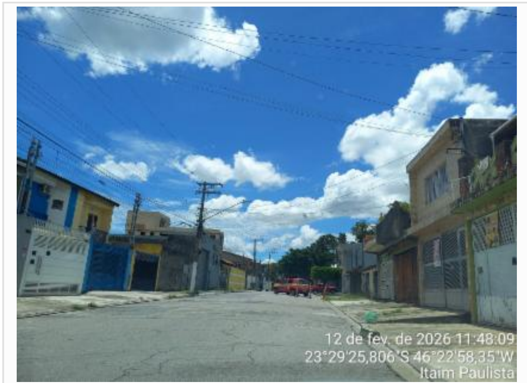
Vista da rua