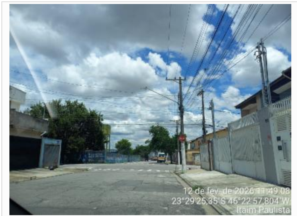
Vista da rua