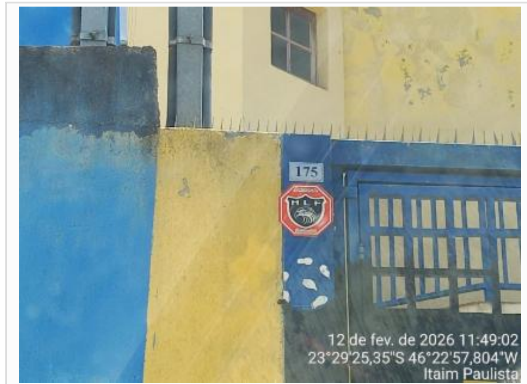
Identificação do avaliando