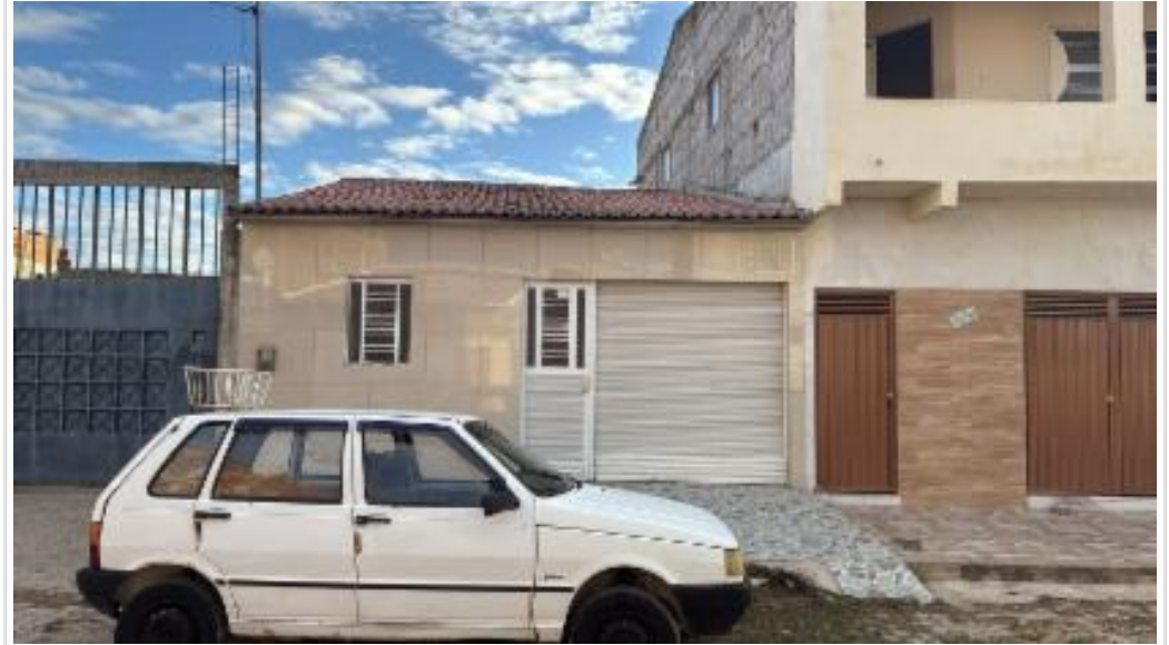
Fachada do avaliando