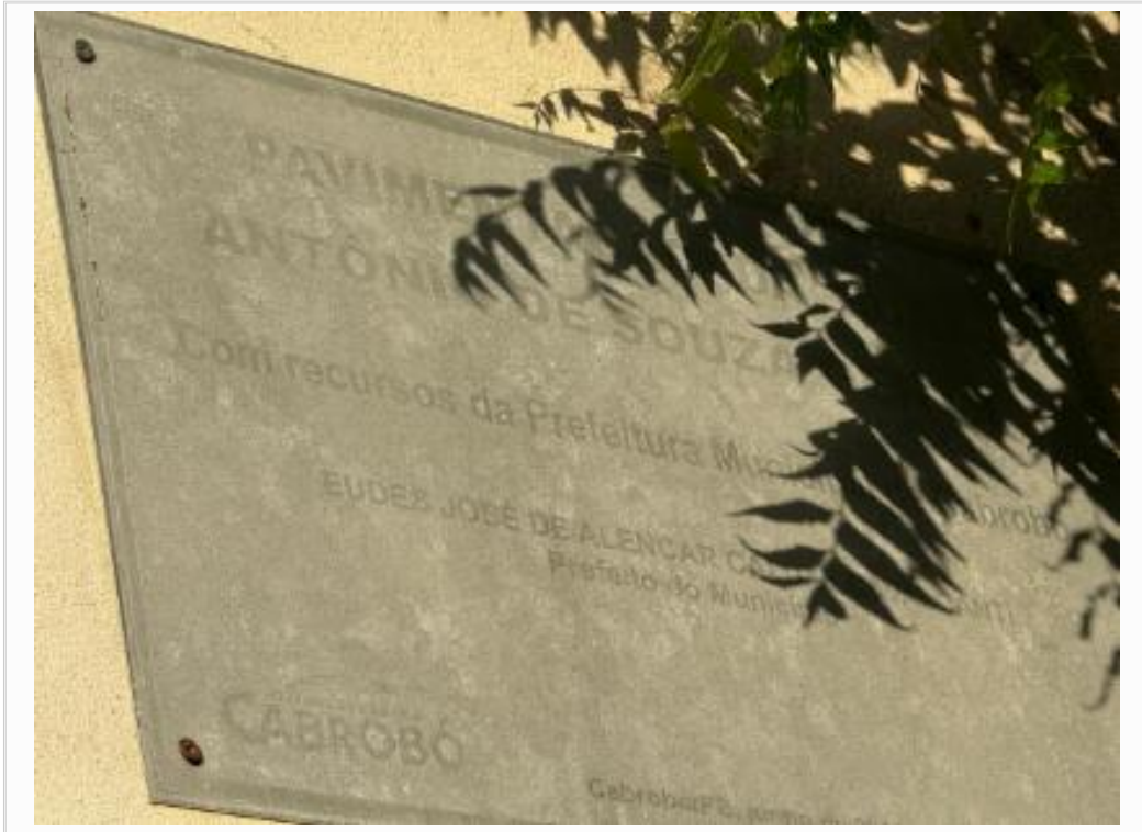
Placa da rua