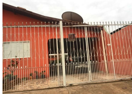
Representação Fachada Principal