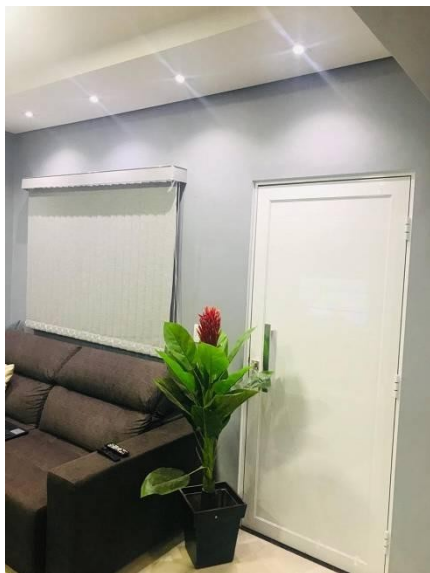
Representação Fachada Principal