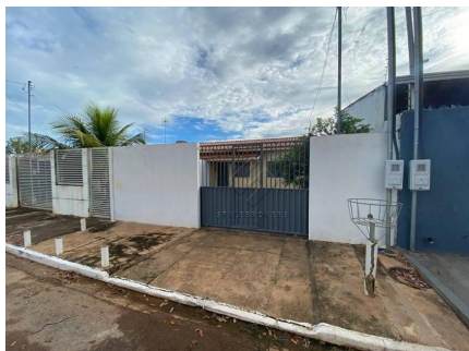
Representação Fachada Principal