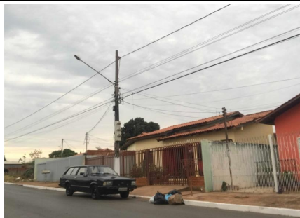
Representação Vista da Rua