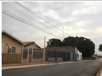
Representação Vista da Rua