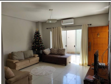
Representação Fachada Principal