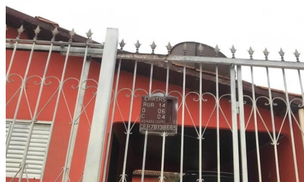
Representação Identificação Numérica