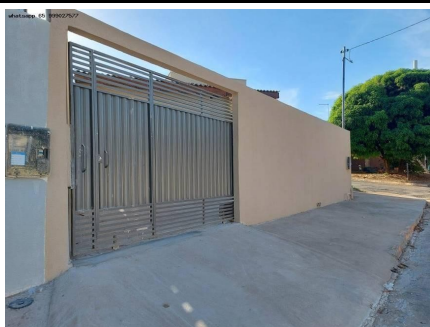
Representação Fachada Principal