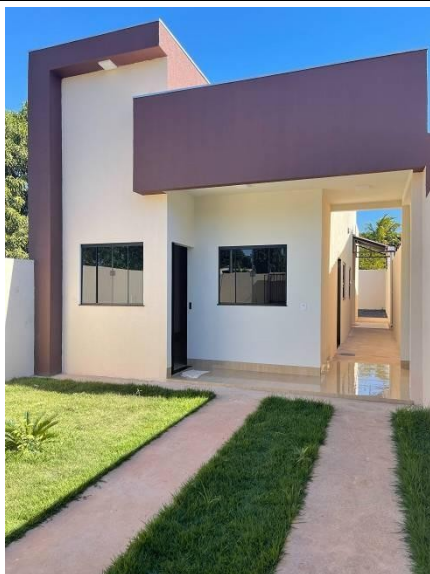
Representação Fachada Principal