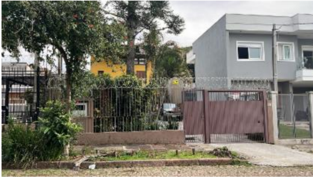
vista parcial da fachada