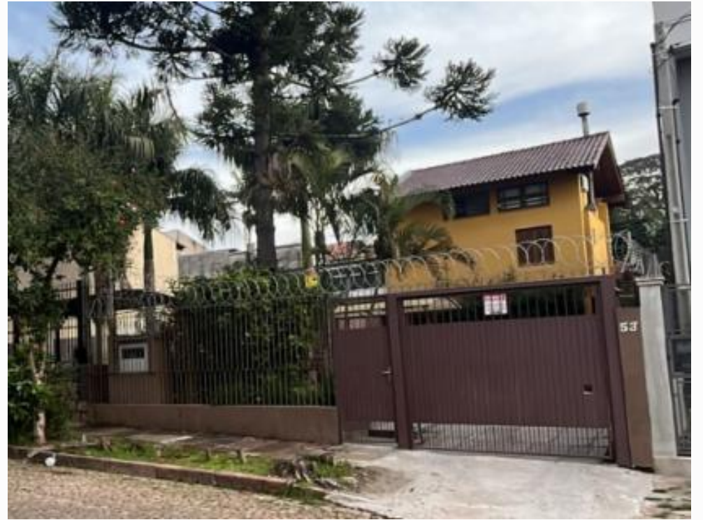
vista parcial da fachada