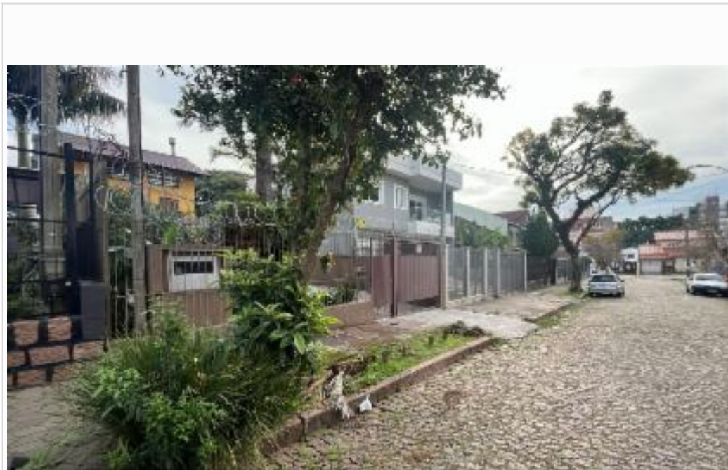
vista da rua