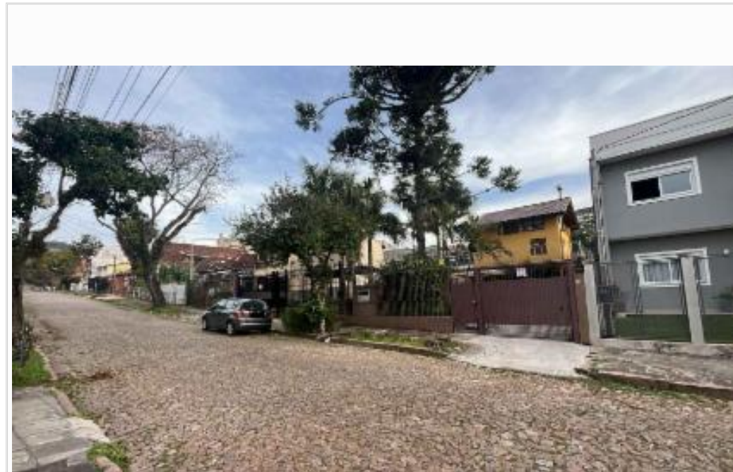
vista da rua