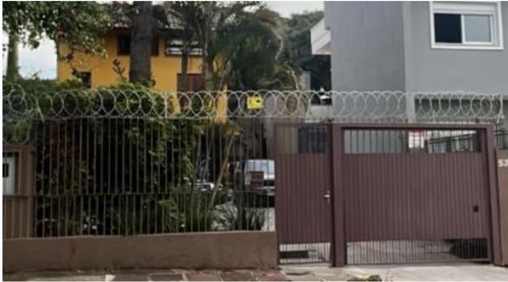
vista parcial da fachada