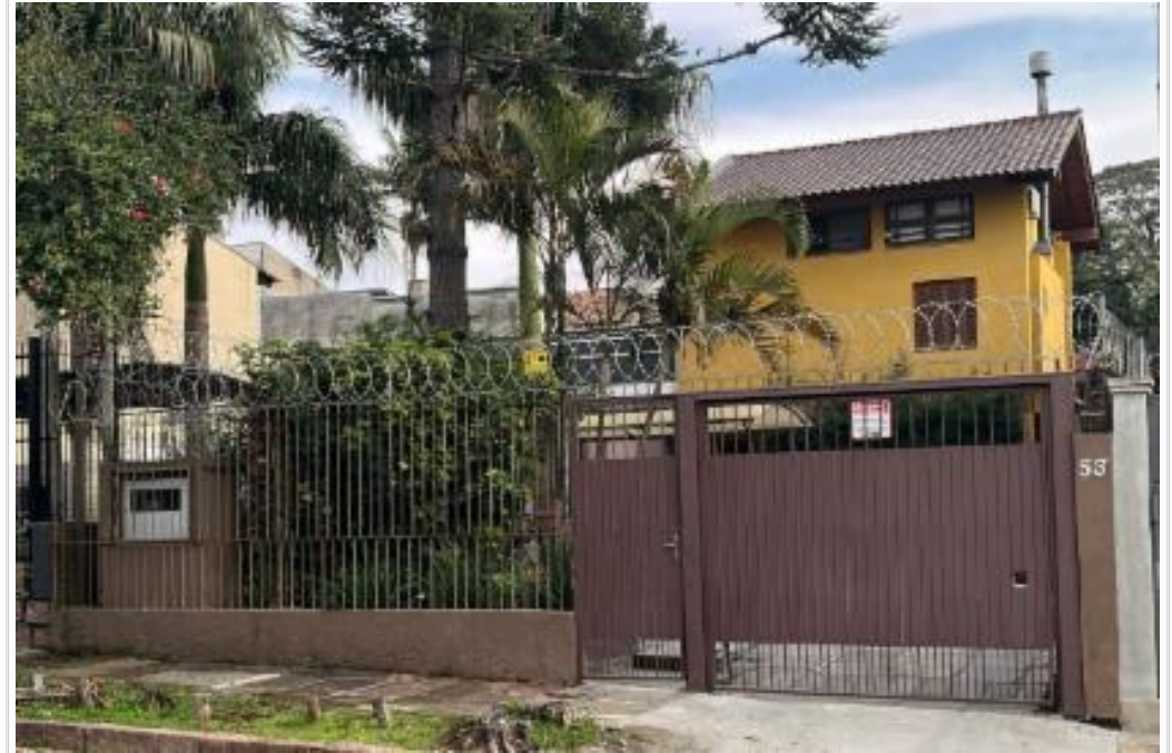
vista parcial da fachada