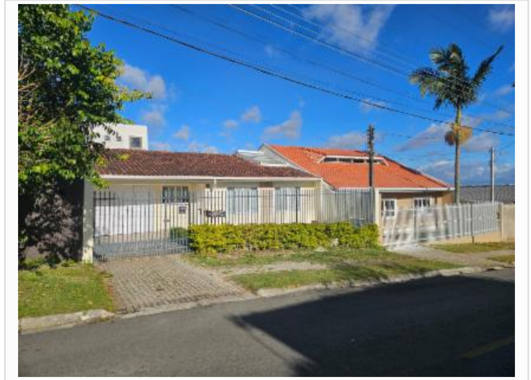
Vizinho da direita