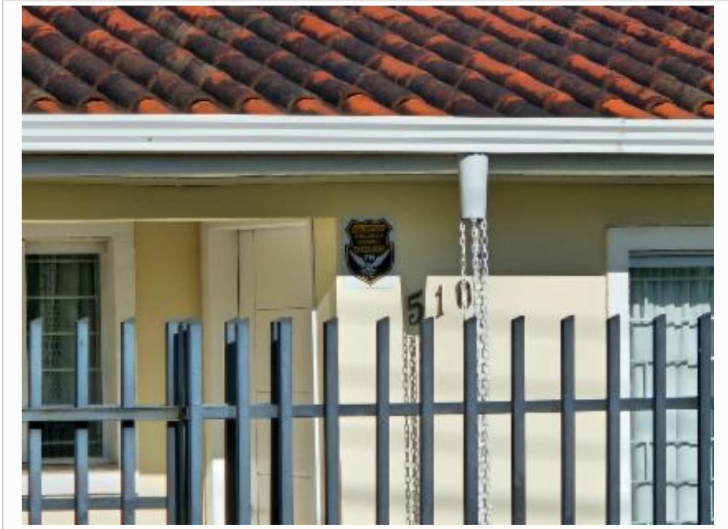
Vizinho da direita