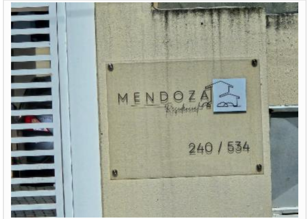
Vizinho da esquerda