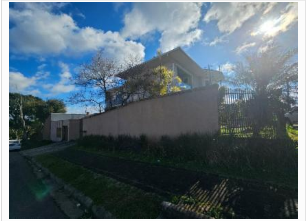
Vizinho da frente