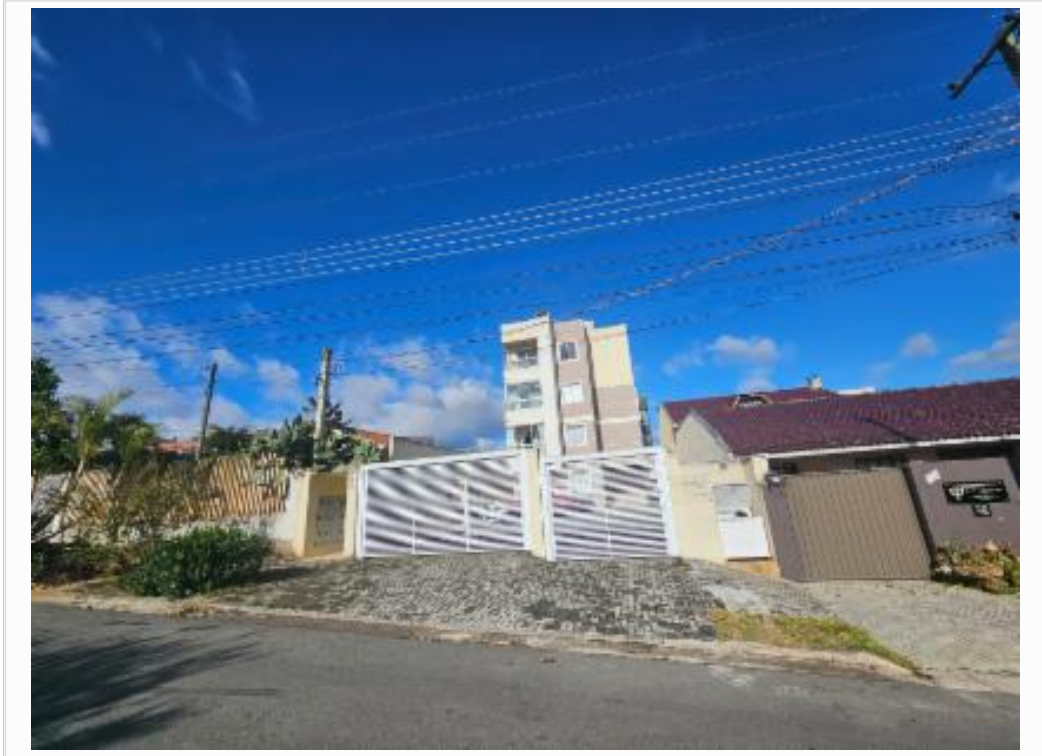
Vizinho da esquerda