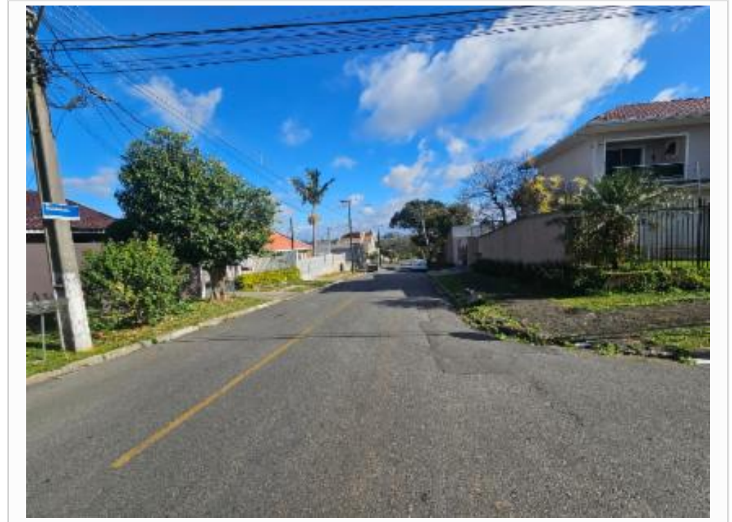
Vista da rua