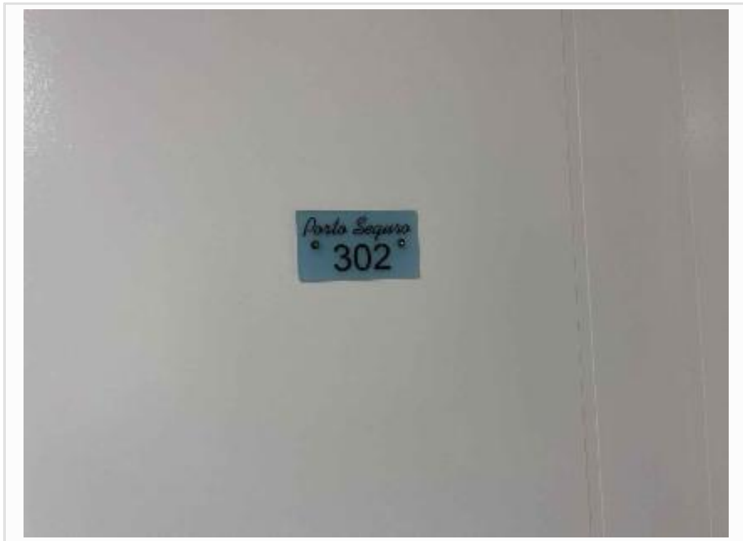
Identificação - apto