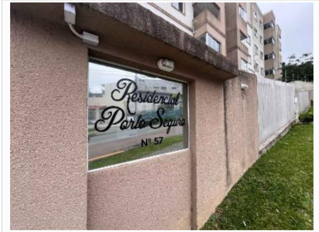
Identificação - condomínio