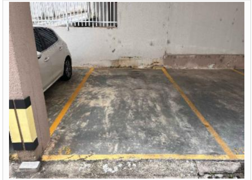
Vaga de garagem