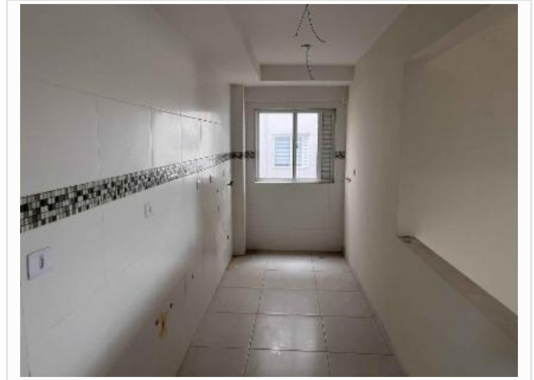
Cozinha/área de serviço