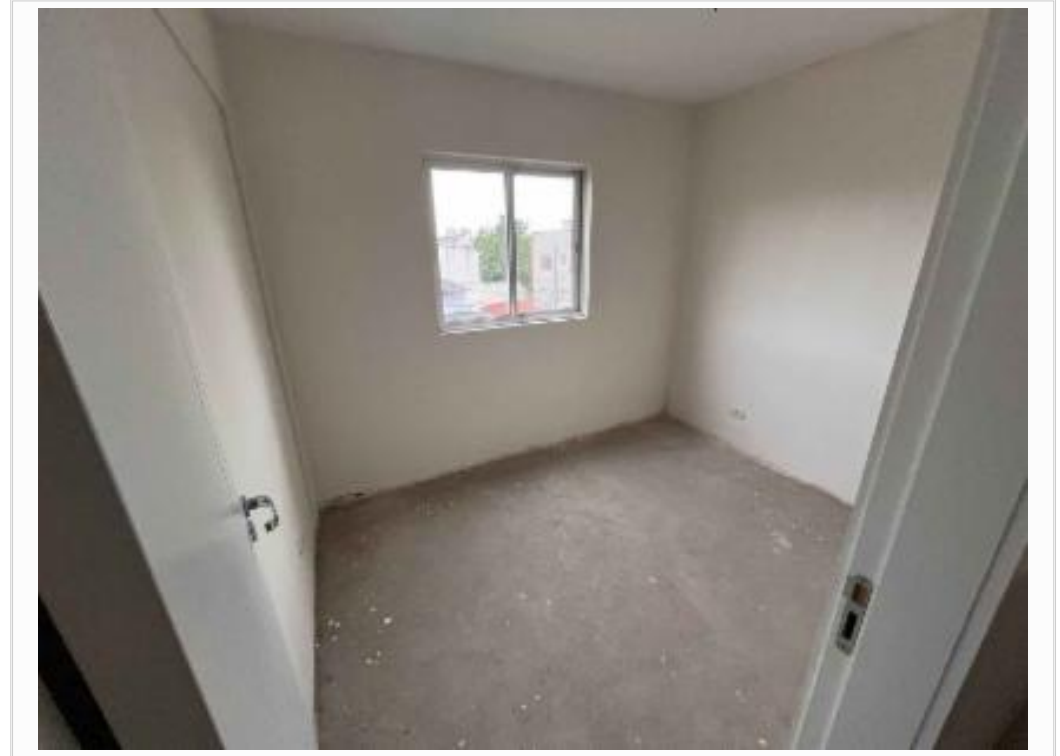
Dormitório - 02