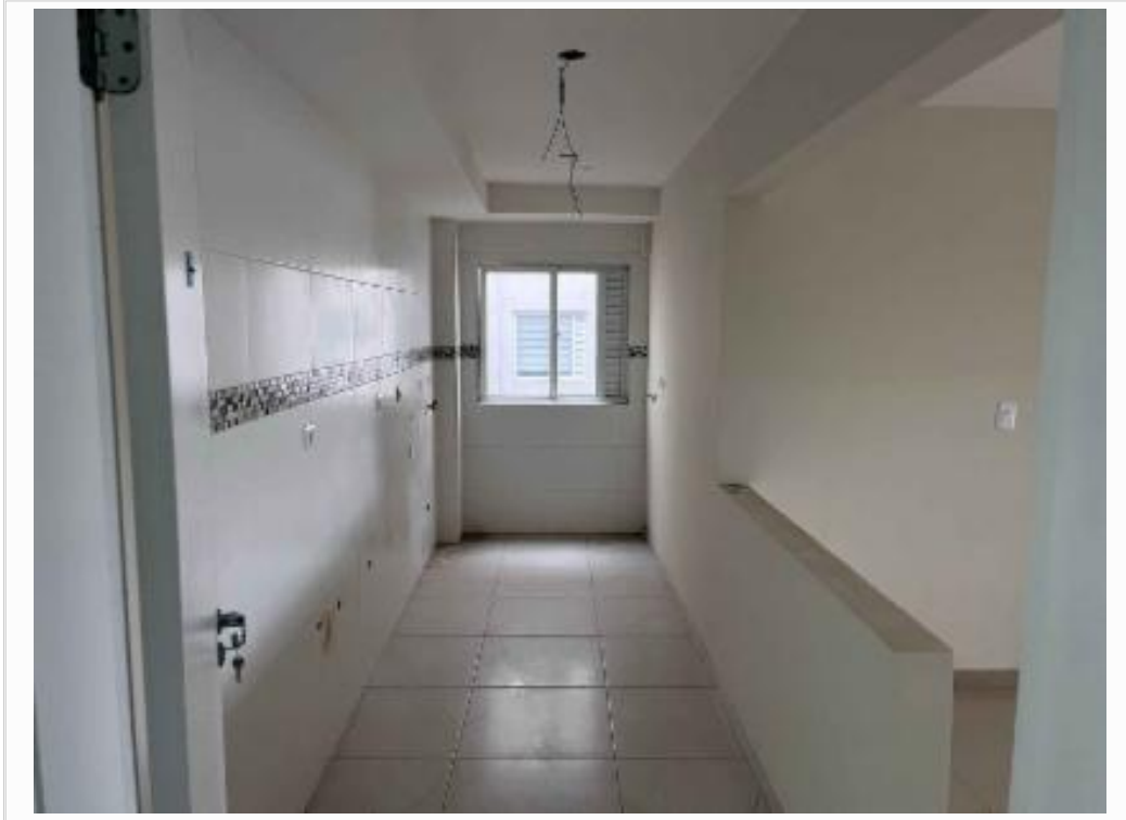
Cozinha/área de serviço