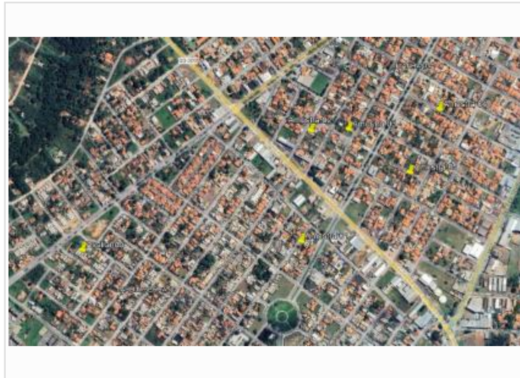
Croqui das amstras