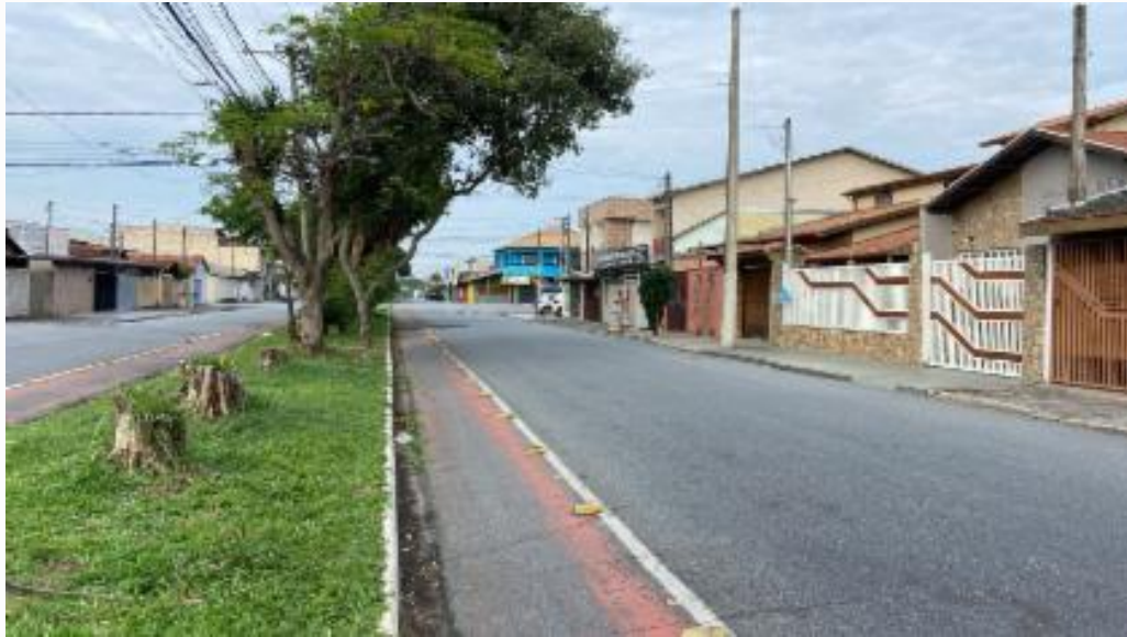
Rua lado esquerdo