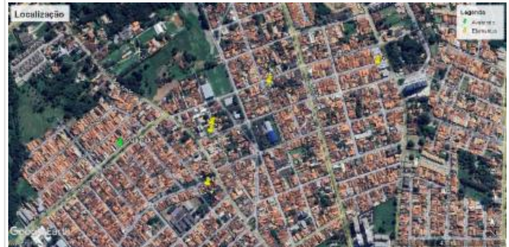
Mapa de elementos