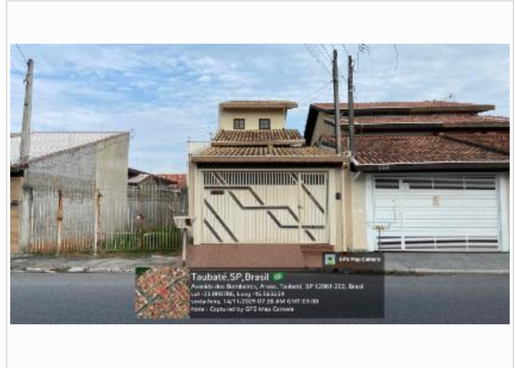
Fachada / Data e hora