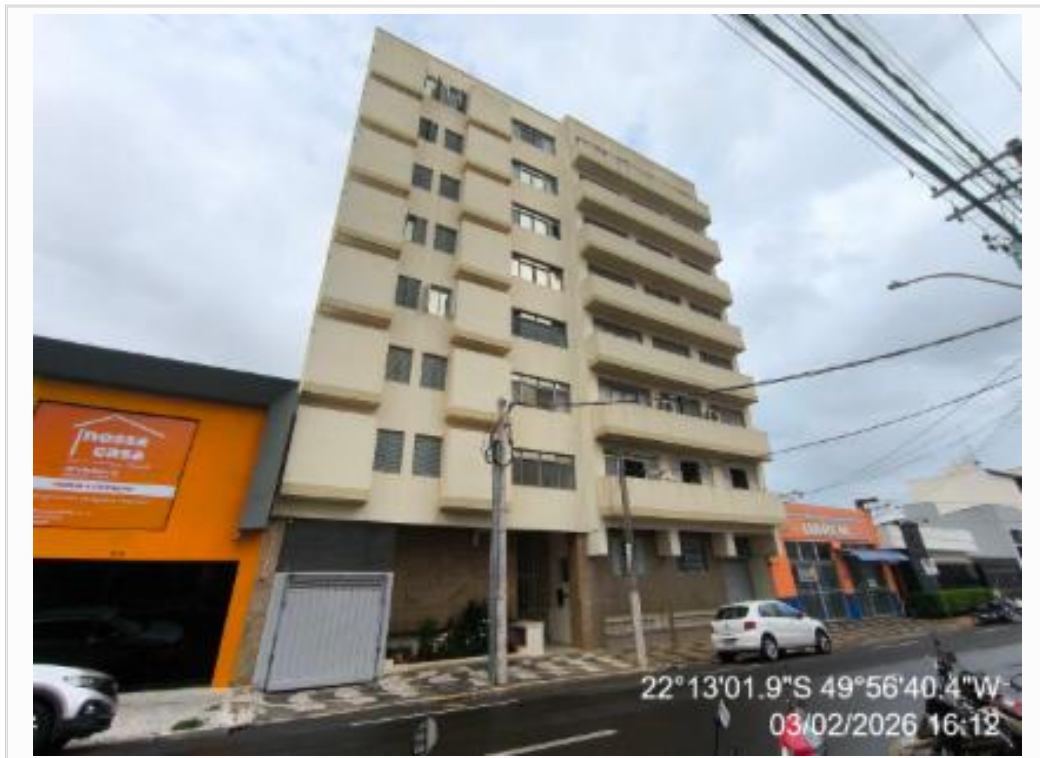
FACHADA DO CONDOMINIO