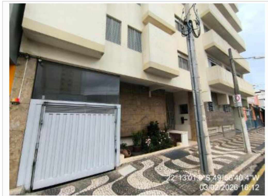
FACHADA DO CONDOMINIO