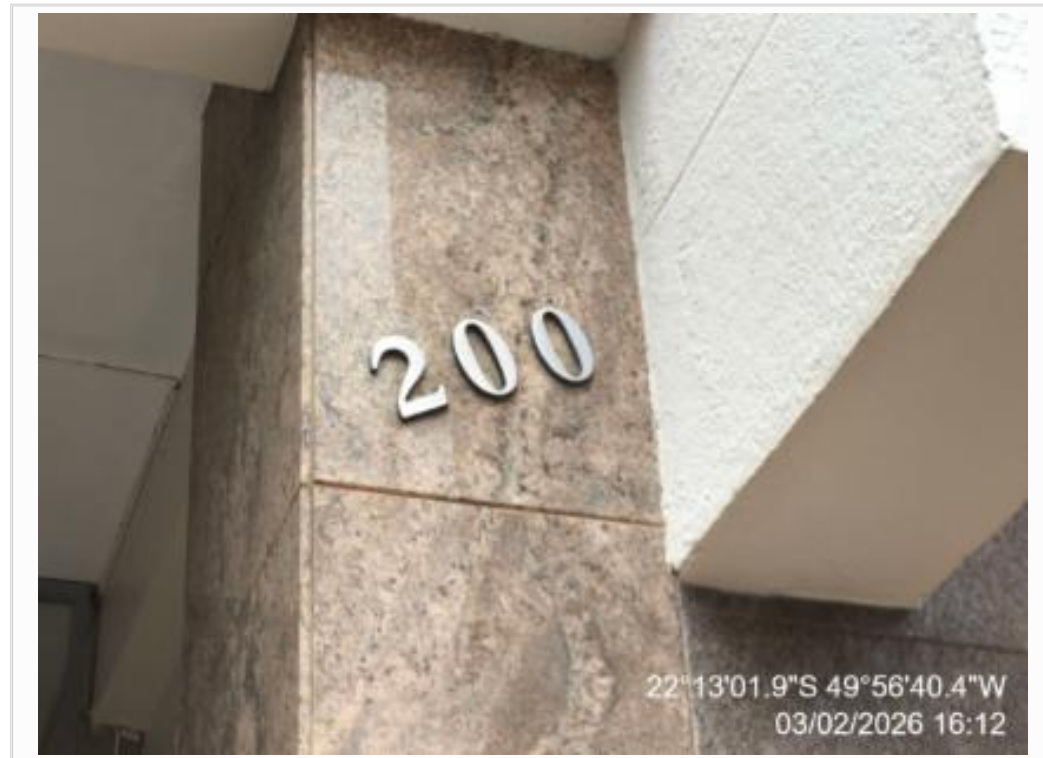
IDENTIFICAÇÃO DO CONDOMÍNIO