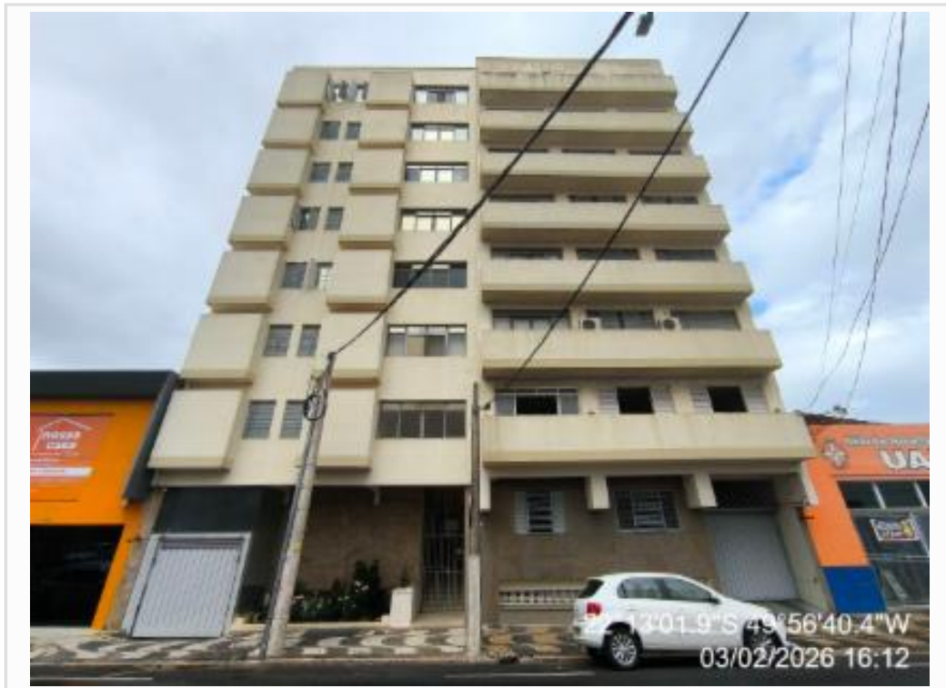
FACHADA DO CONDOMINIO