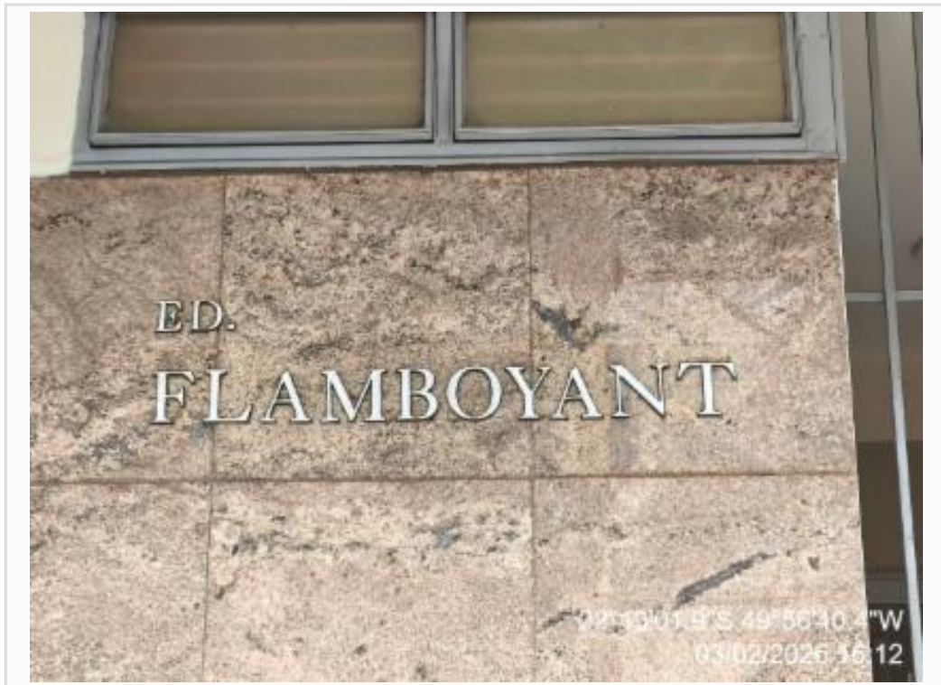
IDENTIFICAÇÃO DO CONDOMÍNIO