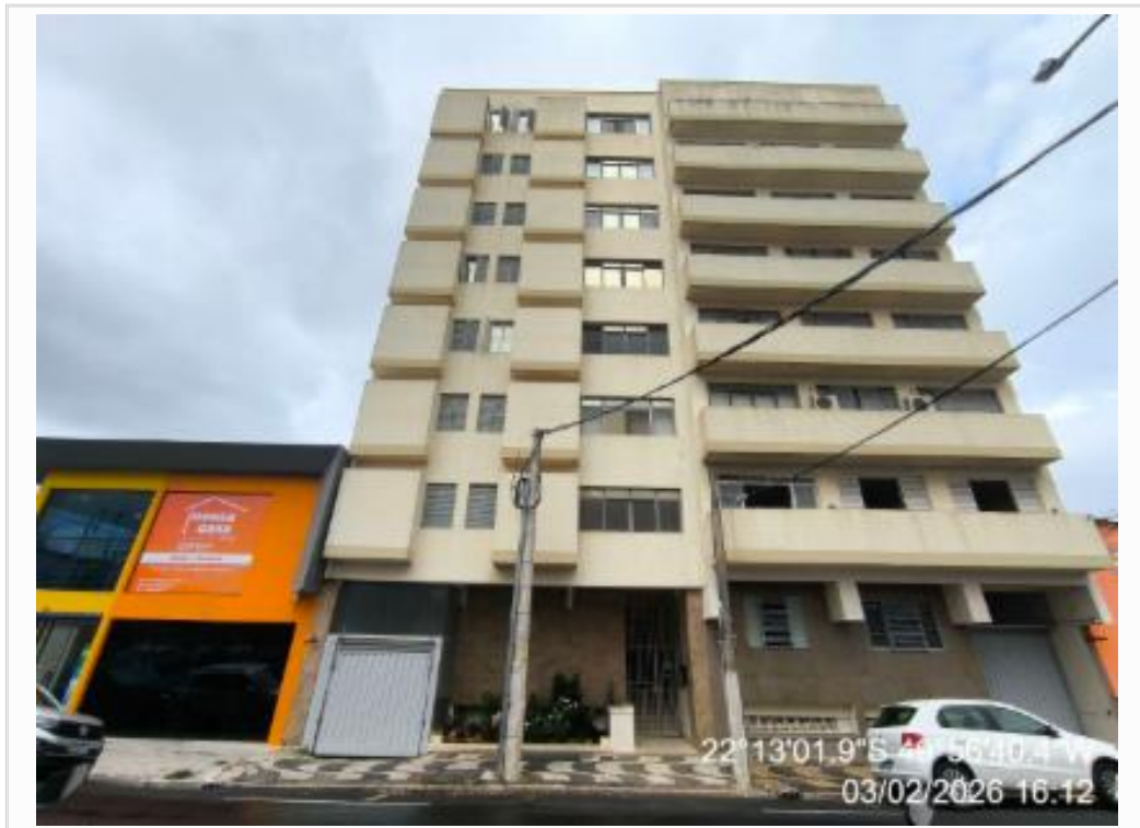
FACHADA DO CONDOMINIO