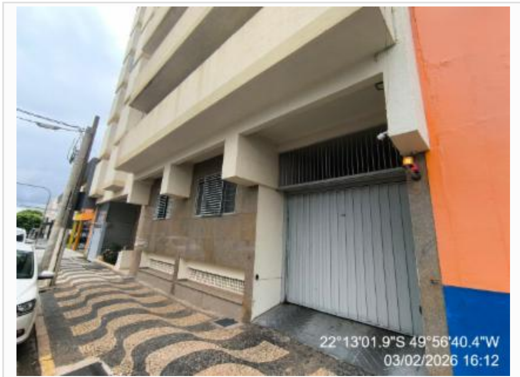
FACHADA DO CONDOMINIO