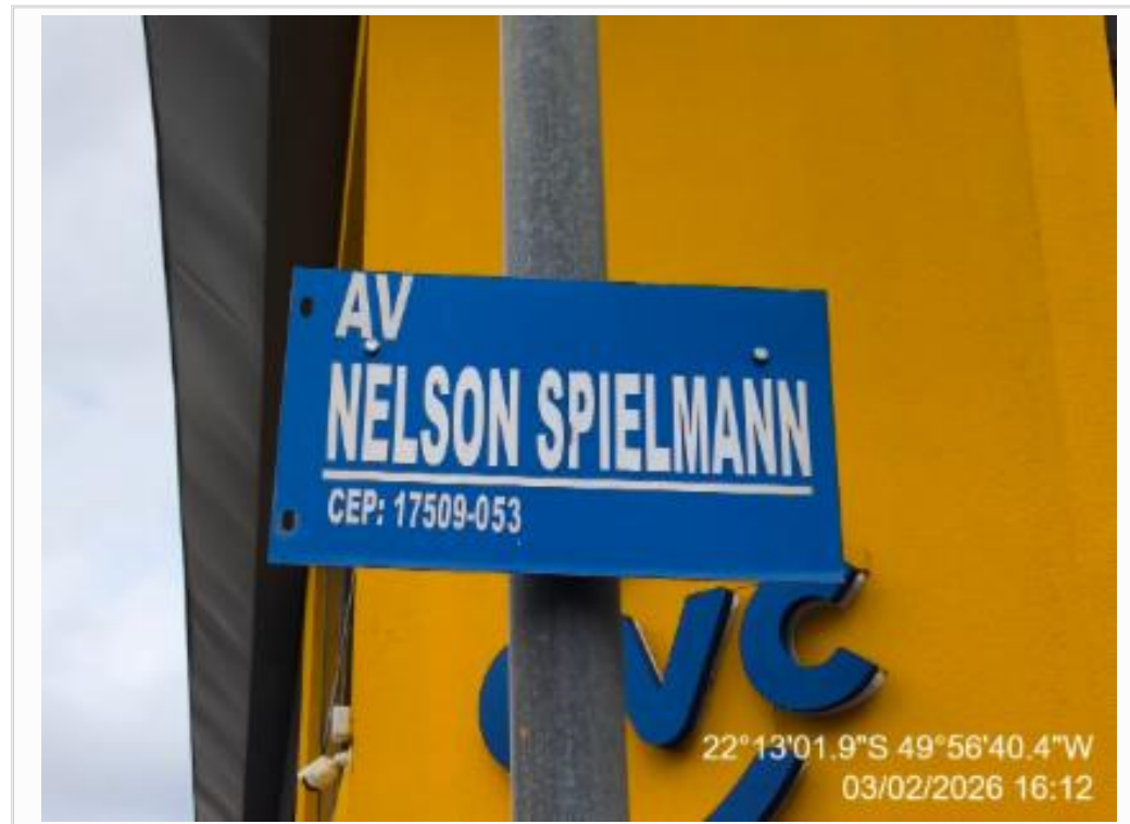
PLACA DE RUA