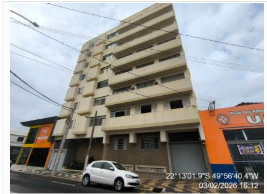
FACHADA DO CONDOMINIO