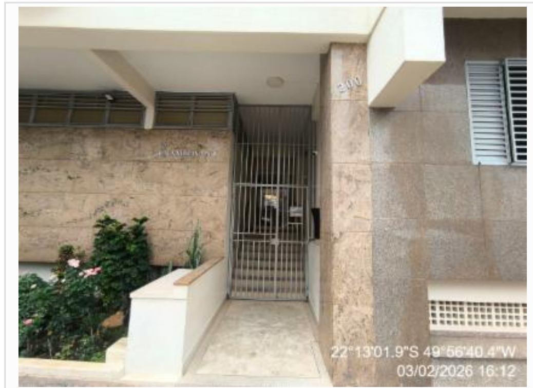
HALL DE ENTRADA