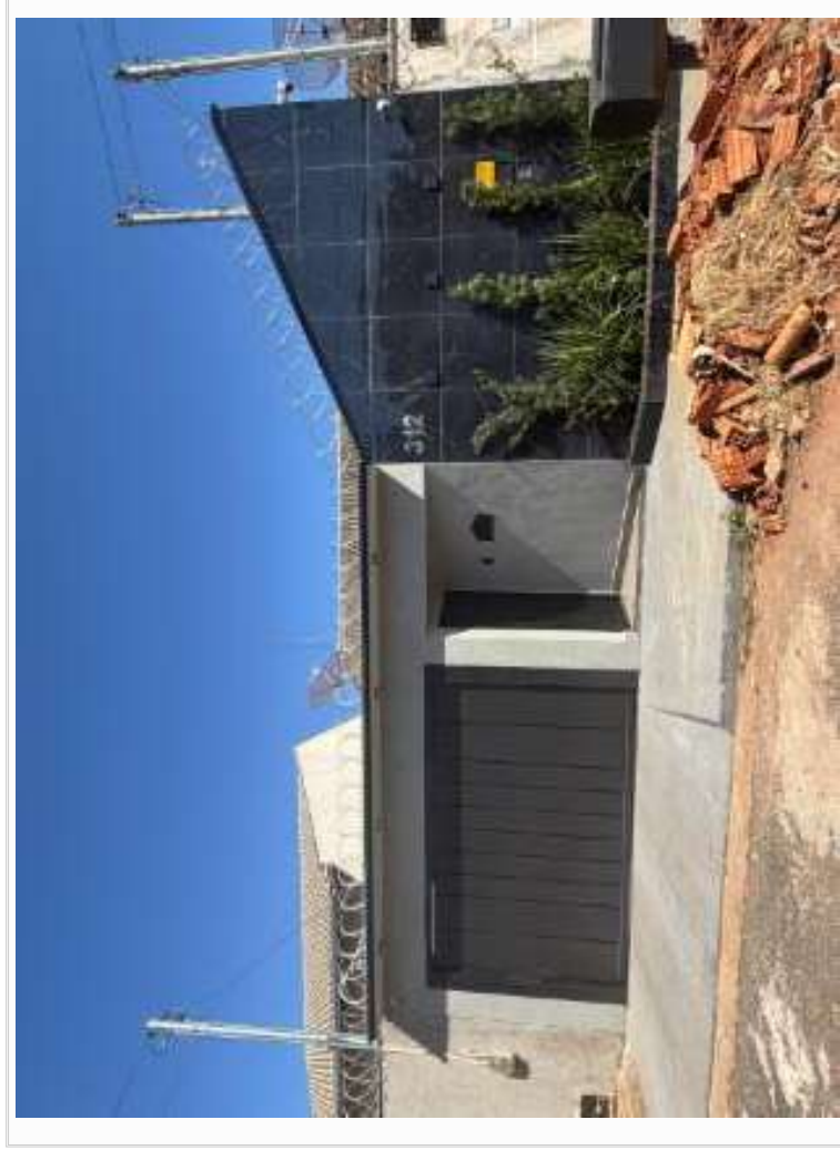
Vizinho à esquerda - identificação