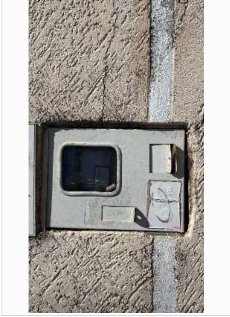
Medidor de energia