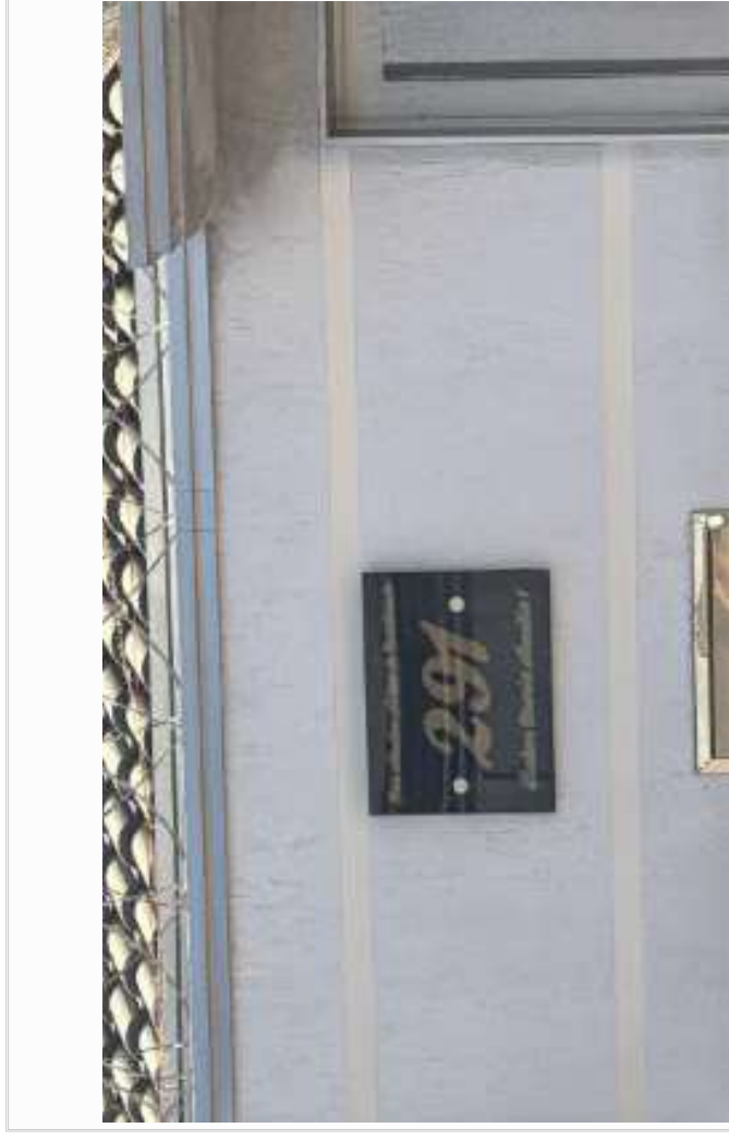
Vizinho frontal - identificação