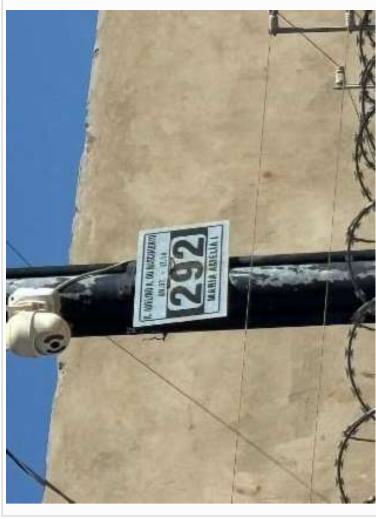
Vizinho à direita - identificação