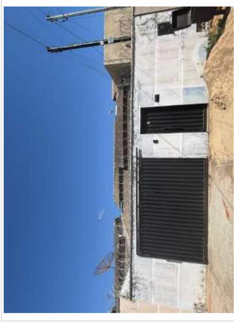
Vizinho à direita