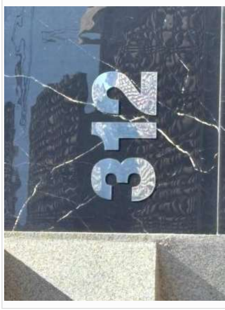
Vizinho à esquerda