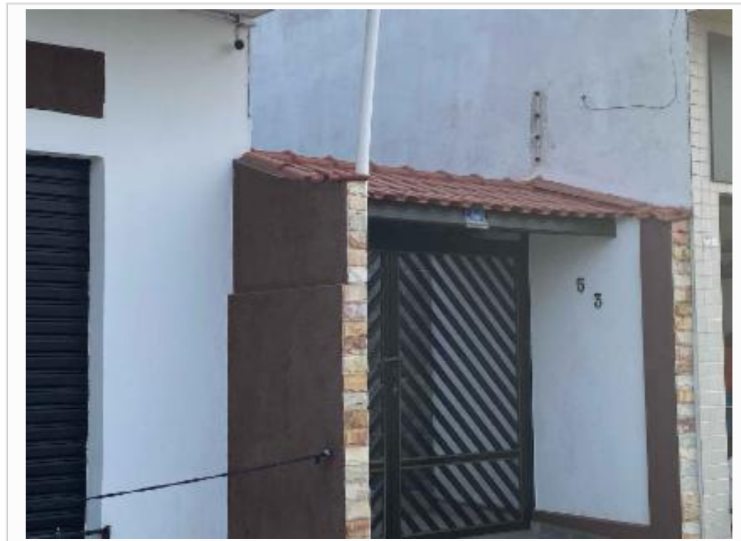
confrontante a direita