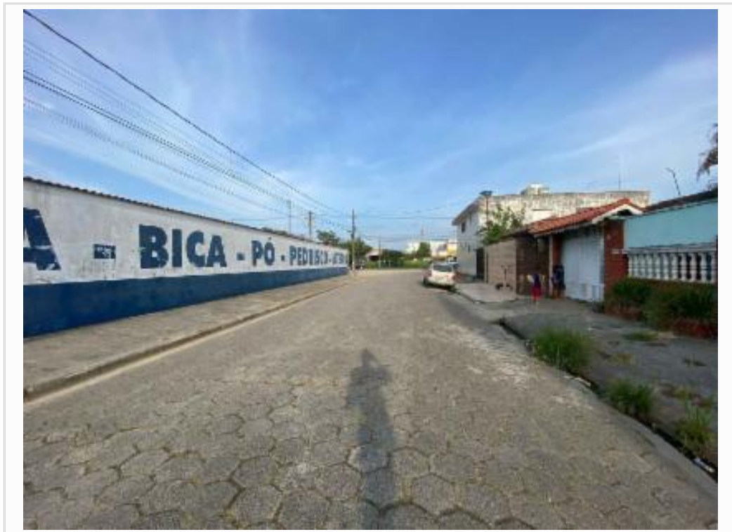
vista a esquerda