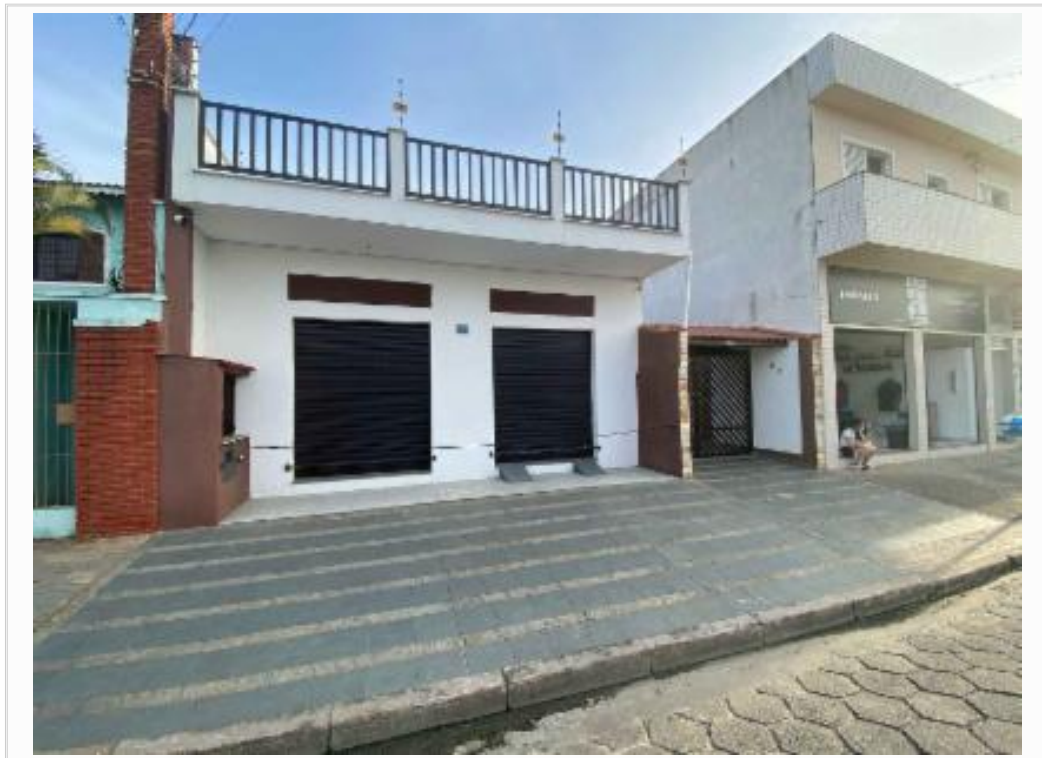
confrontante a direita