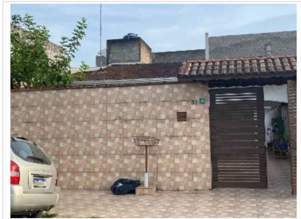
confrontante a esquerda