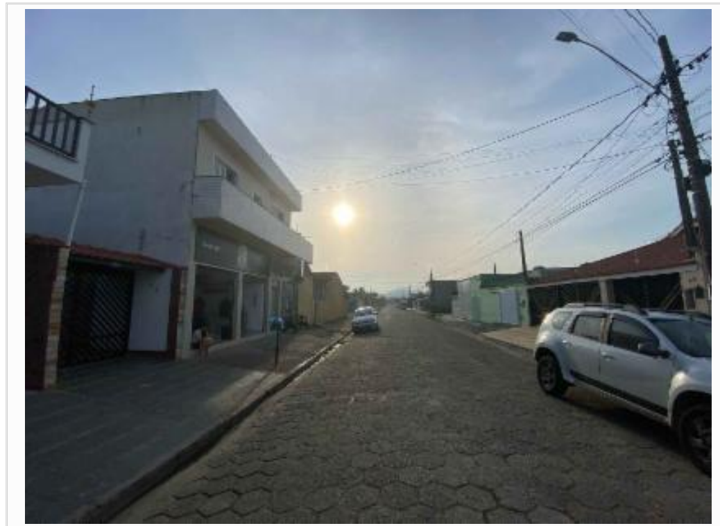
vista a direita