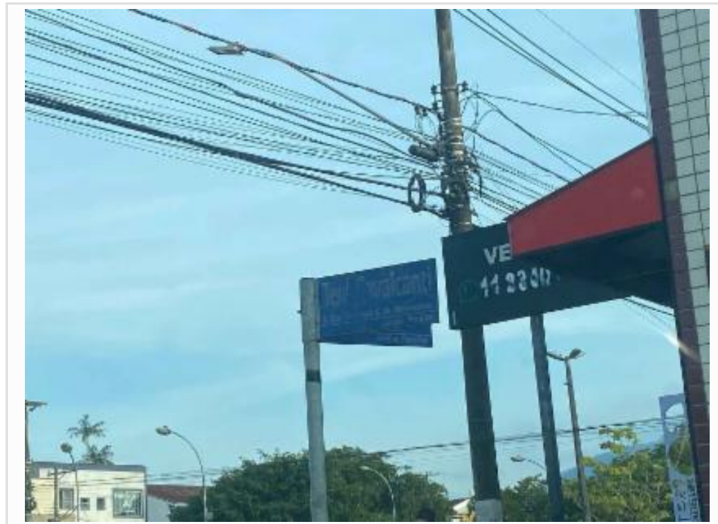
placa da rua