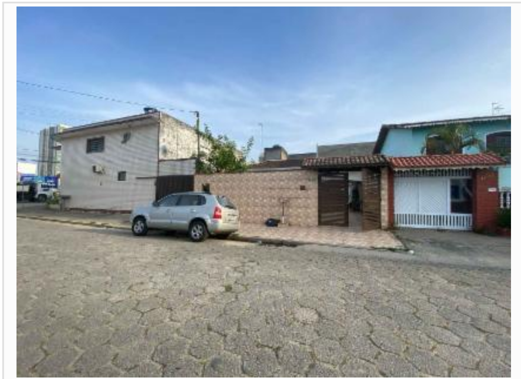
confrontante a esquerda